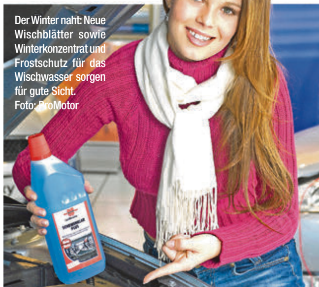
Der Winter naht: Neue Wischblätter sowie Winterkonzentrat und Frostschutz für das Wischwasser sorgen für gute Sicht.

Über die richtige Einstellung von Lüftung und Heizung informiert die Bedienungsanleitung. Die Klimaanlage bringt nicht nur die frische Brise im Sommer, sondern entzieht der Innenluft Feuchtigkeit, und das Öl im Kältemittel schmiert die Bauteile – Kompressor und Gummidichtungen. Fünf Minuten wirken da schon wahre Wunder. Komfortabel, wo eine Standheizung für den Durchblick sorgt.