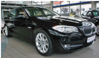
BMW 530d Touring Aut. F11 € 34.950 EZ: 09/2010, 100.000 km, 180 kW (245 PS), Automatik, Diesel, Bordcomputer, Einparkhilfe, Panorama-Dach

Tel.: 0511 – 3505910 Fax: 0511 – 3505920