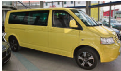
Volkswagen Multivan Lang DPF € 27.950 EZ: 07/2009, 64.950 km, 128 kW (174 PS), Servolenkung, Tagfahrlicht, Traktionskontrolle, Tempomat, Anhängerkupplung