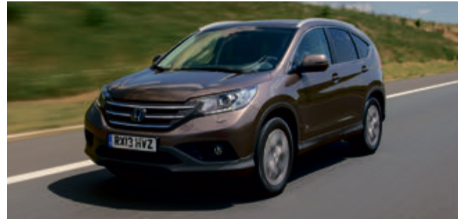
Auch mit dem sparsamen Diesel bleibt der CR-V ein praktisches Transporttalent mit einem Ladevolumen von bis zu 1.669 Litern.

Von den Qualitäten des neuen CR-V 1.6 Diesel kann sich jetzt jeder selber überzeugen: bei einer Probefahrt im Autohaus Moritz in der Bernd-Rosemeyer-Str. 2 in Laatzen, Telefon 05102-93880 oder in der Philipp-Reis-Str. 34 in Springe, Telefon 05041-77660.