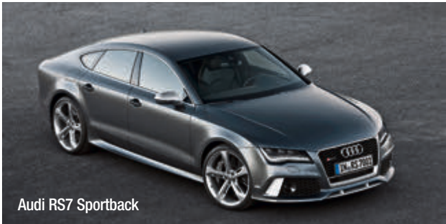
Audi RS7 Sportback