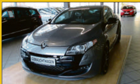
Renault Mégane TCe 250 Coupé Renault Sport EZ 09/10, 44.007 km, 184 kW (250 PS) Grau Metallic 14.975,- €