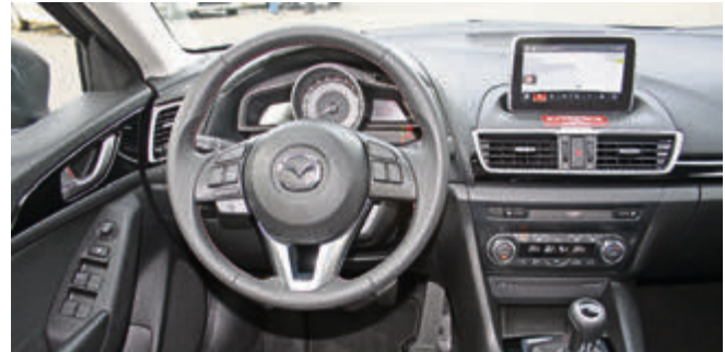
Aufgeräumt und hochwertig: das Cockpit punktet mit 7-Zoll-Touchscreen, guter Übersichtlichkeit und ansprechender Materialanmutung.

Außerorts merkt man dann, dass das Fahrwerk eher sportlich straff ausgelegt ist, aber trotzdem auch schlecht geflickte Wege er-