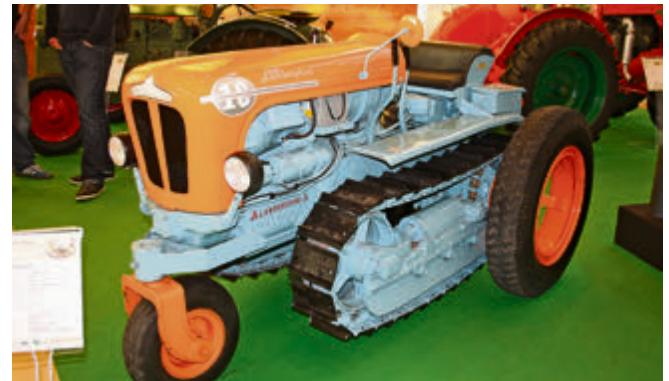
Als Lamborghini noch ausschließlich Traktoren baute, entstand unter anderem dieser Diesel-Traktor mit Raupenantrieb.