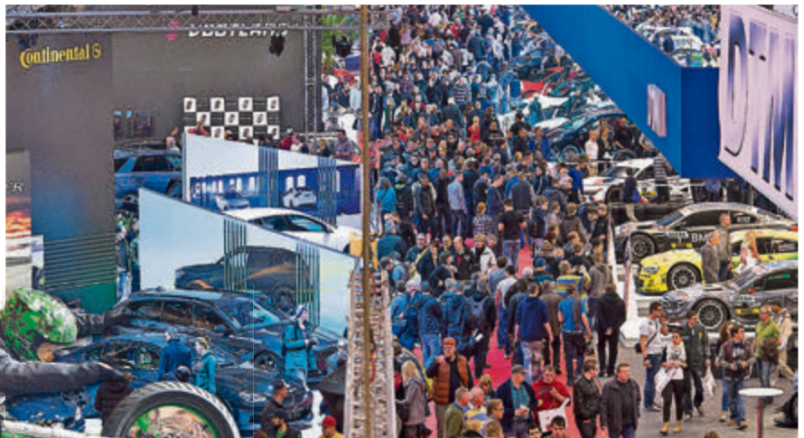
Wieder einmal volles Haus in Essen, hier die gut gefüllte Halle 3.