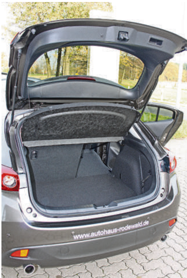
Der Kofferraum fasst 364 Liter und lässt sich durch Umklappen der Rücksitzelehnen auf bis zu 1.263 Liter erweitern. Praktisch: dabei entsteht eine ebene Ladefläche.

Mit dem neuen Mazda3 kann man mehr Sport wagen. Mit dynamischem Äußeren und einem ebensolchen Benzin, hochwertiger Ausstattung und ebensolcher Verarbeitung ist der junge Japaner eine Klasse Alternative in der Kompaktklasse.