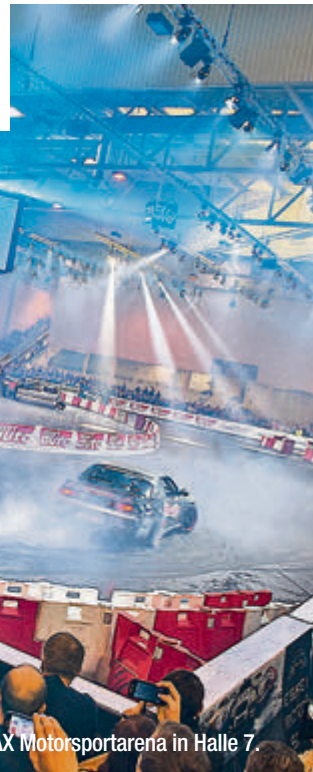
Und hoch die Handykameras: Spektakuläre Motorsport-Action in der DMAX Motorsportarena in Halle 7.