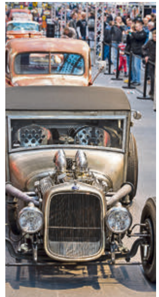
Sonderschau Hot Rods, die diesmal unter dem Motto „get low and go slow“ stand. Wie der Name verrät: Hier ging es um die Geschichte des Tieferlegens.