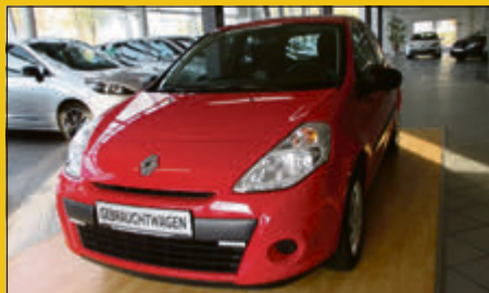
Renault Clio 1.2 16V 75 Yahoo! EZ 09/12, 4.707 km, 55 kW (75 PS) Rot 8.475,- €