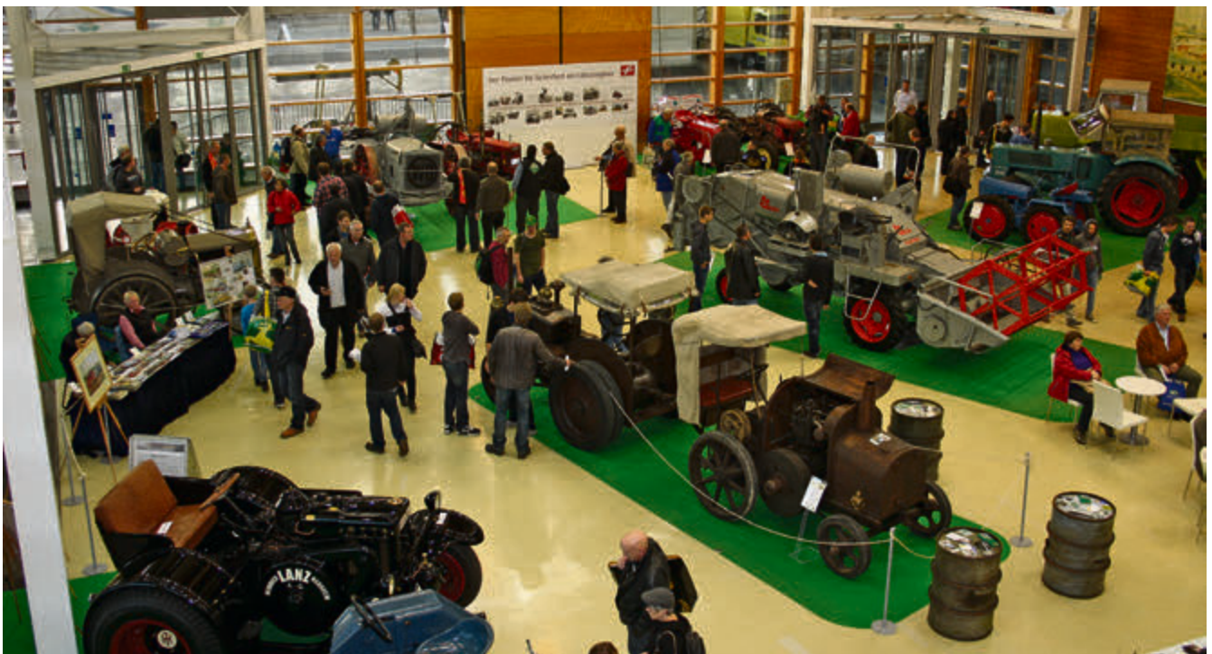
Knapp 40 Exponate visualisierten auf der AGRITECHNICA die Mechanisierung der Landwirtschaft verbunden mit dem Siegeszug des Dieselmotors.

Trumm, das aufgrund der erforderlichen Kompressoranlage nicht in Fahrzeuge eingebaut werden konnte. Später war es dem Benz-Ingenieur Prosper L'Orange mit Entwicklung der Vorkammer gelungen, dieses Problem zu lösen – damit stand der Diesel auch Fahrzeugbauern zur Verfügung. Nach dem ersten Weltkrieg arbeiteten verschiedene Firmen intensiv an Dieselfahrzeugen, in erster Linie für landwirtschaftliches Gerät. Davon zeugen die beiden sehr seltenen Exponate in Hannover: ein MWM Motorpferd von 1925 in Originalzustand, von dem es weltweit nur noch 3 oder 4 Stück gibt sowie der Benz-Sendling OE Schlepper von 1928, liebevoll restauriert von der Firma Dreyer in Alfeld (die HILDESHEIMmobil berichtete in Ausgabe 18). Er verfügt über einen kompressorlosen Einzylinder-Viertakt-Dieselmotor.