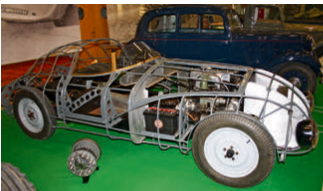
Der Wiederaufbau des Hanomag Weltrekordlers – ebenfalls mit Diesel unter der Stromlinienfront – schreitet voran.