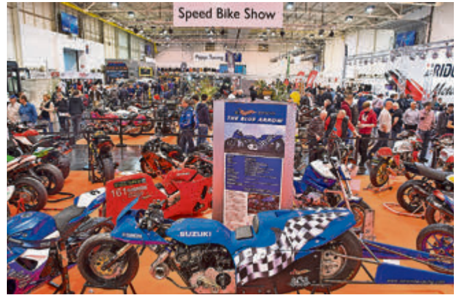
In Halle 4 präsentierte sich die Speed Bike Show mit teils krasen Exemplaren.