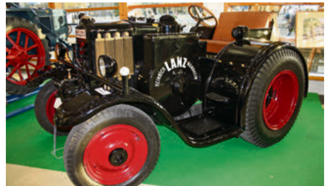
Die Heinrich Lanz AG beschränkt mit ihrem Glühkopfmotor – wie hier im Verkehrsbulldog von 1929 – 30 Jahre lang einen eigenen Weg.