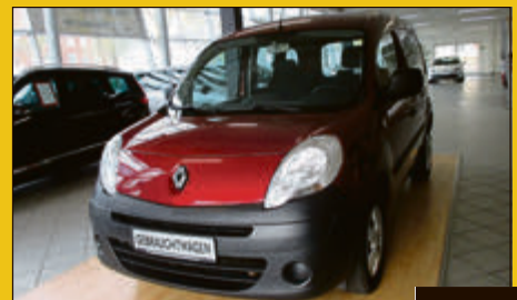
Renault Kangoo dCi 75 FAP Authentique EZ 10/10, 42.942 km, 55 kW (75 PS) Rot Metallic 8.975,- €