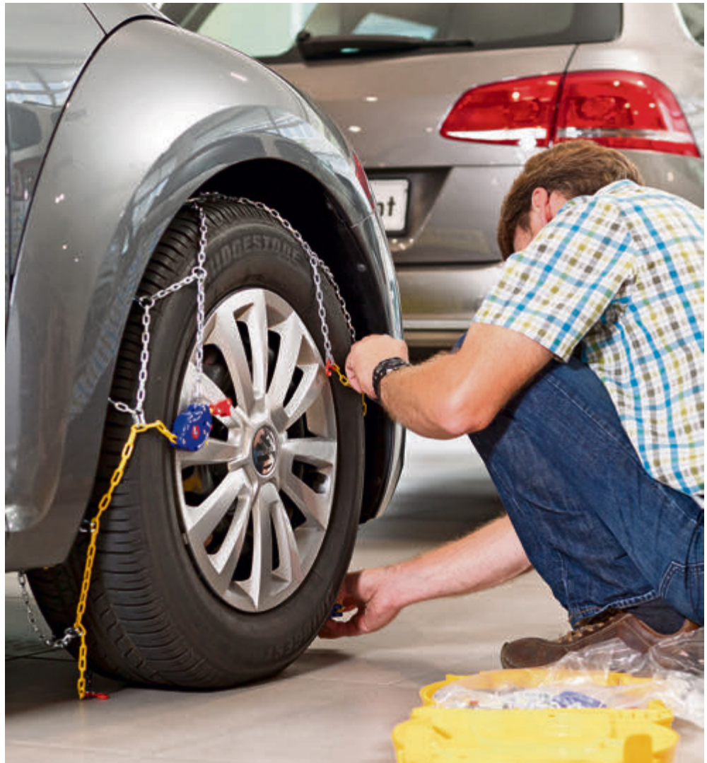
Endlich Winterurlaub! Für die Reise in den Schnee sollten Autofahrer auch Schneeketten in den Kofferraum packen.

sendimensionen für die Größenwahl. Vor der griffigen Tour mit maximal Tempo 50 steht die Entscheidung: kaufen oder mieten? Autohäuser, Zubehörhandel und Automobilklubs bieten reichlich Auswahl.