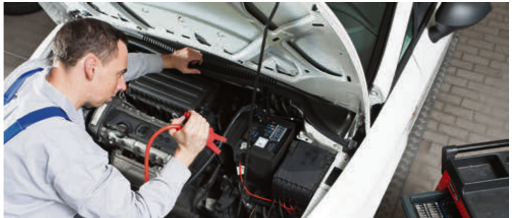
Die Batterie hat im Winter den meisten Stress. Schwächelnde Akkus werden mit Ladegeräten auf Trab gebracht.

Sie hat im Winter den meisten Stress. Schwächelnde Akkus werden mit Ladegeräten auf Trab gebracht, Batteriewächter halten die Fahrer über den Ladezustand auf dem Laufenden. Die größte Herausforderung lautet jedoch: Strom sparen. Kurzstrecken möglichst vermeiden und En-