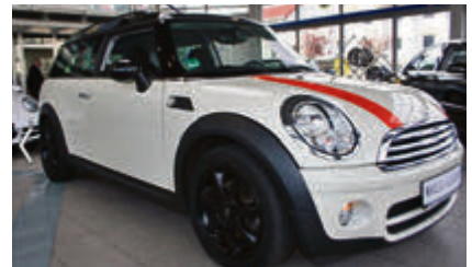
MINI Cooper D Aut. Clubman € 15.500 EZ: 10/2009, 64.206 km, Diesel, 80 kW (109 PS), Automatik, Bordcomputer, Sitzheizung, Tempomat, Leichtmetallfelgen