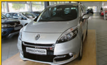
Renault Scénic 1.6 16V 110 Dynamique EZ 05/12, 19.920 km, 81 kW (110 PS) Silber Metallic 14.975,- €