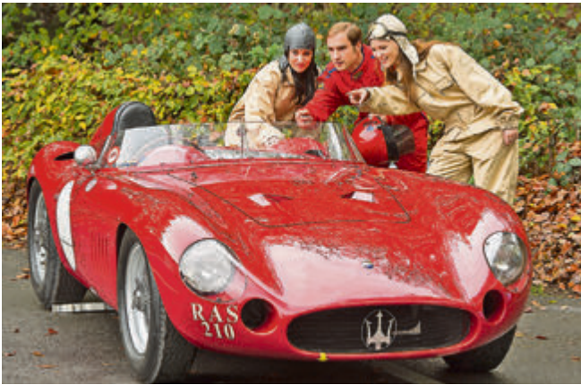
Einen Blick auf den 100. Geburtstag von Maserati gab es in Essen unter anderem mit dem Maserati Tipo 300S. Unter dessen Motorhaube versteckt sich ein Reihen-6-Zylinder-Motor mit 2.988 cm 3 Hubraum. Bei einer Leistung von 260 PS bringt es der rote Flitzer auf eine Höchstgeschwindigkeit von bis zu 300 Stundenkilometern. Stirling Moss behauptet heute noch, er sei wohl der beste Rennsportwagen der 1950er Jahre.

Hier einige Impressionen der Essen Motor Show: