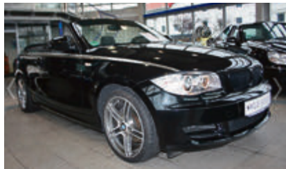
BMW 120i Cabrio Performance € 20.900 EZ: 12/2010, 41.644 km, 125 kW (170 PS), Schaltgetriebe, Sitzheizung, Bordcomputer, Einparkhilfe, Sportsitze