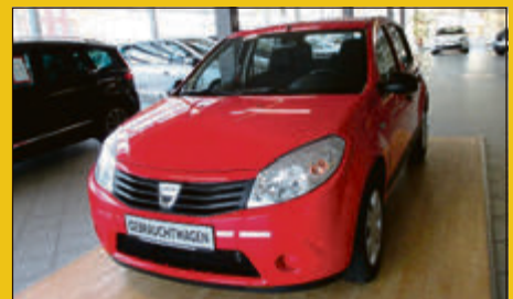
Dacia Sandero 1.2 16V eco² EZ 11/09, 17.847 km, 55 kW (75 PS) Rot 6.375,- €