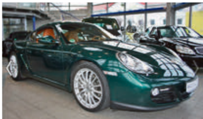
Porsche Cayman PDK Sport € 35.550 EZ: 03/2009, 33.442 km, 195 kW (265 PS), Automatik, Leichtmetallfelgen, Bordcomputer, Sportpaket, Bluetooth