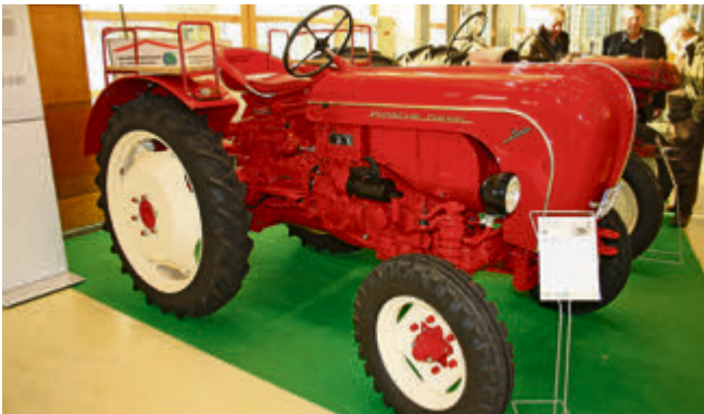
Auch Porsche hatte bereits lange vor dem Cayenne einen Diesel im Angebot: unter anderem den AP 22 von 1956.