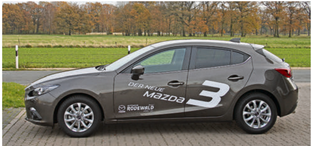
Lange Motorhaube, zurückgesetzte, coupéhafte Fahrgastzelle und eine geschwungene Linienführung: der Mazda3 wirkt schon im Stand sportlich.

ben den Funktionen des Infotainment- und Kommunikationssystems können hier dank des brandneuen Mazda Konnektivitäts-Konzept MZD Connect auch zahlreiche mobile Internet-Inhalte abgerufen werden. Der Touchscreen funktioniert allerdings nur im Stand – während der Fahrt scrollt man mit Hilfe des Dreh-Drück-Schalters durchs Menü. Und der