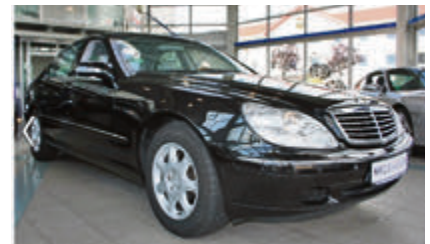
Mercedes-Benz S 320 € 15.450 EZ: 05/2002, 46.164 km, 165 kW (224 PS), Automatik, Regensensor, Bordcomputer, Lichtsensor, Leichtmetallfelgen

Autohaus Nikolai Garagen GmbH | Rendsburger Str. 5 | 30659 Hannover | Tel.: 0511 – 3505910, eMail: info@nikolai-garagen.de