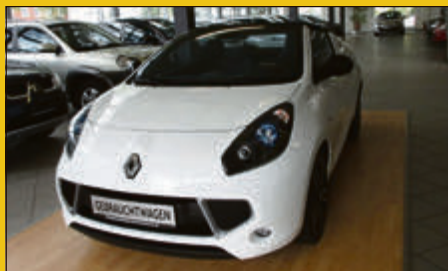
Renault Wind TCe 100 Night and Day EZ 05/11, 27.003 km, 75 kW (102 PS) Weiß 10.975,- €