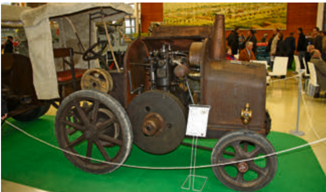
Weltweit nur noch 3 bis 4 Exemplare erhalten: das MWM Motorpferd von 1925 in Originalzustand.