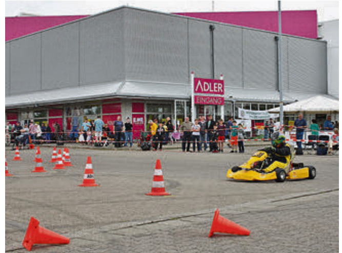
Motorsport am Modemarkt: der Parkplatz von Adler in Altwarmbüchen wurde kurzerhand zur Rennstrecke.