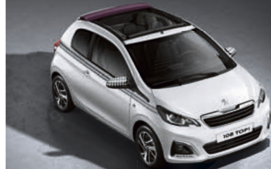
Abb. enthält Sonderausstattung.