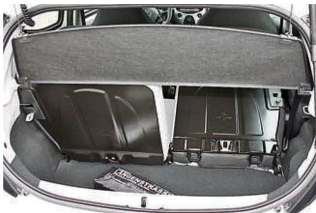
In den 168-Liter Kofferraum passt jetzt auch eine handelsübliche Wasser- oder Bierkiste. Wer mehr Durst hat, kann die Rücksitzlehnen umklappen.