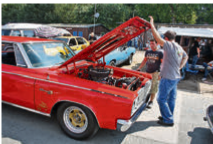
Benzingespräche am V8.