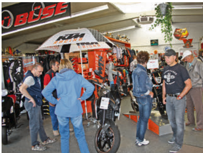
Großer Andrang zum Jubiläum: Auf 300 Quadratmetern Verkaufsfläche konnten die Besucher die neusten Modelle von KTM, Aprilia, Vespa und Co begutachten sowie bei Bekleidung und Technikzubehör stöbern.

Nationalmannschaft bei den Mannschaftsweltmeisterschaften, den Six Days, begutachtet.