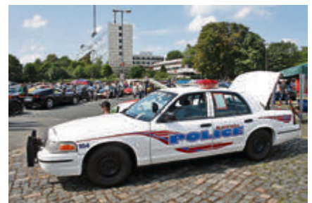
Ford Crown Victoria Police Car von 1999 im Originalzustand.