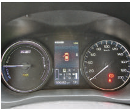
Übersichtliches Cockpit mit großem Display und spezifischen Infos zum Hybridantrieb.

Natürlich funktioniert das Aufladen auch über die heimische Steckdose (innerhalb von 5 Stunden) oder unterwegs über eine Schnellladestation. Der Clou: der gespeicherte Strom kann unterwegs