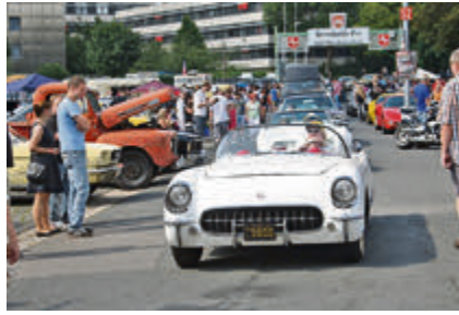
Sehen und gesehen werden: die Besucher freuten sich über jeden Ami, wie diese Corvette.