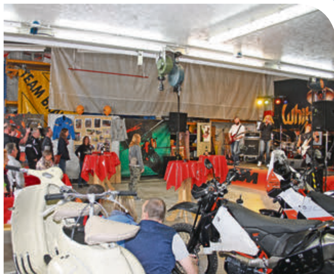
Werkstatt wird Konzertsaal: Wo sonst Motorräder ihren professionellen Service bekommen, rockte zur Jubiläumsfeier die Band White Purple.

Unter Motocross- und Enduro-Fans sprach sich schnell herum, dass dort im kleinen Emmerke kompetent