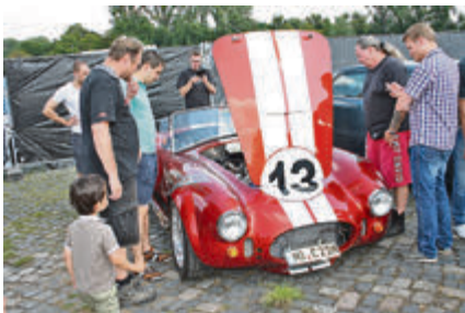
Diese Cobra hat was unter der Haube!