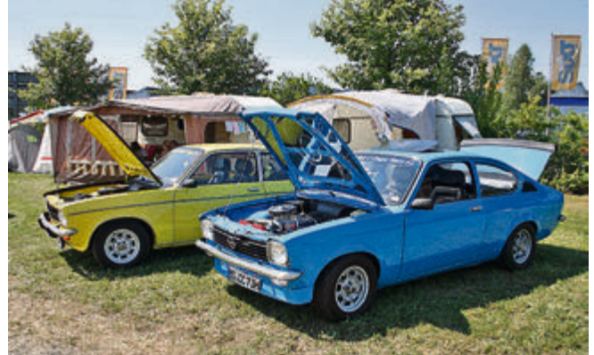
Zweimal Kadett C-Coupé.