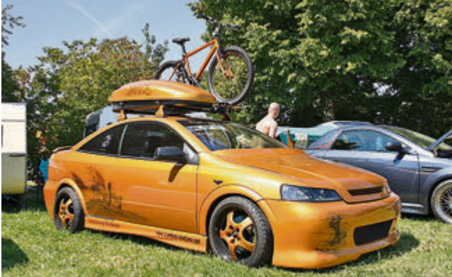
Da passt das Dachgepäck zum Auto.