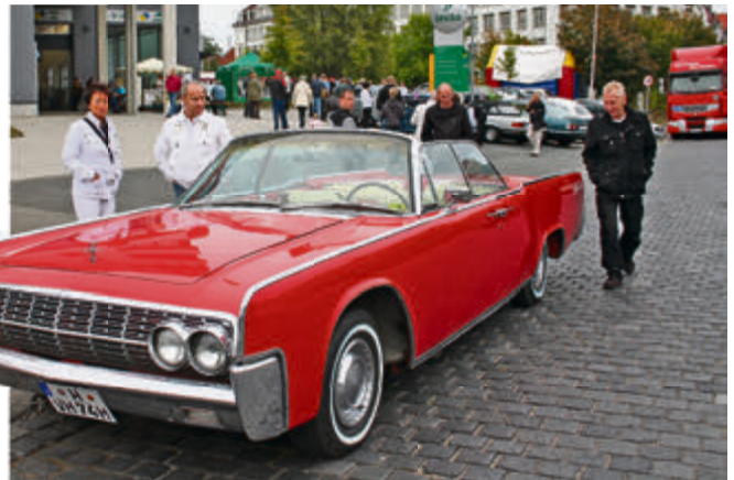
Eine bunte Auswahl von schmuckem „Altmittel“ trifft sich auf dem DEKRA Gelände in der Hanomagstraße 12 in Hannover.

Für das leibliche Wohl ist mit allerlei Leckereien ebenfalls gesorgt, für die Kinder steht eine Hüpfburg bereit und es gibt dezente Live-Musik. Beginn ist ab 10 Uhr, Ende gegen 16 Uhr.