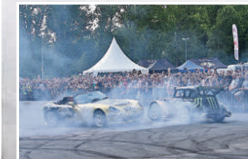
Stuntfahrer Terry Grant lässt es qualmen – und alle freuen sich!