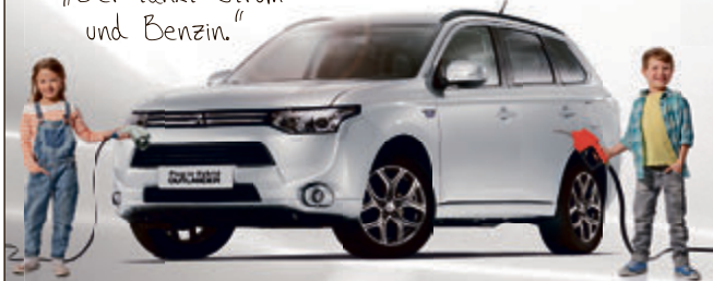
Abbildung zeigt Sonderausstattung.