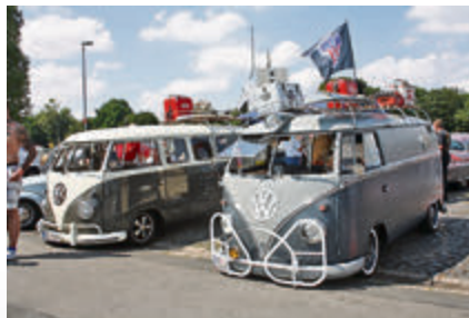
Cool – auch ohne V8: VW T1 im California Style.