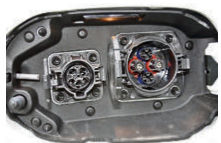
Den Outlander Pug-in Hybrid kann man an einer Schnellladestation sowie an der heimischen Steckdose aufladen.