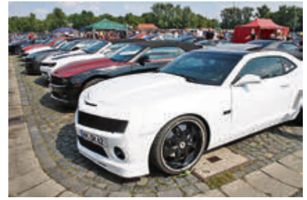
Auch die modernen Camaros & Co durften nicht fehlen.