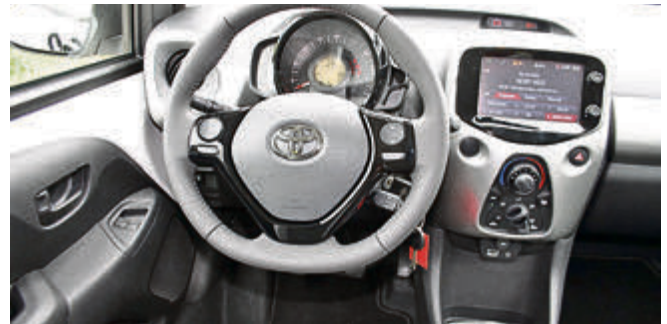
Übersichtliches Cockpit mit großem Kombi-Instrument hinterm Lenkrad und 7-Zoll-Touchscreen in der Mittelkonsole.