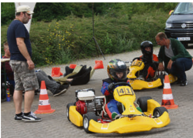
Volle Konzentration vor dem Start!