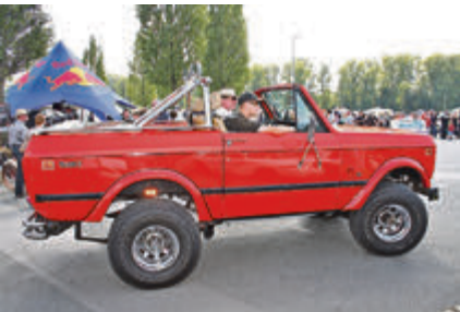
Offen cruisen im Scout II.