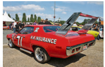
Das ist mal ein ordentlicher Heckspoiler!