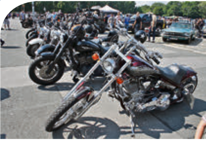
Harleys bis zum Horizont: die US-Bikes sind fester Bestandteil des Treffens.