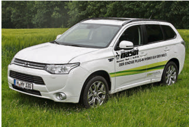
Grüne Technik: der saubere Mitsubishi Outlander Plug-in Hybrid sieht aus wie ein normaler SUV und fährt sich auch so.

Vom Mitsubishi-Händler Hasbi Automobile in Hannover bekomme ich den Sauberermann zum Testen zur Verfügung gestellt – und stelle fest: Äußerlich unterscheidet er sich kaum (bis auf ein paar Chromleisten im Kühlergrill) von einem konventionellen Outlander. Warum auch? Schließlich ist der Outlander ein ansprechend gestalteter Vertreter seiner Klasse, der auf 4,65 Metern Länge konservative Gelassenheit ausstrahlt. Erst beim Blick unter die Haube und auf das Schnittbild des Plug-in Hybrid im Prospekt erkennt man, welchen Aufwand die Ingenieure bei Mitsubishi betrieben haben: neben einem 2-Liter Benziner mit 121 PS arbeiten an der Vorderachse noch ein Elektromotor mit umgerech-