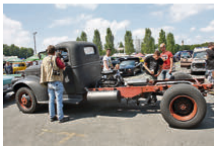
Auch eine Möglichkeit: der Motor hinterm Fahrerhaus.