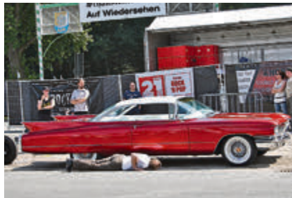
Bei diesem Cadillac lohnt das genauere Hinschauen.