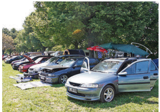
Opels aller Typen und Baujahre kamen zum Opel-Treffen auf den Messe-Campingplatz in Laatzen.