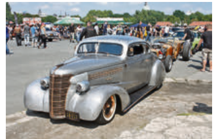
Dieser Street Rod eignet sich sogar für längere Touren – sagt der Besitzer...