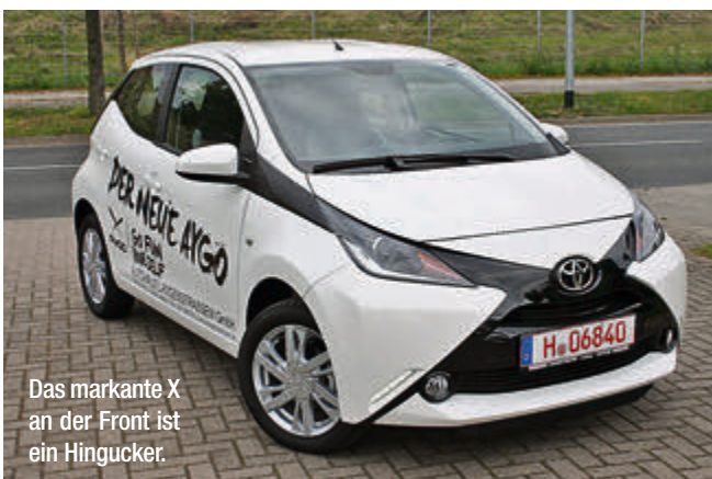
Das markante X an der Front ist ein Hingucker.

Die wiederum ermöglicht wegen etwas mehr Breite einen besseren Zugang zum Kofferraum. Und auch der ist