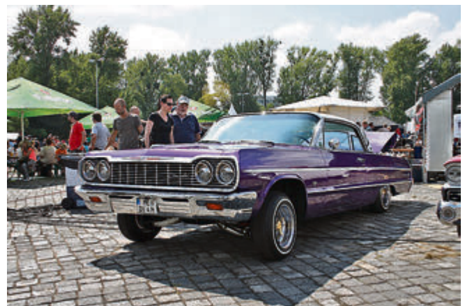
Auf und nieder, immer wieder: die Low-Rider sorgen für Spektakel.