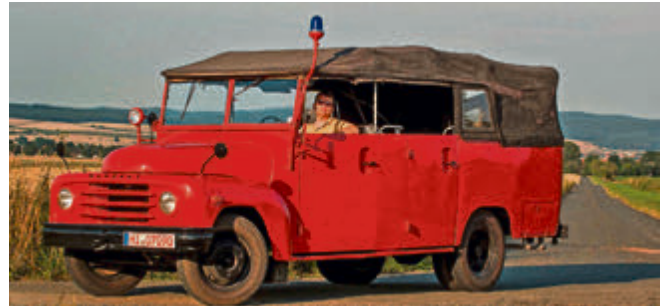
Highlight für Kinder: Beim HANOMAG-Treffen können sie in einem historischen Feuerwehrauto mitfahren!

Feuerwehrauto mitzufahren! Weitere Infos unter: www.hanomag-museum.de