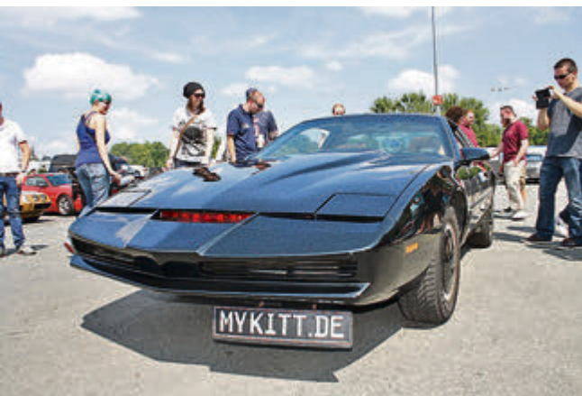
Wo ist David Hasselhoff?