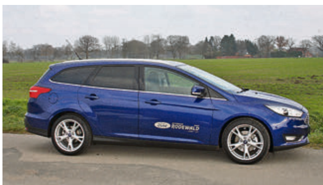
Die optionalen 18-Zöller unterstreichen den neuen, sportlicheren Look des Focus.

Neben weiteren Assistenzsystemen wie Active