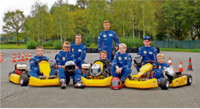
Schumis, Vettels und Rosbergs von morgen: Die aktuelle Kart-Gruppe mit den clubeigenen Karts auf dem Übungsplatz.