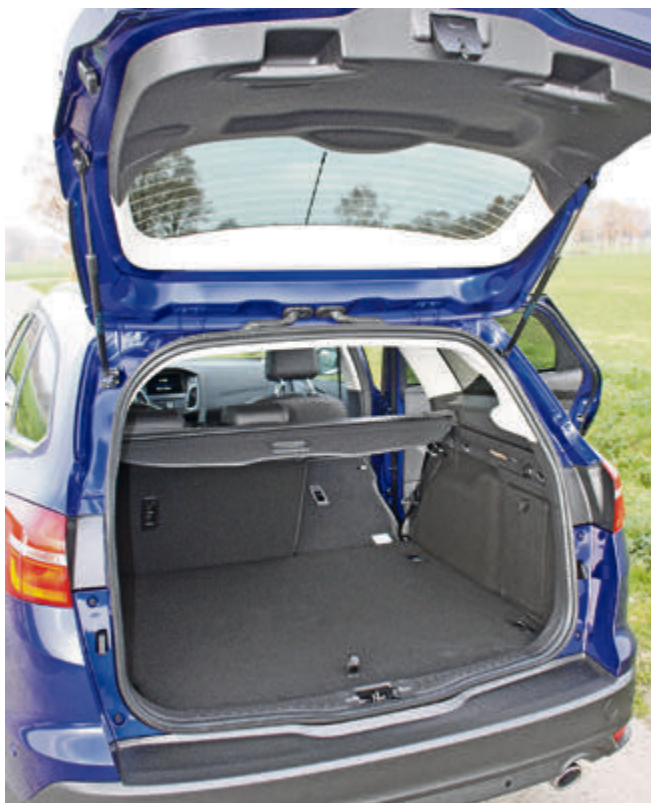
Das variable Gepäckabteil fasst – je nach Konfiguration – 476 bis 1516 Liter.

Mission gelungen: dank modernster Assistenzsysteme, agiler und effizienter Motoren und dem neuen sportlicheren Look ist der Focus bestens für eine erfolgreiche Zukunft gerüstet – und hat gute Chancen, auch weiterhin an der weltweiten Spitze der Verkaufstatistik zu stehen.