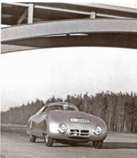
Der Hanomag-Diesel im Februar 1939, vor 75 Jahren, auf der Rekordstrecke bei Dessau

Im geführten Konvoi ging es zur Autobahn und nachdem sich der Nebel verzogen hatte, gaben die örtlichen Polizeikräfte grünes Licht für die Demonstrationsfahrt auf der ehemaligen Rekordstrecke. Auf den Bauhausbrücken hatten sich zahlreiche Schaulustige eingefunden, die sich das Ereignis nicht entgehen lassen wollten. Nach erfolgreichem Verlauf waren die seltenen Rekordfahrzeuge noch unter der Ju 52 im Technikmuseum Hugo Junkers zu bestaunen. Für die Veranstalter steht schon jetzt fest: 2019, zum 80. Geburtstag der Rekordstrecke, wird es eine Wiederholung geben.