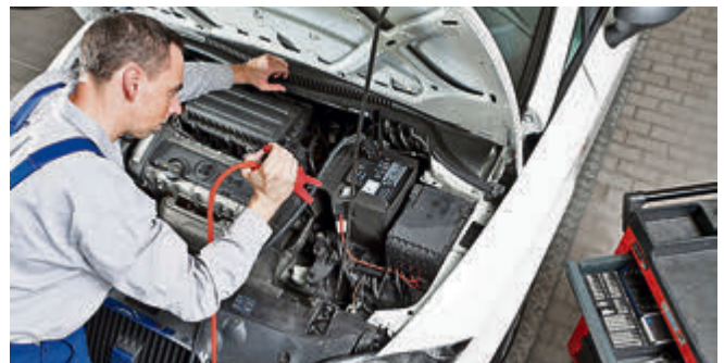
Pannensuche im Winter Nummer 1: Die Batterie. Damit alles wie am Schnürchen läuft, brauchen die Stromspender Pflege.