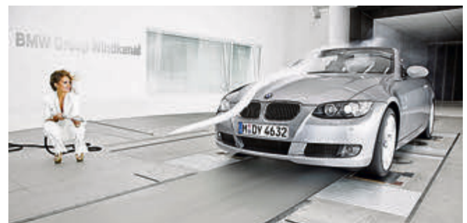
In einem Windkanal kann der cw-Wert eines Autos ermittelt werden.

Das ist natürlich bei unseren normalen Autos nicht der Fall, sie werden eher wackelig bei erreichter Höchstgeschwindigkeit. Also merken: bei voller Fahrt beide Hände ans Lenkrad und erst recht nicht zum Gruß aus dem Fenster winken. Im Namen des cw-Wertes, der Sicherheit und des geringen Kraftstoffverbrauches.