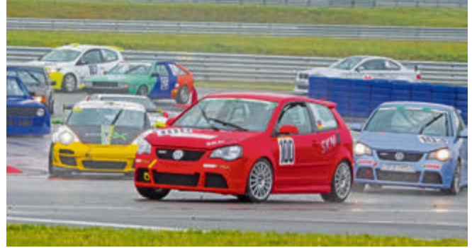
Getümmel auf der Rundstrecke: Clubmitglied Maximilian Karsten im Cup-Polo vorne weg.