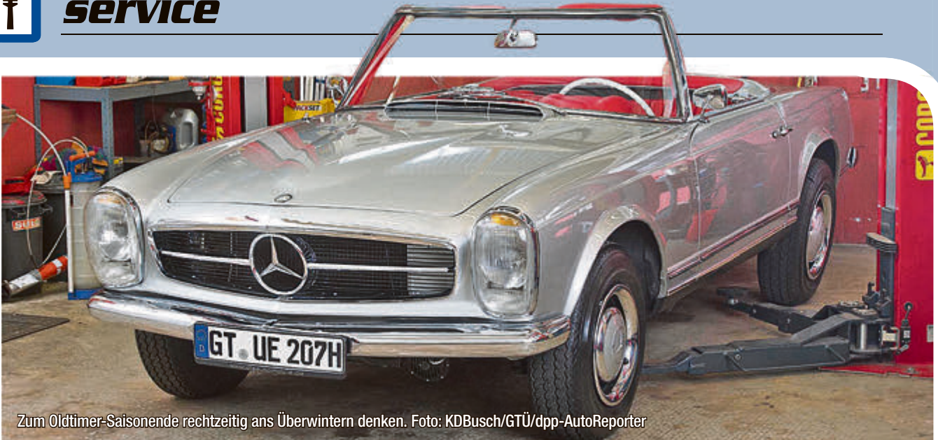
Zum Oldtimer-Saisonende rechtzeitig ans Überwintern denken.