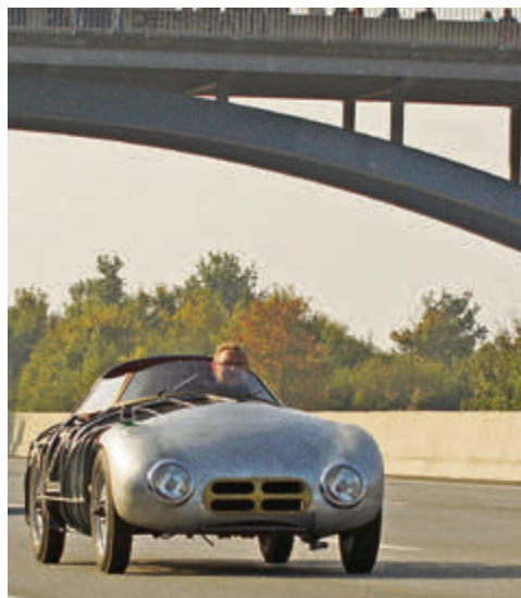
Das im Aufbau begriffene Fahrzeug 75 Jahre später unter der Brücke.