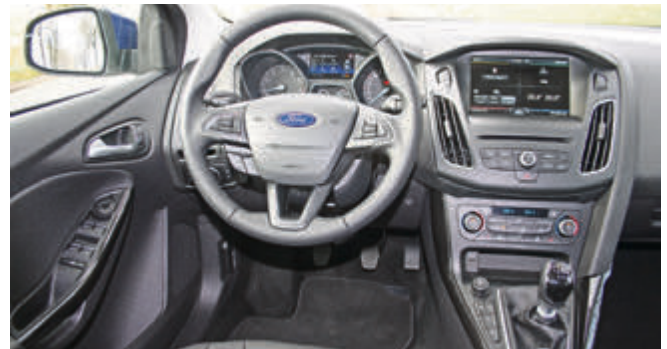
Aufgeräumt und mit optionalem 8-Zoll Touchscreen: das komplett überarbeitete Cockpit.