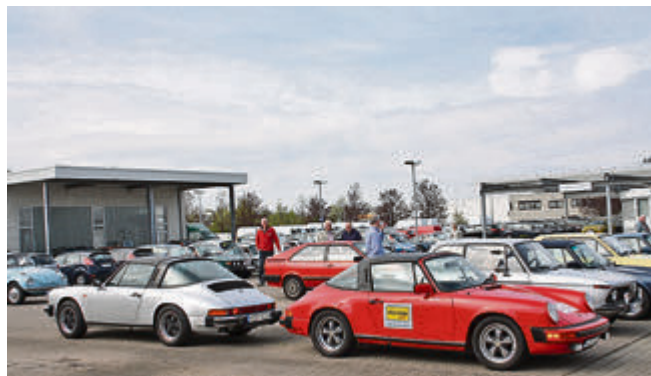
Die Teilnehmerfahrzeuge treffen ab 8 Uhr am Daimlerring ein.