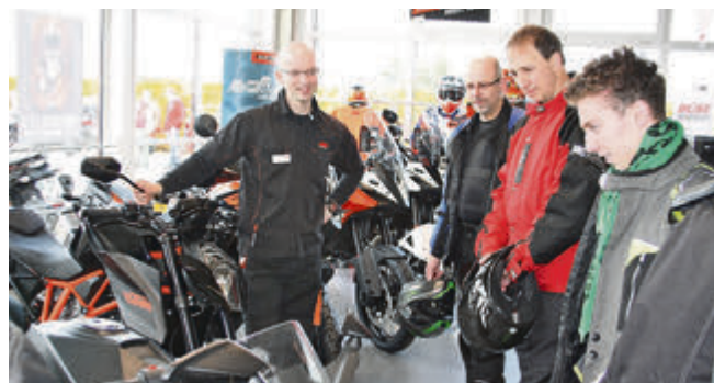
Wer die Wahl hat... Bei Bräuer Motorradsport gibt es eine große Auswahl sowie fachkundige Beratung.