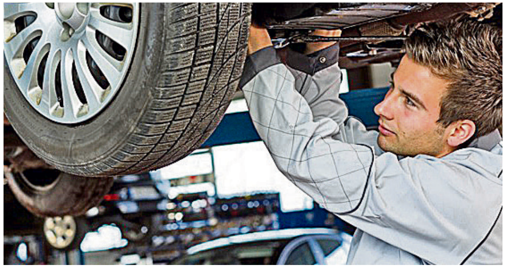
Mit dem Frühjahrscheck in den Kfz-Meisterbetrieben sind Autofahrer auf der sicheren Seite.

hergestellt, sollte er mit einer milden Politur behandelt werden. Bei guten Neufahrzeugen oder sehr gutem Pflegezustand genügt auch eine Hartwachs-Kur.