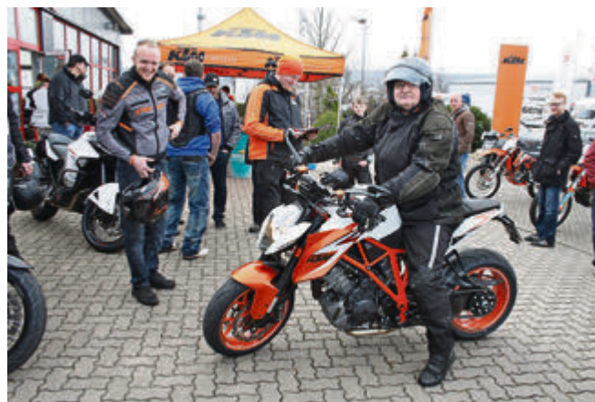
Highlight des Orange Days und beliebtes Probefahrt-Objekt: die biestige KTM 1290 Super Duke R Special Edition.