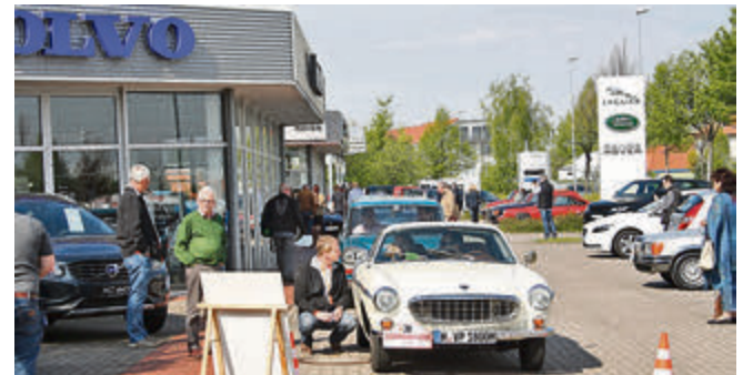
Start der „Silbernen Rose“ ist wieder beim Autohaus Hentschel.