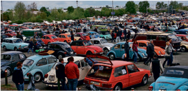
MaiKäferTreffen: Volkswagen bis zum Horizont.

Das hat schon Tradition: am 1. Mai treffen sich die Freunde luftgekühlter VW auf dem Messe-Parkplatz Ost in Hannover Laatzen, zum Mai-KäferTreffen. Und das in diesem Jahr zum inzwischen 33. Mal! Die Veranstalter erwarten wieder mehr als 3000 Käfer, VW-Busse und was die Wolfsburger sonst noch so mit luftgekühltem Heckmotor