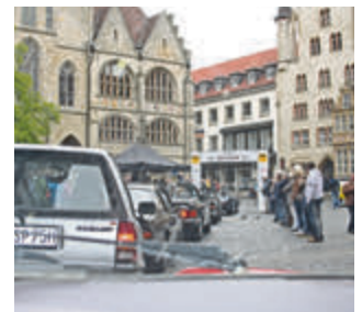
Auch in diesem Jahr findet die Zielankunft mit Fahrzeugpräsentation auf dem Hildesheimer Marktplatz statt.