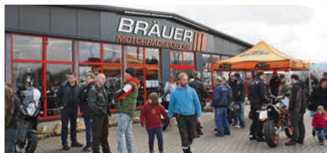
Schauen, fachsimpeln, Probe fahren: Der Orange Day bei Bräuer Motorradsport ist eine beliebte Veranstaltung zum Saisonauftakt.

Viele nutzen aber auch die Gelegenheit, sich mit neuen Klamotten für die bevorstehende Bike-Saison einzukleiden, von Handschuhen