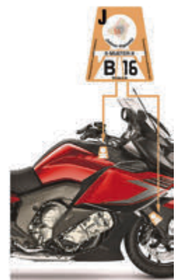
Im Auto klebt die Vignette oben in der Frontscheibe richtig, beim Motorrad an Gabelholm oder Tank.