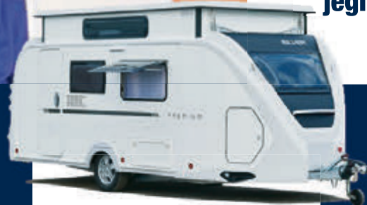
Silver Premium 450LJ