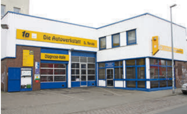
Die Autowerkstatt in der Kornstraße ist seit 10 Jahren 1a-autoservice-Partner.