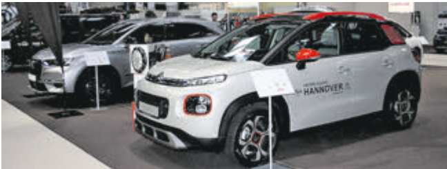
Zwei nagelneue SUV: im Hintergrund der schicke DS 7 Crossback und vorne der Citroën C3 Aircross. Das fröhliche Kompakt-SUV bietet umfangreiche Personalisierungsmöglichkeiten, das größte Kofferraumvolumen im Segment und zahlreiche intelligente Assistenzsysteme.