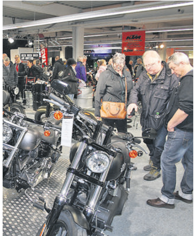
Informieren, Probesitzen und Fachsimpeln: mehrere tausend Besucher strömen auf die BikeZ, um die neuesten Modelle zu begutachten.