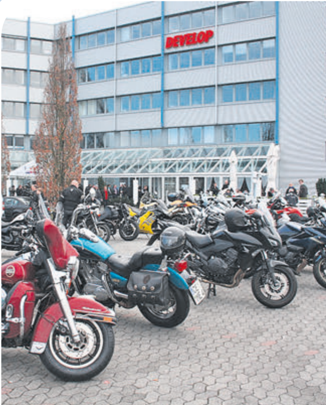
Ausflugsziel: Wenn das Wetter passt, kommen viele Biker mit der eigenen Maschine zur BikeZ.