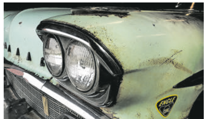
Auch V8-Survivors wie dieser Pontiac Chieftain waren auf der Bremen Classic Motorshow Anfang Februar zu sehen.