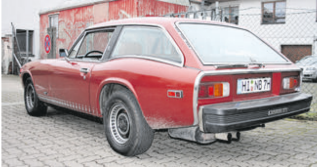
Schicke Shooting-Brake-Linie, die Heckscheibe ist gleichzeitig Kofferraumklappe.