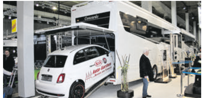
Rollendes Einfamilienhaus: Für knapp 420.000 Euro gibt es beim Concorde Liner Plus jede Menge Luxus auf fast 11 Metern Gesamtlänge. Und wie es sich für ein Haus gehört, ist die Garage gleich mit dabei...