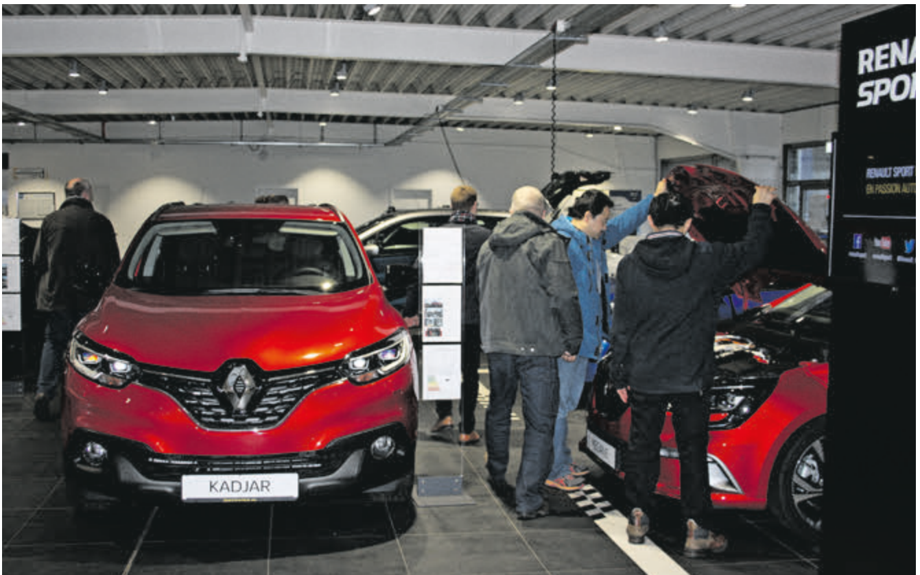
Zahlreiche Besucher machten sich am Renault-Tag bei Carunion in Döhren ein Bild von den aktuellen Modellen des französischen Herstellers.