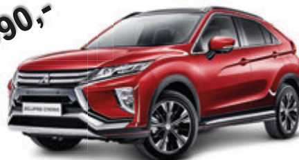
Abbildung zeigt Eclipse Cross TOP mit Panoramadach 1.5 T-MIVEC ClearTec 4WD CVT und optionalem Zubehör Eclipse Cross TOP mit Panoramadach 1.5 T-MIVEC ClearTec 4WD CVT Messverfahren VO (EG) 715/2007 Kraftstoffverbrauch (l/100 km) innerorts 8.2; außerorts 6.2; kombiniert 7.0. CO2-Emission kombiniert 159.0 g/km. Effizienzklasse C