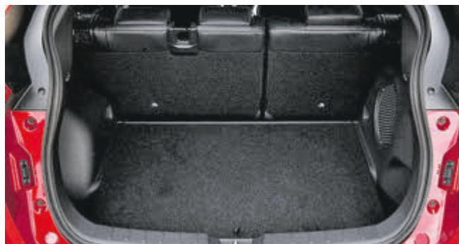
Das Gepäckraumvolumen reicht, je nach Ausstattung und Position der Rücksitzlehne, von 359 bis 1159 Liter.