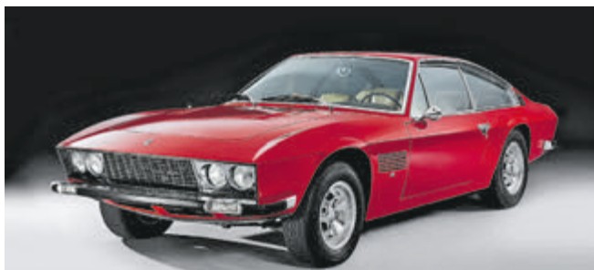
Schnellreise-Coupés wie der Monteverdi High Speed 375 L führen bei der Bremen Classic Motorshow 2018 vor.

20 englische Rennmaschinen zeigte die Sonderschau „Best of British – The TT-Legends“. Darunter waren auch Siegermaschinen wie die Velocette DOHC 350 ccm, die 1949 in der Rennklasse „Junior TT“ die Konkurrenz auf die hinteren Plätze verwies.