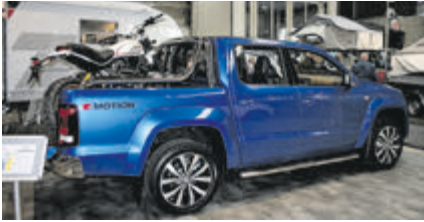
Wo der Amarok nicht mehr lang kommt, nimmt man einfach die Ducati.

tos mitgebracht. Aber auch in den anderen Hallen gab es viel Interessantes zu entdecken, wir zeigen Ihnen hier einige Impressionen: