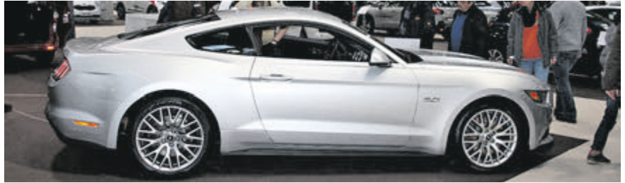
Hingucker und heißes Teil: Ford Mustang GT mit 5-Litern Hubraum und 422 PS.