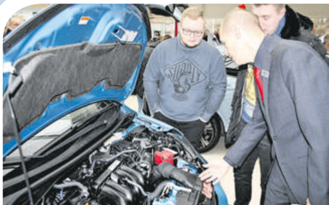
Da lohnte das nähere Hinsehen: der neue 1,5-Liter-i-VTEC-Benzinmotor im Jazz leistet 130 PS.

Connect, eine Rückfahrkamera, ein schlüsselloses Zugangs- und Startsystem sowie Sicherheitstechnologien wie Kollisionswarnsystem, Verkehrszeichenerkennung und Spurhalteassistent.