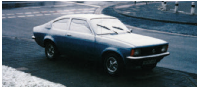
Kaltstart: Jetzt bloß nicht den Motor zu hoch drehen!

toren nicht eignen. Denn Kugel- bzw. Wälzlager haben riesige Nachteile: sie besitzen nur eine begrenzte Lebensdauer und mögen keine hohen Kräfte und stoßartigen Belastungen. Und genau diese Sensibilität ist ein KO-Kriterium in der Motorentechnik. Denn hier herrschen echt hohe Kräfte und harte Stöße. Immer und immer wieder! Ach ja – und auch hohe Drehzahlen kann man nur mit Gleitlagern realisieren. So dreht sich die Welle eines Turboladers mit bis zu 200.000 Umdrehungen pro Minute. Und, dass es auf Dauer nicht gut gehen kann, wenn sich da nicht genügend dünnflüssiges Öl an den richtigen Stellen herumtreibt, kann sich jeder denken. Dann wird es irgendwann teuer... Aber wem das alles egal ist, der kann ja auch im tiefsten Winter gerne die ersten Meter schon eiskalt Vollgas geben.