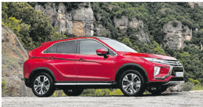
Optisch verbindet der Eclipse Cross die scharf geschnittene Linienführung eines Coupés mit dem robust-dynamischen Auftritt eines SUV.