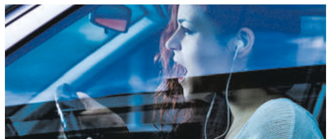
Beim Autofahren darf auch das Gehör nicht beeinträchtigt werden, etwa durch laute Musik.

Hier kann die Versicherung die Leistung kürzen. Vorausgesetzt allerdings, es liegt grobe Fahrlässigkeit vor. Janeczek: „Das sind Extremfälle, in der Regel zahlt die Kaskoversicherung.“