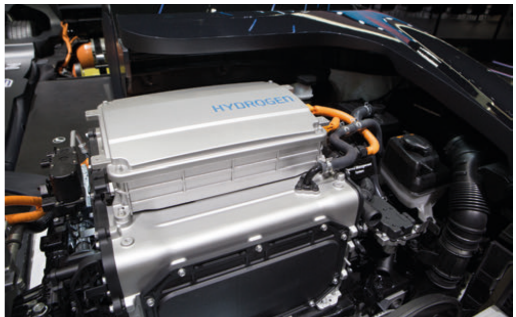
Motor der Zukunft? Brennstoffzellentechnik im Hyundai Nexu.

langen, um sich dort mit den Protonen und den Sauerstoffatomen der Luft endlich wieder zu H 2 O zu verbinden. Und durch genau diesen Elektronenfluss wird der Motor angetrieben. Als Abfallprodukt entsteht also lediglich Wasser. Klingt fast zu schön, um real zu sein. Tatsächlich ist das aber schon möglich und wird auch gemacht. Zumindest die ersten Brennstoffzellen-Autos fahren schon herum. Es wird aber erfahrungsgemäß noch eine Weile dauern, bis alle Hersteller mitmachen, die Randbedingungen geschaffen und die Neuwagenpreise etwas gesunken sind. Aber ich bin mir sicher: so sieht die Zukunft aus!