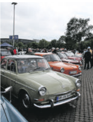
Auch immer gerne dabei: VW Typ 3 und 4...