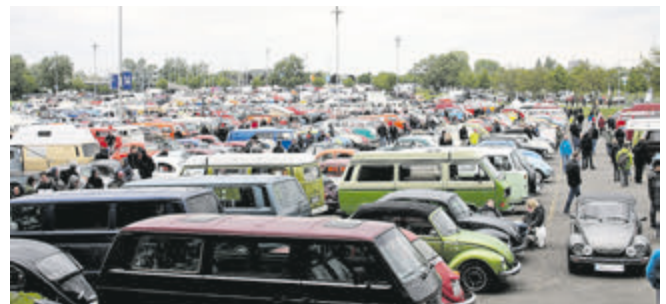
Volkswagen bis zum Horizont: zum 35. MaiKäferTreffen kamen wieder tausende Käfer und diverse Derivate.