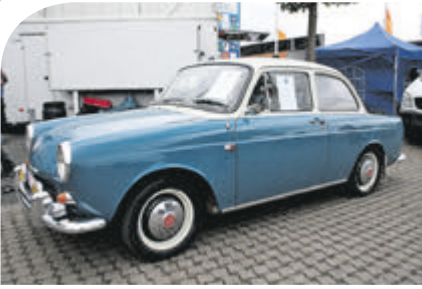
VW 1500 Typ 3 von 1964 – seltener „Kurz-schnauzer“.