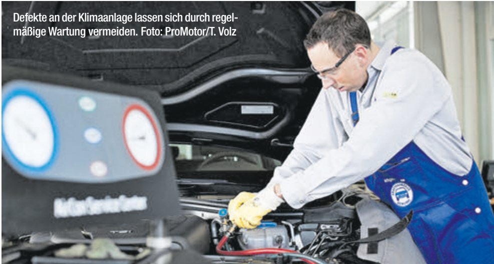
Defekte an der Klimaanlage lassen sich durch regelmäßige Wartung vermeiden.

Nach den ersten warmen Tagen stehen viele Autos in der Werkstatt. Diagnose: Klimaanlage defekt. Ein Schaden, der mit regelmäßiger Wartung zu vermeiden gewesen wäre.