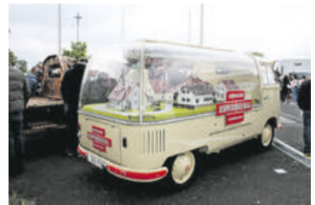
Pittoresk – nicht nur für Bausparer.