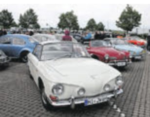
...sowie Besuch aus Osnabrück.