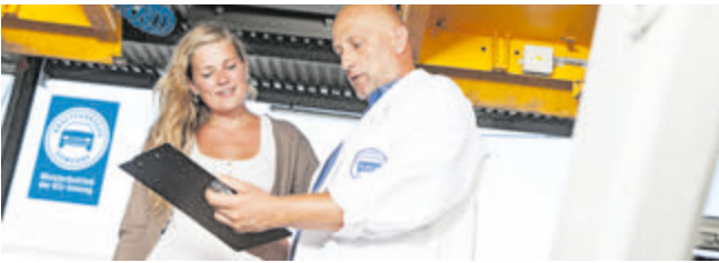
Beim Urlaubscheck wird das Fahrzeug für die Reise fit gemacht.