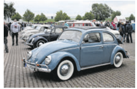
Käfer aus allen Baujahren, mit und ohne zeitgenössischem Zubehör.