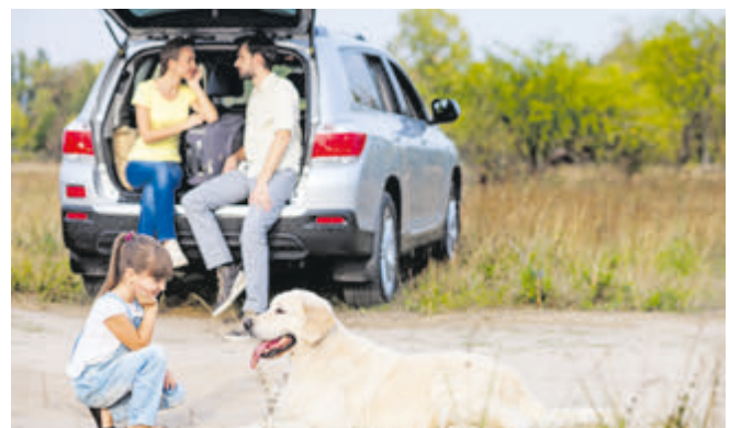
Wenn Hunde mit auf die Urlaubsreise gehen, müssen sie gut gesichert sein.

Am Bord gehören die Reiseapotheke, Wasser, Fertigfutter, Schlafdecke, Spielzeug, Näpfe, Kamm oder Bürste und die Unterlagen der Haftpflichtversicherung. Für den Fall des AusbüchSENS hilft ein Namensschild mit Heimat- und Urlaubsadresse an Halsband und Hundeleine.