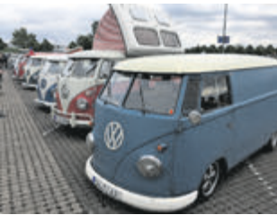
Inzwischen eine echte Wertanlage: die beliebten Bulli T1.