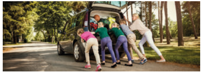
Vor der Urlaubsfahrt sollte das Auto gründlich von einer Fachwerkstatt gecheckt werden - damit so etwas nicht passiert...

In den Ferien kann einiges schiefgehen: Oma bricht sich das Bein, Sohnemann verliert sein Daddel-Spielzeug, Papa verirrt sich in der Pampa.