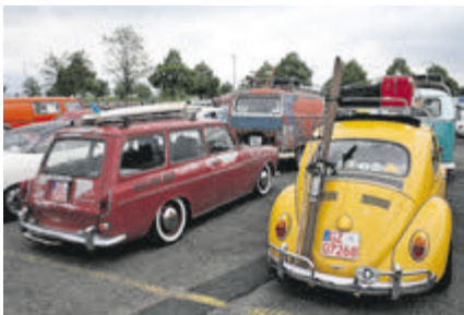
Was darf's sein: Zum Strand oder in den Schnee? Einladend!