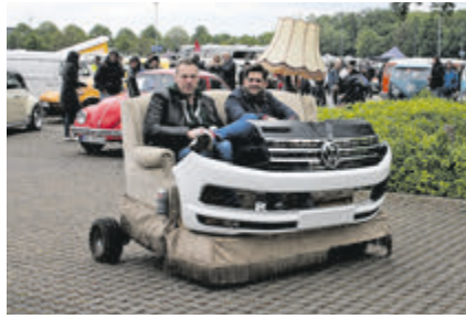
Skurrit: mit dem Sofa unterwegs (inklusive Stehlampe!)