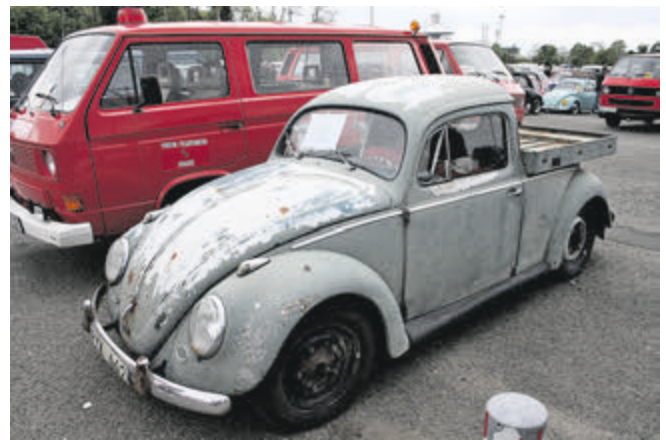
Marke Eigenbau: Käfer mit Pritsche, seit Anfang der 60er-Jahre im Dienst als leichter Abschleppwagen und Reparaturfahrzeug.