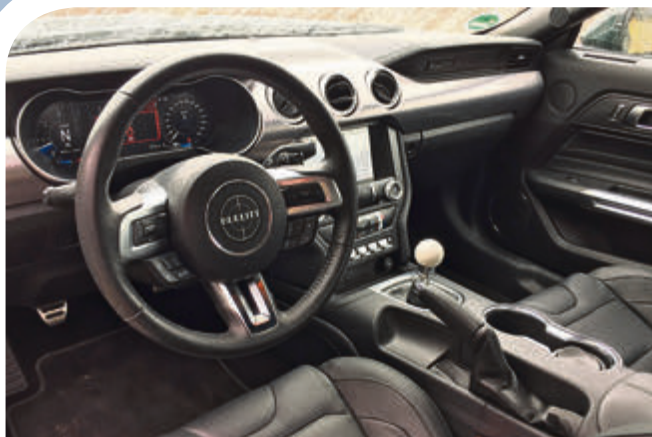
Innenraum mit Digital-Cockpit, Recaro-Sportsitzen, Sync 3 Kommunikations-System, Chrom-Kippschaltern – und diesem coolen weißen Schaltknauf.