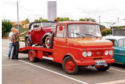
Hinreißender Hingucker: Opel Blitz Transporter mit wertvoller Fracht.