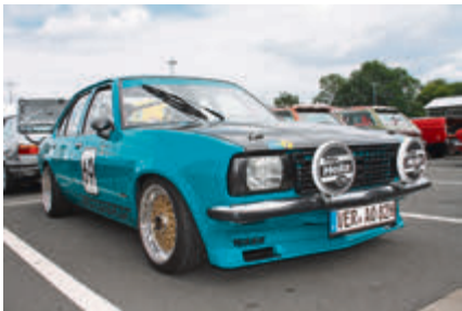
„Ready for Racing“.