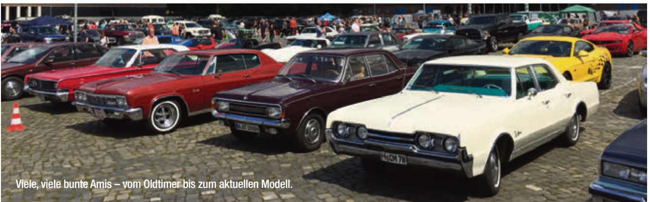
Viele, viele bunte Amis – vom Oldtimer bis zum aktuellen Modell.