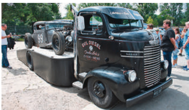
„Evil Diesel“: Extrem tiefer Transporter mit extrem tiefem Hot-Rod.