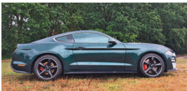
Das Fastback steht einem Mustang auch heute noch ausgesprochen gut.

Der Blick schweift übers Cockpit: Alles ganz schick hier, die Qualitätsanmutung passt und die verchromten Kippschalter sind ein Hingucker. Mit einem von denen kann man die unterschiedlichen Fahrmodi auswählen, von Normal über Sport+,