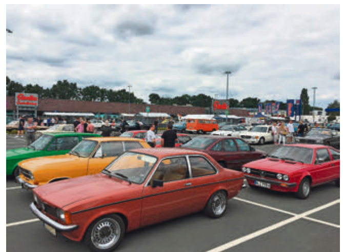
Old- und Youngtimer, statt moderner Kombis und SUV: Ein Supermarkt-Parkplatz voller schicker Schätzchen.