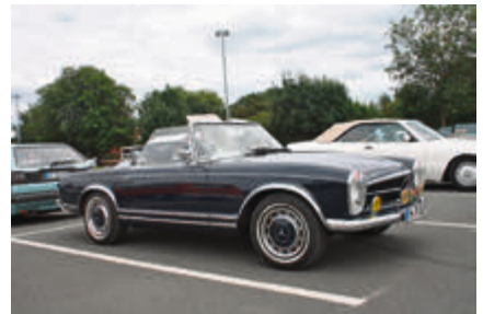
Offen, trotz grauer Wolken: Mercedes SL „Pagode“.