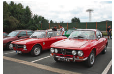
Zweimal Alfa Romeo Bertone GT, einmal als 1750 und einmal als 1300.