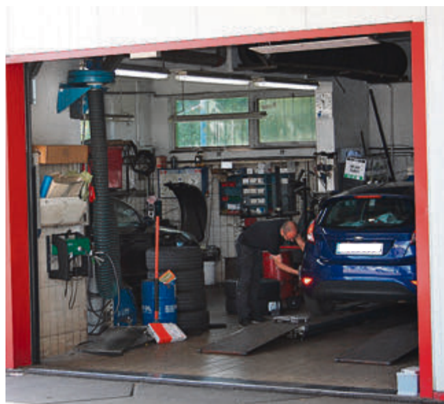
In der hauseigenen Meisterwerkstatt werden unter anderem umfassende Scheibenreparaturen, Autogas-Einbau, Haupt- und Abgasuntersuchungen sowie der Klimaanlage-Service durchgeführt.