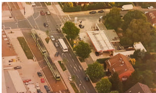
Luftaufnahme: So sah der Betrieb in den 90er Jahren aus.