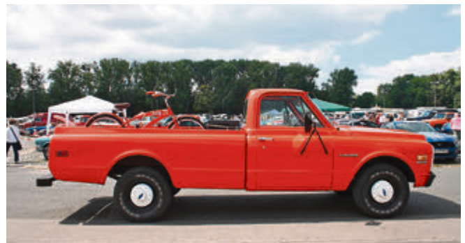
Chevi Pickup mit passendem Bike.