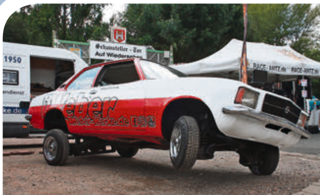
Immer beliebt: die „hüpfenden“ Low-Rider.