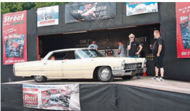
Der Besitzer dieses 67er Cadillac Sedan DeVille zeigt seinen Wagen auf der Präsentationsbühne und liebt dessen tief blubbernden Klang.