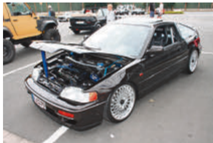
Heißer Honda CRX.