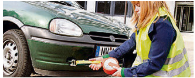
Beim Abschleppen defekter Fahrzeuge sind einige Regeln zu beachten.

Bei beiden Fahrzeugen muss die Warnblinkanlage eingeschaltet sein. Sollte die Elektronik beim Pannfahrzeug kom-