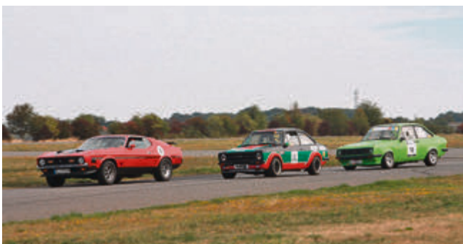
Bei den beliebten Oldtimer-Vergleichsläufen starten rund 250 Rennfahrer in 11 Wertungsklassen – und garantieren jede Menge Rennaction.