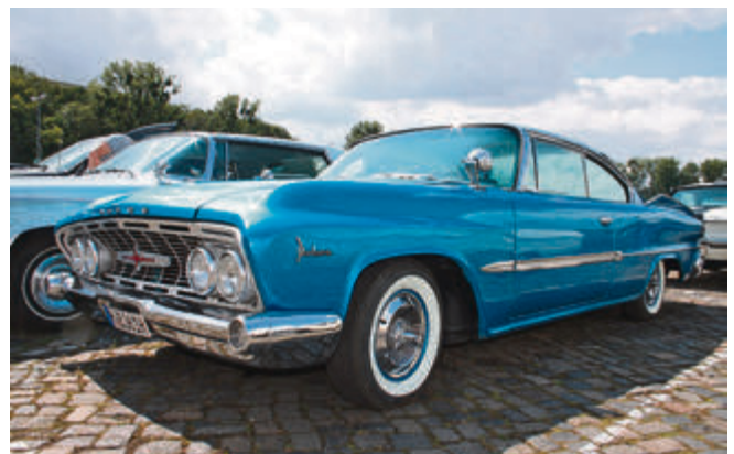
Eigenwillige, fließende Formen: Dodge Polara.