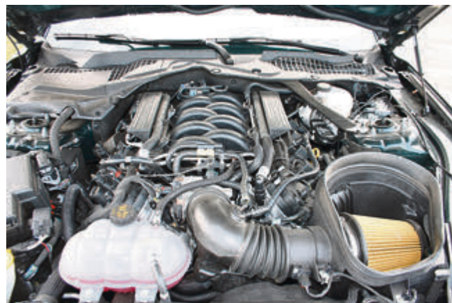
Kraftwerk: Dank Ansaugtrakt und Motorsteuerung des Shelby GT 500 leistet der V8 im Bullitt 460 PS.

Schnee/Nässe und Rennstrecke bis zum Drag Strip Modus!