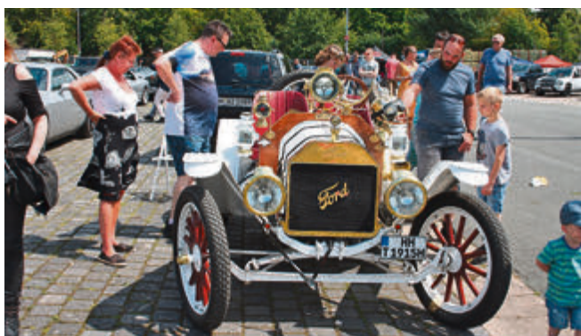
Das älteste Auto auf dem Platz.