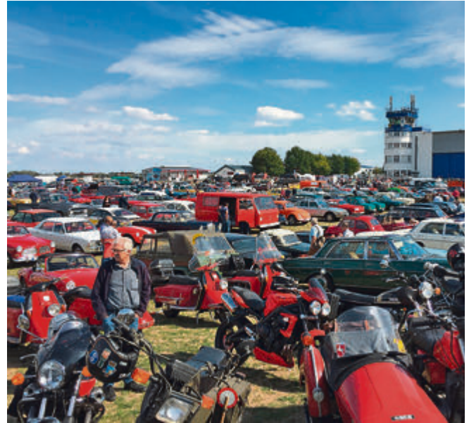
Die Technorama lockt immer wieder hunderte von Oldtimern auf das Gelände am Hildesheimer Flughafen.

Der Besucherparkplatz befindet sich direkt auf dem Flugplatz. Die Tageskarte kostet 12 Euro. Weitere Informationen unter www.technorama.de sowie auf Facebook und Instagram.