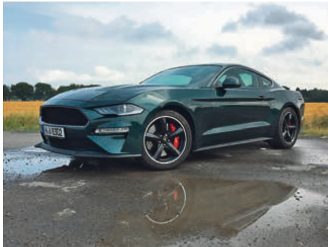
Auch das schicke Montana-Grün Metallic ist eine Reminiszenz an den Film-Mustang.

Und das Autohaus Rodewald in Langenhagen hat mir einen dieser in der Stückzahl limitierten Wagen zum Testen zur Verfügung gestellt. Schon beim Drücken des Startknopfes weiß ich, dass das gut werden wird. Das dumpfe, warme, latent angriffs-