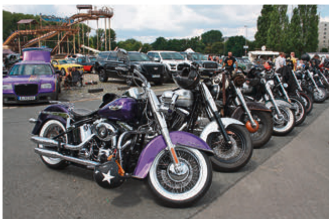
Auch die Harley-Fans kamen wieder auf ihre Kosten.