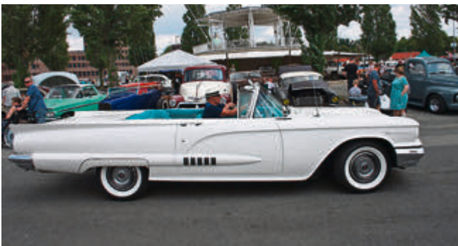
Sehen und gesehen werden beim beliebten Cruisen über'n Platz.