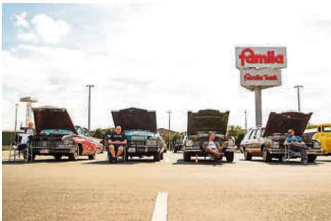
Relax: Ami-Fans und ihre Autos.