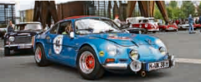
1973er Renault Alpine aus Hemmingen.