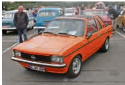
Seltener Kadett C Aero.