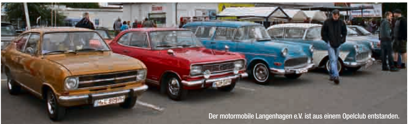
Der motormobile Langenhagen e.V. ist aus einem Opelclub entstanden.