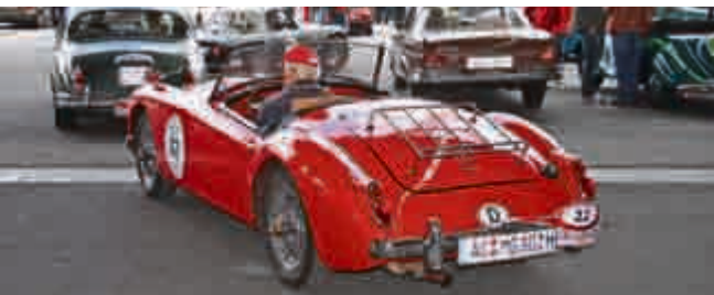
Der MGA konnte die letzte Etappe wegen eines Kupplungsschadens nicht mehr mitfahren.