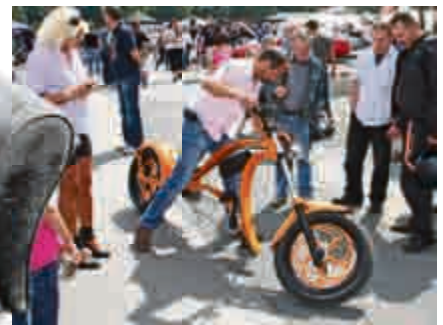
„Da fehlt doch der Motor!“ – Nein, das ist nur ein extrem cooles Fahrrad.