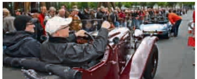
Vorkriegs-Aston Martin und Jaguar E-Type warten auf den Start und die erste Wertungsprüfung.