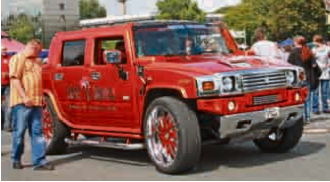
Deutschlands Lieblingsbordellbetreiber Bert Wollersheim gab sich die Ehre in einem fetten Hummer.