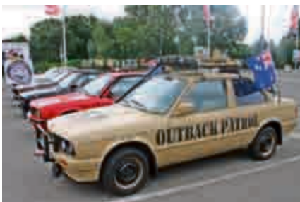
Die BMW E30-Freunde warben für ihr Treffen in Sarstedt Mitte September.