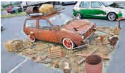
Die beste „Ratte“ des Platzes, ein VW Polo 86c, mit einer charmanten Präsentation.