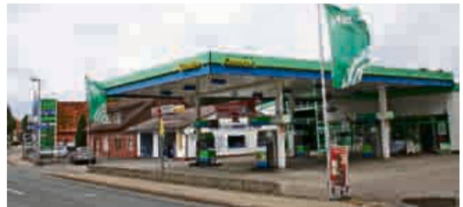
Damals und heute: Das Autohaus Giesche mit Tankstelle, Werkstatt und Abschleppdienst im Wandel der Zeit.