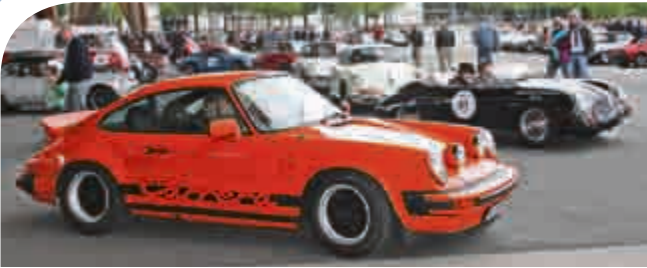
Porsche-Fans kamen auf ihre Kosten.