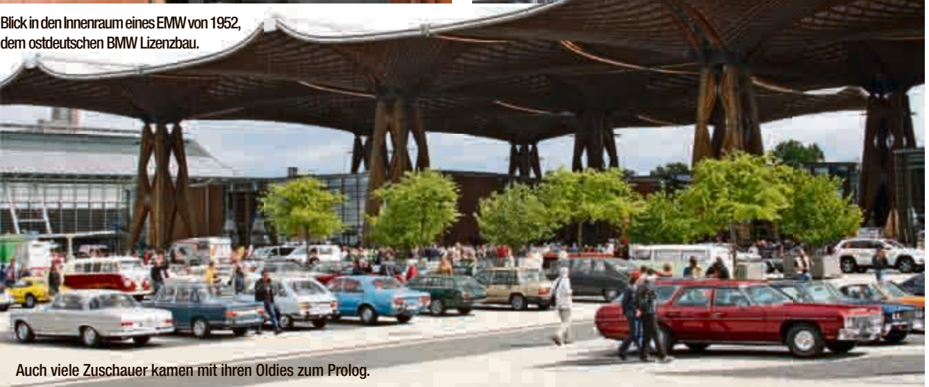
Auch viele Zuschauer kamen mit ihren Oldies zum Prolog.