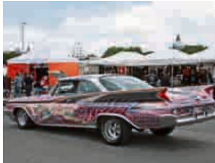
Alles andere als unauffällig: majestätische Heckflossen und buntes Styling.