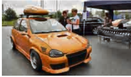
Von Kopf bis Fuß in Gold, ein Opel Corsa bei der Einfahrt auf das Gelände.