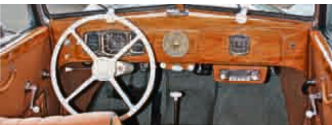
Blick in den Innenraum eines EMW von 1952, dem ostdeutschen BMW Lizenzbau.