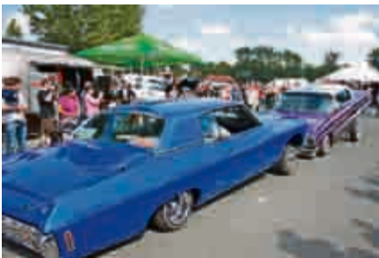
Lowrider-Battle: zwei „Hydraulik-Hopper“ begegneten sich beim Cruisen.