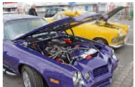
Da lohnt ein Blick unter die Haube.