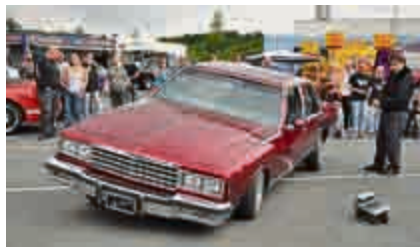
Lowrider Battle: Ami V8 vs. RC Car