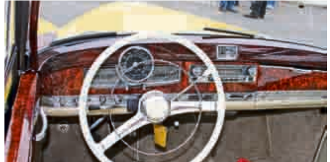
Jede Menge Holz und Chrom: das wunderschöne Interieur eines Mercedes 300S.

gebaute Reihen-Vierzylinder mit seitlicher Nockenwelle, Solex Fallstromvergaser und einer Leistung von 52 PS. Mit dem Typ 170 S präsentierte Daimler-Benz, erstmals nach dem Krieg, wieder einen Wagen der Sonderklasse, vorgestellt übrigens auf der 1949 ausgerichteten Exportmesse in Hannover. Mit Preisen von 15.800 DM galt das Cabriolet A seinerzeit als besonders luxuriöses Fahrzeug für höchste Ansprüche und rundete das