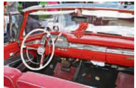
Das stilvolle Cockpit eines Ford Galaxie.