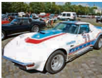
Darf auf keinem US-Car-Treffen fehlen: die klassische Corvette.