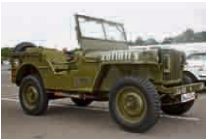
Feiert in diesem Jahr seinen 70. Geburtstag: Willys Overland Jeep.