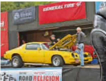
Präsentation auf der Bühne mit Kult-Moderator Otto Meyer-Spelbrink.