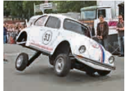
„Jump around“: Extremer Low-Rider auf Käfer-Basis – Hüpfen bis zum (gewollten) Umkippen.