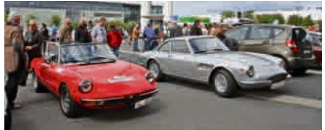
Für die italienischen Momente: Alfa Spider und ein rarer Ferrari 330 GTC.