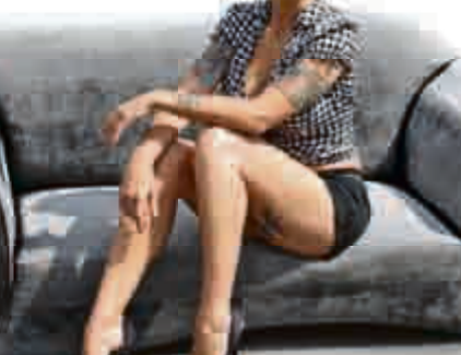
Sexy Hingucker: Girl im klassischen Pin-up-Style.