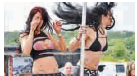
Gogo-Girls heizten die Jungs richtig an.