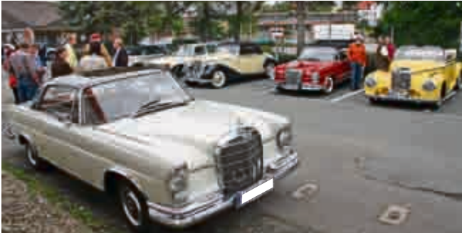
Fachsimpeln, Fahren, Fisch essen – die Mitglieder des MB Stammtisches Hannover-Hildesheim mit ihren Autos vor der Tour.

Bevor es zur alljährlichen „Fisch-Essen-Fahrt“ ging, trafen sich die Mitglieder des Mercedes Stammtisch Hannover-Hildesheim Anfang Juli auf dem Gelände der Firma XXL-elektro Maschke in Hildesheim. Zeit genug, um sich die Schätze in Ruhe anzuschauen und einen Blick unter die ein oder andere Haube zu erhaschen. Zum Beispiel bei einem Mercedes 170 S Cabriolet A: Gut zu erkennen war der stehend längs ein-