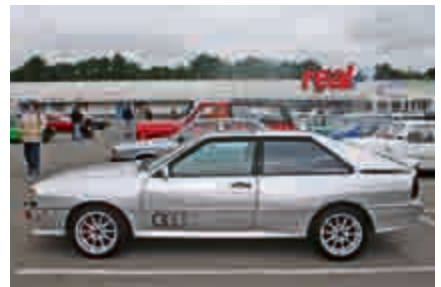
Auf allen Vieren: Audi Quattro.