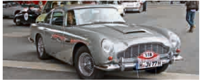
Bond's Dienstwagen: Aston Martin DB 5.