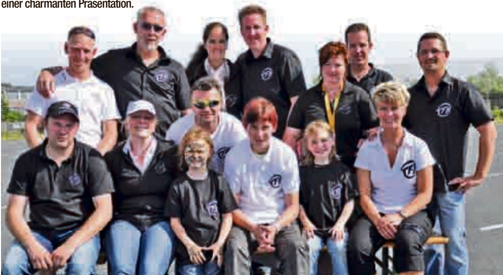
Die Tuningfreunde Hannover freuen sich über den Erfolg ihres ersten eigenen Treffens.

Mehr Bilder und Infos zu diesem Bericht gibt es bei Facebook. Dort einfach nach Verlag Team Schroedel suchen und nicht vergessen den „gefällt-mir-Button“ zu drücken.