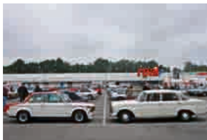
BMW 2002 Turbo vs. Mercedes 300 Automatic.