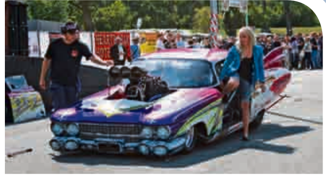
Höllmaschine: der 3000-PS-Dragster vom Vater/Tochter-Team war brutal, laut, geil – und das nur im Stand.