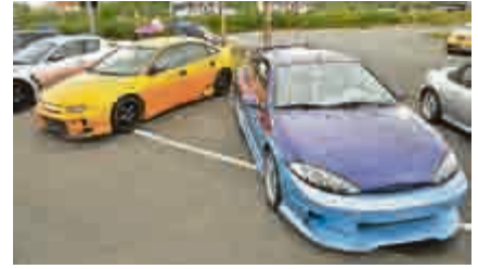
Zwei exotische Fabrikate in der Tuningszene