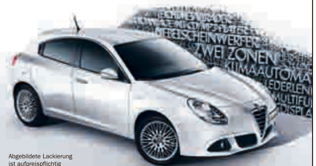
Abgebildete Lackierung ist aufpreispflichtig