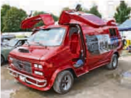
Der hätte auch dem A-Team gefallen: Van mit Flügeltüren.

Hier einige Impressionen von der Veranstaltung: