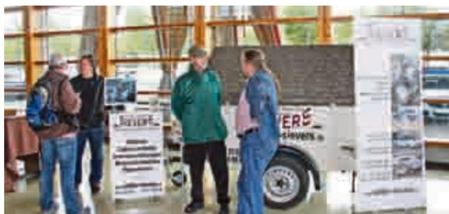
Einige Aussteller zeigten ihr Know-How.