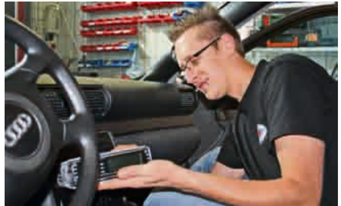
Vom Kauf bis zum professionellen Einbau bietet HFB audio alles aus einer Hand.

auf den Ausstellungsraum von HFB audio zu. Hier bietet Schlüter alles, was der Car-Hifi-Fan begehrt: vom klassischen Autoradio, schon mit USB-Anschluss usw., über größere Geräte mit Freisprecheinrichtung, ausfahrbaren Touchscreen-Monitoren und Navi bis hin zu Doppeldin-Geräten mit HD-Display und 3D-Navi. Natürlich sind sämtliche namhaften Hersteller im Angebot: JVC, Clarion, Alpine, Sony, Pioneer, Kenwood und – exklusiv in der Region – Zenec. Von denen führt HFB audio auch sogenannte Naviceiver, komplexe Naviga-