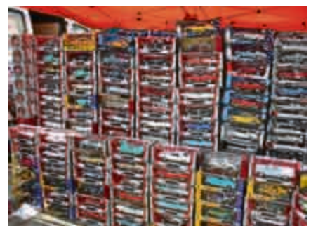
Wenn Geld und Platz nicht für einen „Echten“ reicht: große Auswahl an Modellautos.