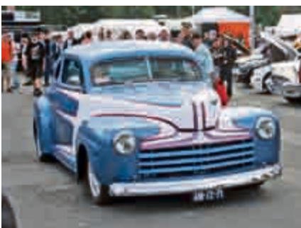
Beliebt bei Teilnehmern und Besuchern: das Criusen über den Schützenplatz.