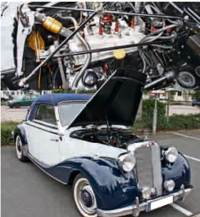
Ein Blick unter die Haube eines Mercedes 170 S Cabriolet A.

BOYA LACK • KAROSSERIE • REPARATUR • CENTRUM