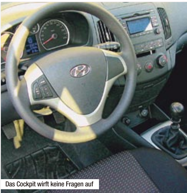
Das Cockpit wirft keine Fragen auf