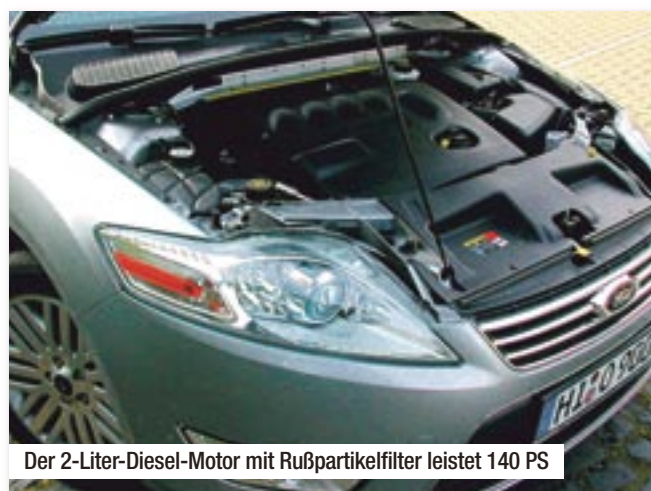
Der 2-Liter-Diesel-Motor mit Rußpartikelfilter leistet 140 PS