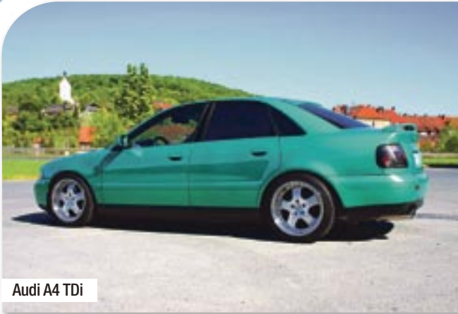
Audi A4 TDi