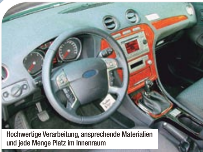
Hochwertige Verarbeitung, ansprechende Materialien und jede Menge Platz im Innenraum