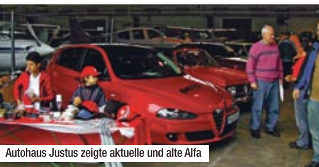
Autohaus Justus zeigte aktuelle und alte Alfa

oder andere Kleinod noch den Besitzer wechseln. Auch das Autohaus Justus aus Hildesheim/Himmelstür war als Aussteller vor Ort und zeigte alte Alfa Romeo und deren jüngste Geschwister.