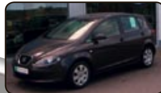
Seat Altea 1.9 TDI Reference EZ 02/06, 90.400 km, 77 kW, Klima, Airbags, ABS, ESP, ZV, el. FH, Aussentemp.-Anz., Reifendruckkontrolle uvm.