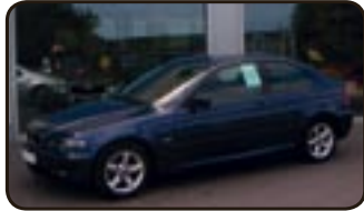
BMW 316 ti Compact EZ 09/04, 32.500 km, 85 kW, Klima, Glasdach, Einparkhilfe, CD-Wechsler, Sitzhg., Tempom., Alu, Airbags uvm.