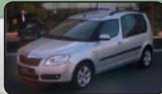
Skoda Roomster 1.4 TDI DPF Comf. EZ 06/07, 20 km, 59 kW, Klima, Ra- dio/CD/MP3, Sitzhg., Tempom., Alu, Airbags, BC, ESP, MAL, Nebel uvm.

fi $ Z# ! $ " # fi # 1 2 3 4 5 6 7 8 9 10 11 12