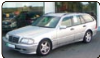
Mercedes-Benz C200 Sport 98 EZ 01/98, 90.200 km, 100 kW, Klima, ABS, Servo, ZV, el. FH, ASR, el. Spiegel, Airbags, Aussentemp.-Anzeige uvm.