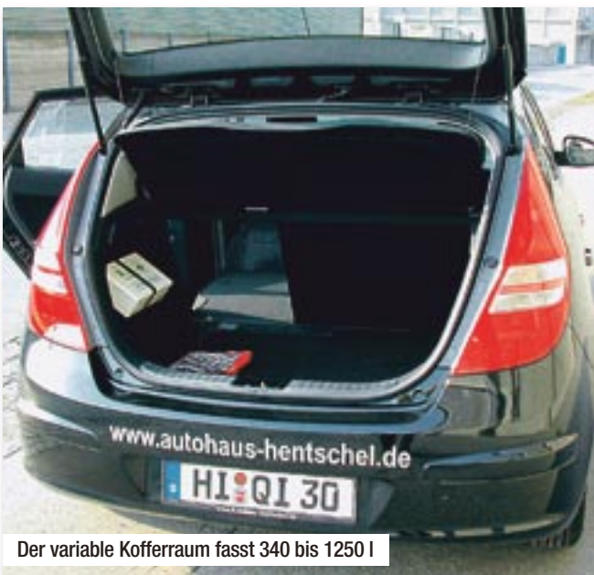
Der variable Kofferraum fasst 340 bis 1250 l