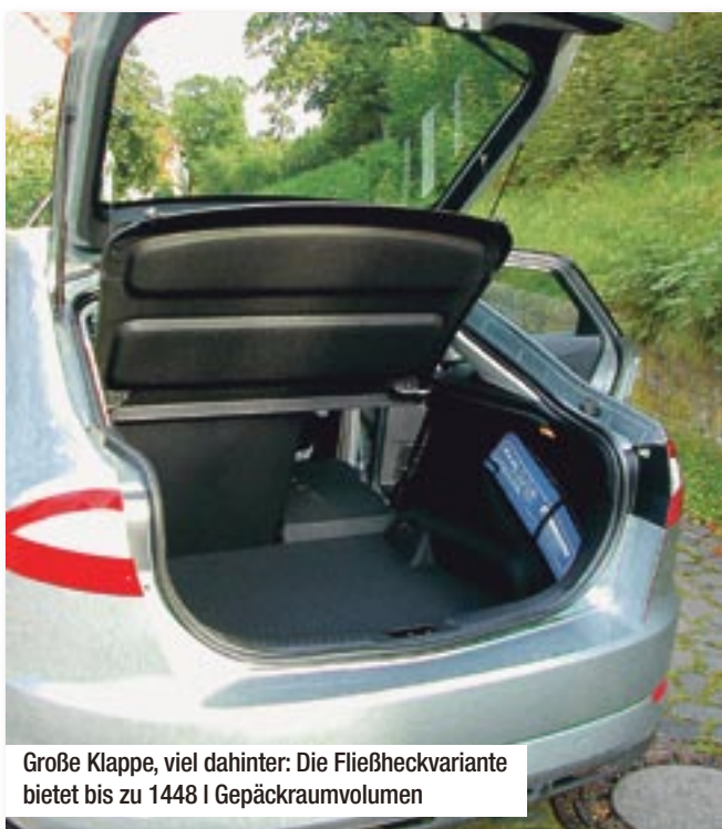
Große Klappe, viel dahinter: Die Fließheckvariante bietet bis zu 1448 l Gepäckraumvolumen