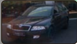
Skoda Octavia II Combi 1.6 Amb. EZ 08/07, 50 km, 75 kW, Klima, Einparkhilfe, Tempom., Airbags, Servo, ZV, el. FH, BC, MAL, Nebel uvm.