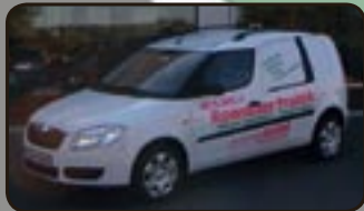
Skoda Praktik 1.4 16V EZ 07/07, 1.000 km, 63 kW, Klima, Radio beta, Airbags, ABS, ESP, Servo, ZV mit FB, ASR uvm.