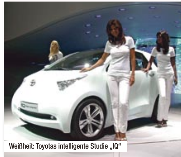
Weißheit: Toyotas intelligente Studie „IQ“

Opels Kleinster, der Agila, präsentiert sich völlig neu: mit 4 Türen und erstaunlich viel Platz im hübschen Innenraum hat die 2. Generation des Microvan (übrigens erneut als Kooperation mit Suzuki entstanden, deren Variante heißt Splash) wieder das Zeug zum Bestseller.