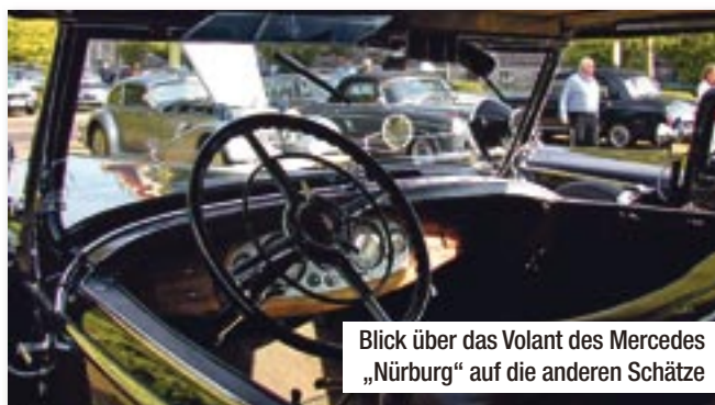
Blick über das Volant des Mercedes „Nürburg“ auf die anderen Schätze