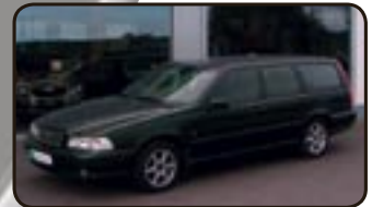
Volvo V70 2.5 TDI Black Edition EZ 03/00, 126.000 km, 103 kW, Auto- matik, Klima, AHK, Airbags, ABS, ESP, Servo, el. FH, el. Spiegel, Nebel uvm.