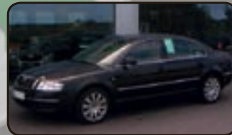
Skoda Superb 2.8 V6 Eleg. Tiptronic EZ 06/05, 22.200 km, 142 kW, Klimaauto- m., Navi, Leder, Xenon, Einpark- hilfe, CD-Wechsler, Tempom. uvm.

fi $ Z# ! $ " # fi # 1 2 3 4 5 6 7 8 9 10 11 12