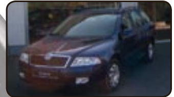
Skoda Octavia II Combi 1.6 Amb. EZ 08/07, 50 km, 75 kW, Klima, Einparkhilfe, Radio, Tempom., Airbags, ABS, ESP, el. FH, BC, el. Spiegel uvm.