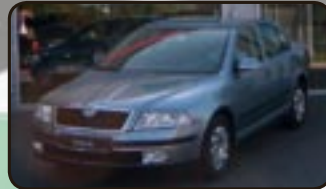
Skoda Octavia II 2.0 FSI Ambiente EZ 11/06, 20 km, 110 kW, Klimaauto- m., Einparkhilfe, Radio, Airbags, ABS, ESP, ZV, el. FH, ASR, 6-Gang uvm.