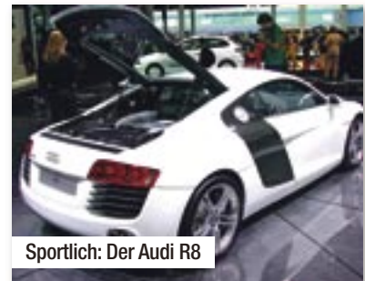
Sportlich: Der Audi R8

Als zur Präsentation des neuen Audi A4 auch noch Bryan Adams live für die hunderten von Zuschauern in Halle 3 singt, ist klar: Audi hängt die Messlatte in der Mittelklasse höher. Mit 4,70 Meter Länge steht der neue A4 stattlich und kraftvoll da, die 5 Motoren (1.8 und 3.2 TFSI sowie 2.0, 2.7 und 3.0 TDI), die zum Start im November zur Verfügung stehen, reichen von 143 bis 265 PS. Diesel wie auch Benziner arbeiten mit Turboaufladung und Direkteinspritzung und sollen deutlich weniger verbrauchen als ihre jeweiligen Vorgänger. Die Preise beginnen bei 26.000 Euro.