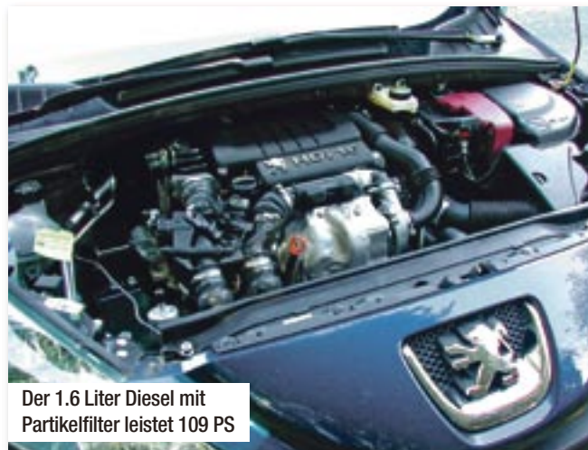
Der 1.6 Liter Diesel mit Partikelfilter leistet 109 PS

derrädern, lässt den frischen Franzosen im Stadtverkehr flink mitschwimmen. Die Ampel springt um auf Gelb, runterschalten, Gas durchtreten, 240 Nm Drehmoment erledigen den Zwischensprint, gerade noch so geschafft. Ab auf die Landstraße, Roter Berg zwischen Dieckholzen und Sibbesse. Gutmütig durchheilt der 308 das Kurvengeflecht, nähert er sich dem physikalischen Grenzwert, greift das ESP unauffällig aber effektiv ein.