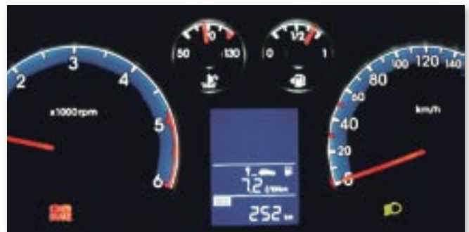
Hübsch anzusehen: Die blau illuminierten Instrumente