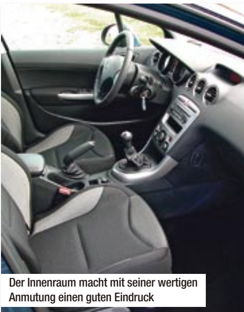
Der Innenraum macht mit seiner wertigen Anmutung einen guten Eindruck

Hat man die passende Position hinterm optionalen Lederlenkrad gefunden, darf der 1,6 Liter HDi Diesel mit 109 PS zeigen, was in ihm steckt. Etwas brummig aber kräftig zieht er an den Vor-