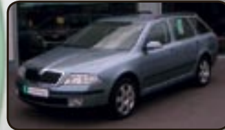
Skoda Octavia II Combi 2.0 TDI DPF EZ 09/06, 24.630 km, 103 kW, DSG, Klimaautom., Navi, CD-Wechsler, Tempom., Sitzhg., Alu, Airbags uvm.