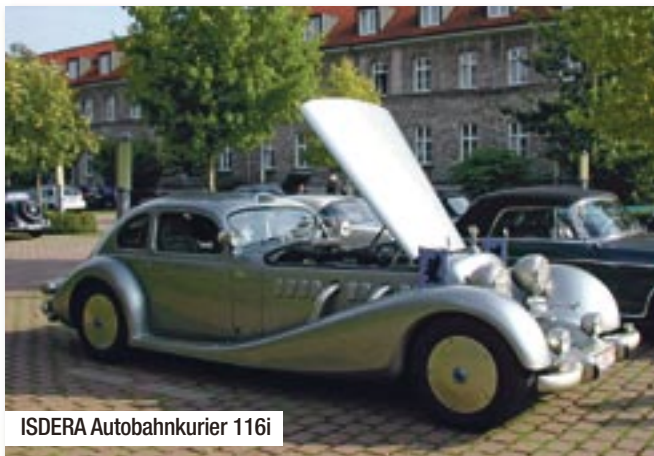
ISDERA Autobahnkurier 116i