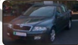
Skoda Octavia II 2.0 FSI Elegance EZ 09/06, 11.800 km, 110 kW, Klimaautom., Einparkhilfe, Radio/CD, Sitzhg., Tempom., Alu 16", ESP uvm.