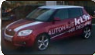
Skoda Fabia II 1.9 TDI DPF Elegance EZ 05/07, 6.000 km, 77 kW, Klimaauto- m., Radio/CD/MP3, Sitzhg., Tempom., Alu 17", Sportfahrwerk uvm.