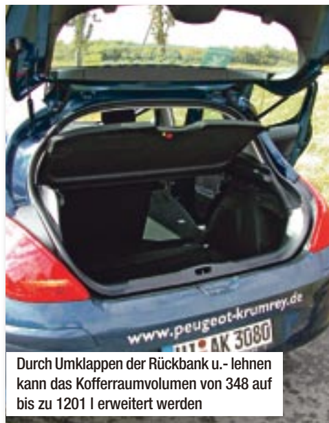
Durch Umklappen der Rückbank u.- lehnen kann das Kofferraumvolumen von 348 auf bis zu 1201 l erweitert werden