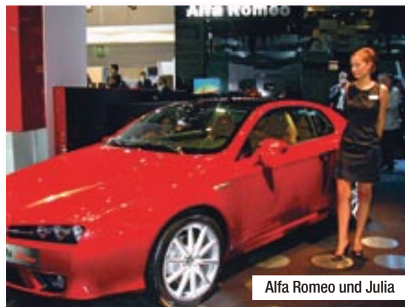
Alfa Romeo und Julia