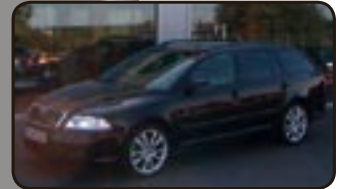
Skoda Octavia II Combi 2.0T FSI RS EZ 05/07, 5.000 km, 147 kW, Klimaauto- m., Tempomat, Alu 18", CD-Wechsler, Leder, Navi, Sitzhg. uvm.