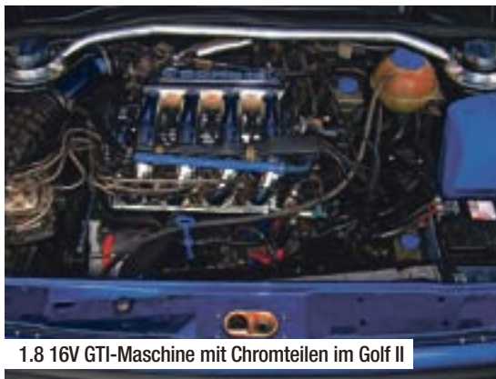
1.8 16V GTI-Maschine mit Chromteilen im Golf II

Audi von Mischbereifung (vorne 215/45er und hinten 235/40er auf 17 Zoll Alus) über die Mattig Scheinwerfer- und Heckscheibenblenden und den Frontgrill ohne die 4 Ringe, die schwarzen Scheiben ab B-Säule und die schwarzen Rückleuchten von „inpro“ bis hin zur Edelstahl-