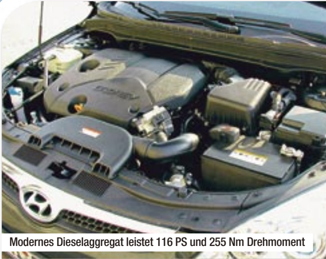
Modernes Dieselaggregat leistet 116 PS und 255 Nm Drehmoment