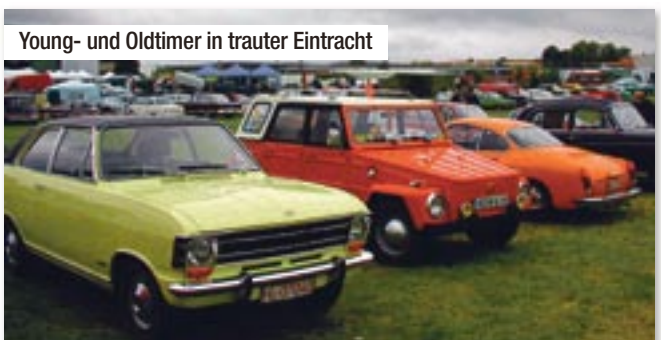
Young- und Oldtimer in trauter Eintracht