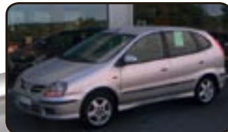
Nissan Almera Tino 2.2 Di Fresh EZ 06/03, 80.750 km, 84 kW, Klima, Leder, CD-Wechsler, Alu, ABS, Servo, el. FH, Nebel, Sitzhöhenverst. uvm.