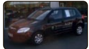
Skoda Fabia II 1.2 EZ 08/07, 1.000 km, 44 kW, Radio/ Cas., Airbags, ABS, Servo, Kopfst. hinten uvm.