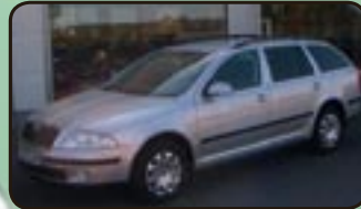
Skoda Octavia II Combi 1.6 Amb. EZ 08/07, 50 km, 75 kW, Klima, Einparkhilfe, Tempom., Airbags, ESP, Servo, el. FH, ASR uvm.