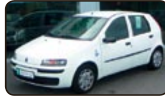
Fiat Punto 1.2 SX EZ 11/02, 88.000 km, 44 kW, Klima, Airbags, ABS, Servo, ZV, el. FH, Sitzhö- henverstellung uvm.