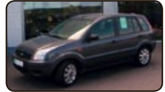
Ford Fusion 1.6 16V Trend EZ 12/02, 25.130 km, 74 kW, Klima, AHK, ABS, Servo, ZV, el. FH, el. Spiegel, Nebel, Sitzhöhenverstellung uvm.