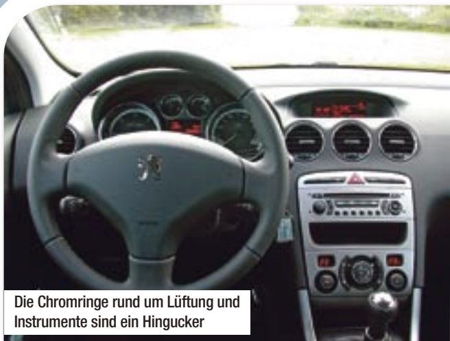
Die Chromringe rund um Lüftung und Instrumente sind ein Hingucker