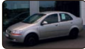
Daewoo Kalos 1.4 SX EZ 05/04, 23.000 km, 69 kW, Klima, Radio, Airbag, Servo, ZV, el. FH, Nebel, el. Spiegel uvm.