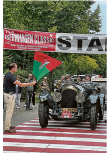
Startnummer 1 – ein Bentley 3 Liter Open Tourer – macht sich auf den Weg.