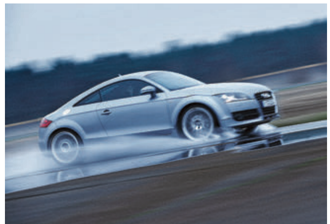
Besser nicht zu schnell fahren bei Aquaplaning-Gefahr.