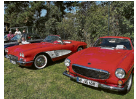
Corvette und Volvo P1800