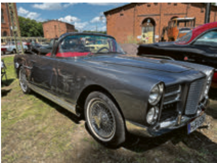
Schön und selten: Facel Vega.