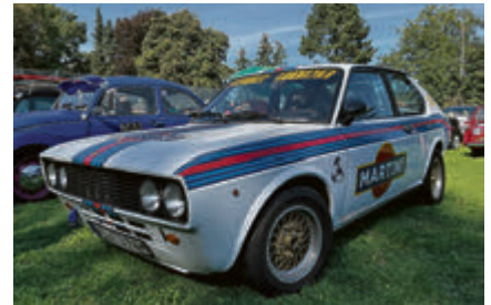
Fiat 128 Berlinetta