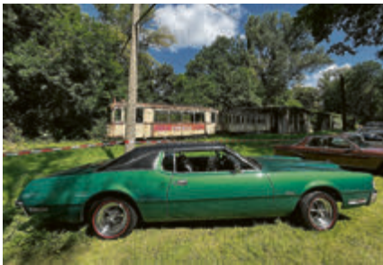
Hochglanz-Thunderbird vor Patina-Bahn.