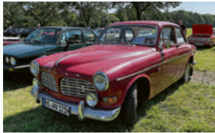
Volvo Amazon aus dem Jahr 1968.