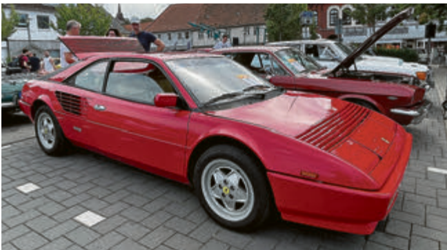
Ferrari Mondial, Baujahr 1987.