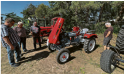
„Made in Österreich“: Lindner BF 22 N mit luftgekühltem 2-Zylinder und 22 PS aus dem Jahr 1961.