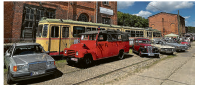
Betagte Autos, alte Straßenbahnen und historische Gebäude – der Oldtimertag im HSM bietet ein ganz besonderes Flair.