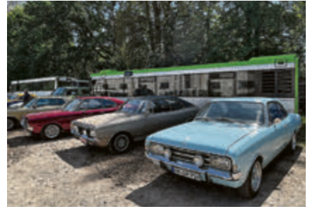
Opel-Gang vor Stadtbus.