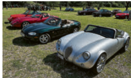
Viermal offen und doch ganz unterschiedlich: Porsche, TVR, Mazda und Wiesmann.