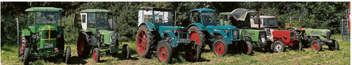
Alte Landtechnik ist auf den Treffen in Bockenem traditionell stark vertreten.