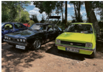
Ford Capri und Fiesta.