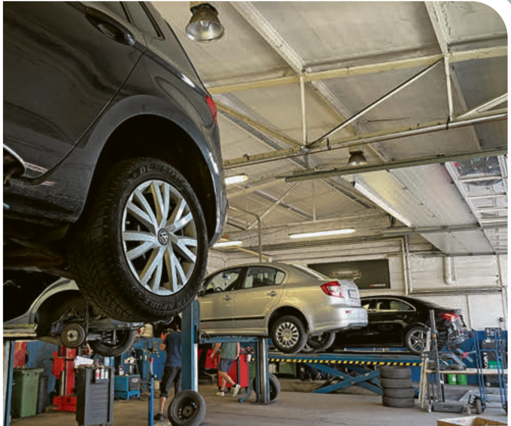
Auf 5 Bühnen werden sämtliche Arbeiten rund ums Kfz durchgeführt. Eine Bühne ist geeignet für Nutzfahrzeuge bis 5,5 Tonnen.

Und das wissen auch viele Stammkunden zu schätzen. „Wir konnte die ehemaligen Böker-Kunden schnell von unserer Kompetenz überzeugen und auch bereits viele Neukunden gewinnen – weil wir kundenorientiert denken und arbeiten.“ Spezialisiert ist man –