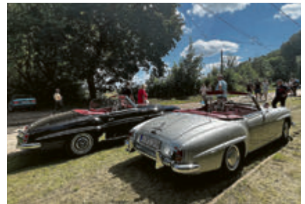
Zweimal Mercedes 190 SL.