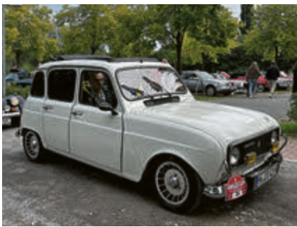
Sportlich: Renault R 4 in der Alpine-Ausführung.