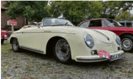
Porsche 356 Speedster.

hagen Hof eine stimmungsvolle Abendveranstaltung mit Musik und Buffet. Der Erlös der Veranstaltung kommt übrigens Kinder- und Jugendprojekten zugute – auch hier gibt es also Gewinner. Hier ein paar Impressionen: