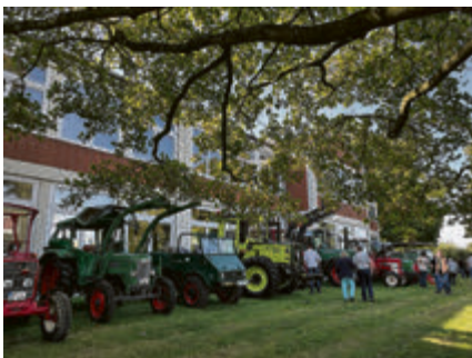
Eine abwechslungsreiche Auswahl an Landmaschinen war ebenfalls vor Ort.