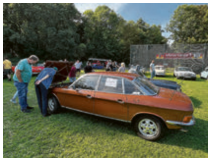
Da lohnt das Hinsehen: Wankeltechnik im NSU Ro80.