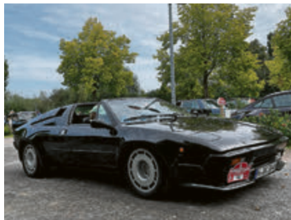
Ein rarer Lamborghini Jalpa P350, Baujahr 1983.