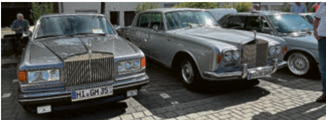
Rolls-Royce Silver Spur 3, Baujahr 1995 und Silver Shadow, Baujahr 1965.