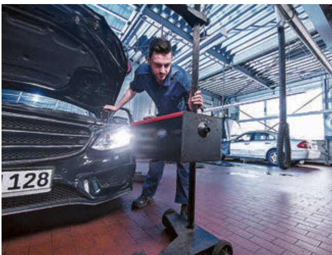
Beim Licht-Test werden neun Beleuchtungspunkte auf Sicht und Funktion sowie die Einstellung aller Lichtsysteme gecheckt.

Der diesjährige Auto-Partner VW sponsert den Licht-Test mit einem Fahrzeug. Teilnehmer des Gewinnspiels haben die Chance, zum 50. Fahrzeugjubiläum einen VW Golf 1,5 in Anemonenblau zu ergattern. Highlight des aufgefrischten Bestsellers Golf 8 mit 116 PS: ein Licht- und Sicht-Paket inklusive Light-Assist.