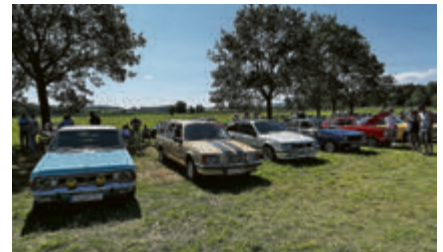
Opel-Modelle unterschiedlicher Typen und Jahrgänge.