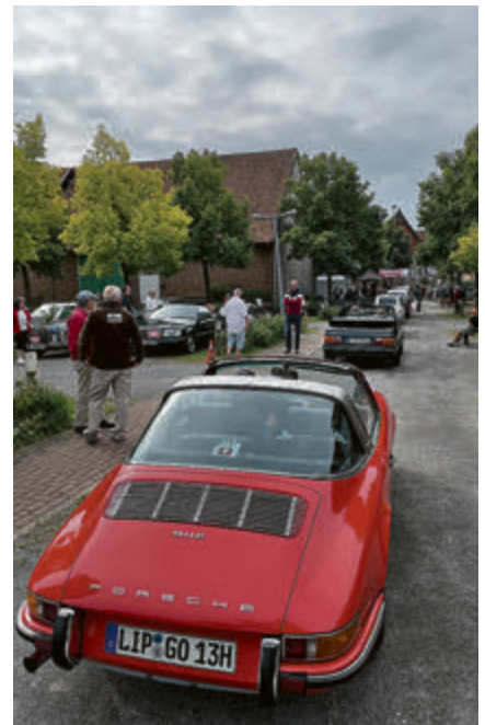
Anstehen zum Start. Ingo und Catalina Brötzmann haben mit ihrem Porsche 911 E Targa (im Vordergrund) am Ende den ersten Platz geholt.