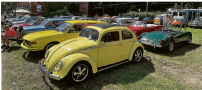
Bei bestem Wetter kamen hunderte Oldtimerfahrer mit ihren Schätzen nach Wehmingen.