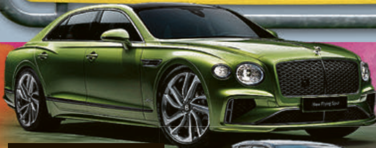
BENTLEY FLYING SPUR