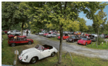
Vor dem Start und nach Zielankunft versammelten sich die teilnehmenden Fahrzeuge auf dem Parkplatz des Isernhagen Hofes.