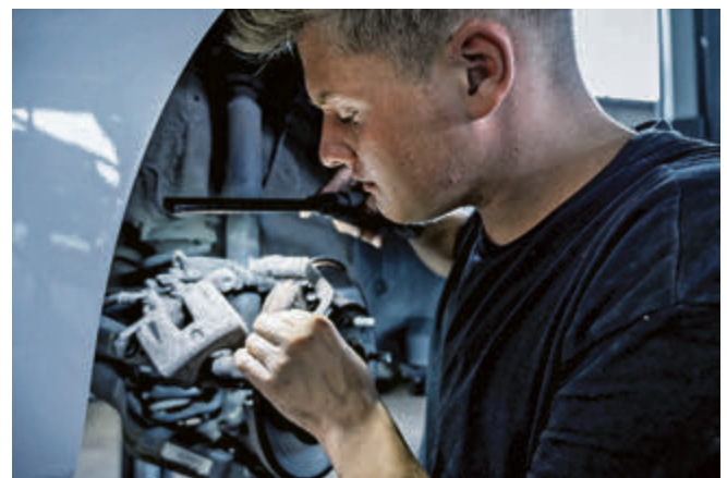
Bei einem Wintercheck des Fahrzeugs bietet es sich an, auch die Bremsanlage überprüfen zu lassen.