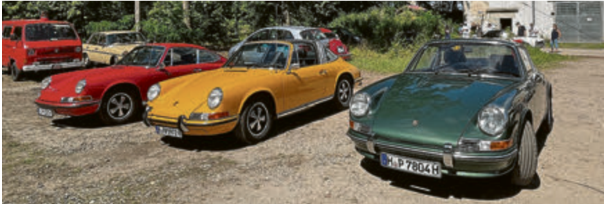
Farbenfroh: 3x Porsche 911 F-Modell.

So, den eigenen Oldtimer im hinteren Teil des Geländes abgestellt und jetzt auf zum Fotografieren. Einen Teil der Ausbeute gibt's hier: