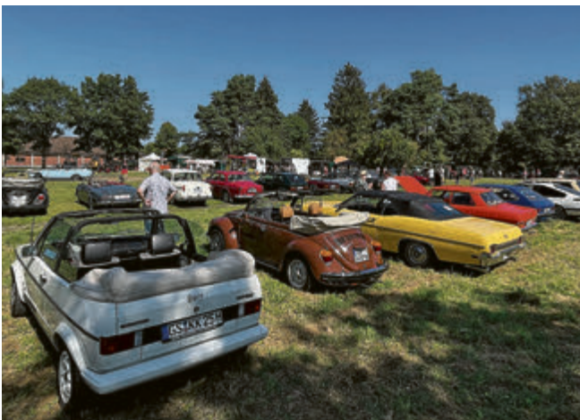
Von „Erdbeerkörbchen“ bis Ami: Das Oldtimertreffen in Bockenem bot jede Menge Abwechslung.