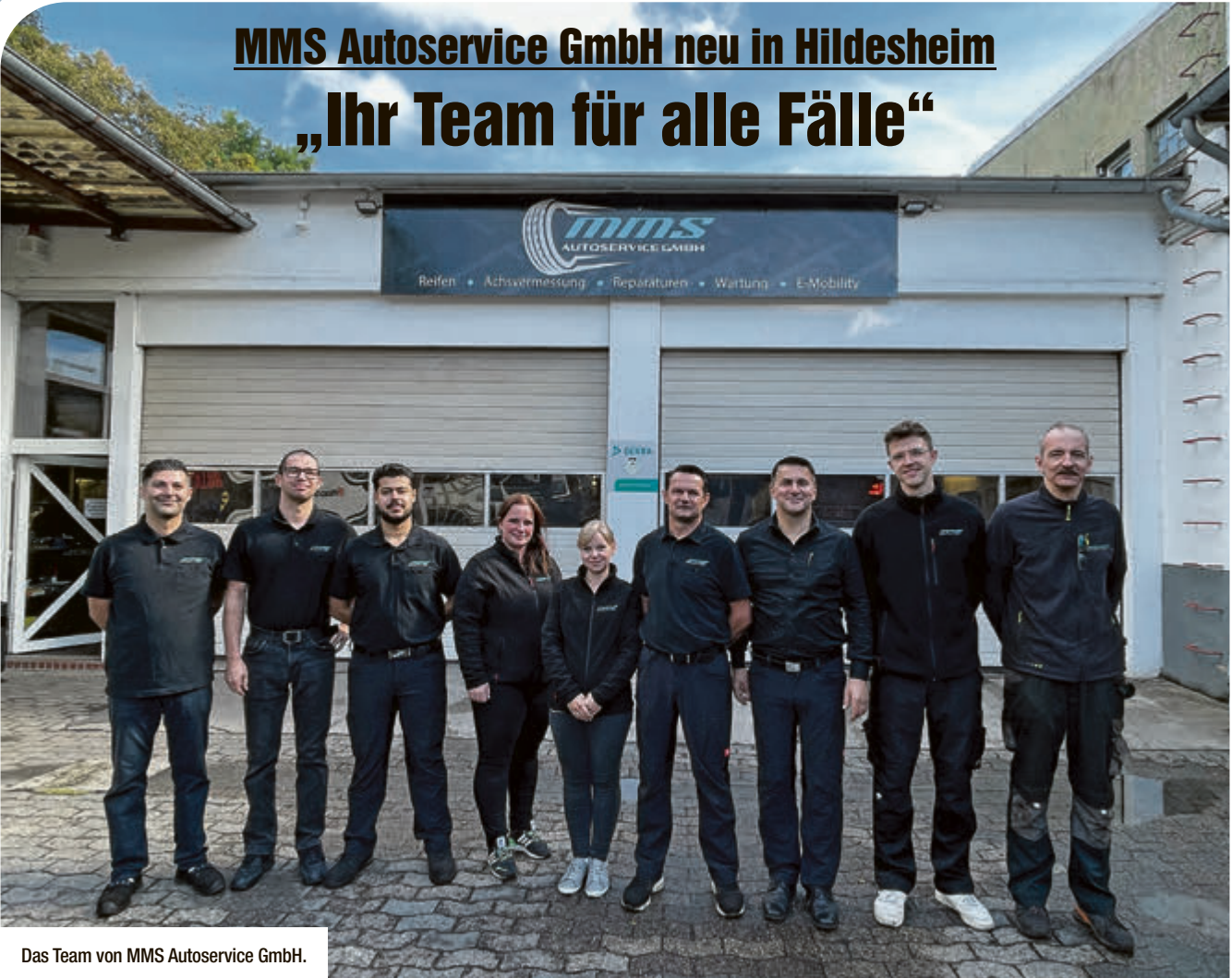
Das Team von MMS Autoservice GmbH.