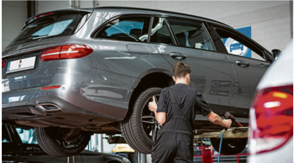
Im Oktober sollte von Sommer- auf Winterreifen gewechselt werden.

Schon wieder Oktober. Das bedeutet: Höchste Zeit für Winterreifen. Deshalb jetzt mit der Werkstatt einen Termin machen für den Reifenwech-