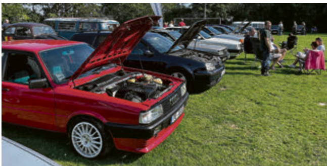
Facebook-Gruppe „Love My Oldtimer Hildesheim“.