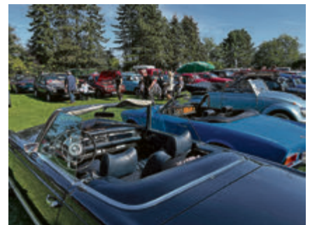
Über 300 Oldtimer kamen zum ersten Treffen nach Ottbergen.