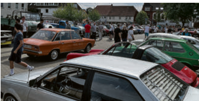
Viele Besucher kamen zum Innerstebad-Parkplatz, um sich an dem ausgestellten „Altmittel“ zu erfreuen.

VERTRAGSPARTNER GTÜ B&S DIE AUTOMOBILE SACHVERSTÄNDIGEN-GESELLSCHAFT BETTELS & SCHRADER