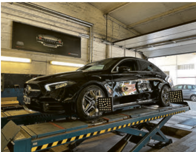
Die Firma MMS führt auch professionelle Achsvermessungen durch.

schon alleine der Erfahrung geschuldet – auf die Marken aus dem Volkswagen-Konzern. Aber auch alle anderen Fabrikate bis zu Elektroautos kön-