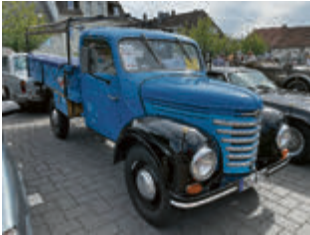
Barkas V 901/2 – Ein Kleinlastwagen aus der ehemaligen DDR mit 3-Zylinder Zweitakter und 28 PS.

Ferrari über Rolls-Royce und Porsche bis zu DDR-Kleinlastern und Brot-und-Butter-Autos gab es viel zu sehen – hier ein paar Bilder: