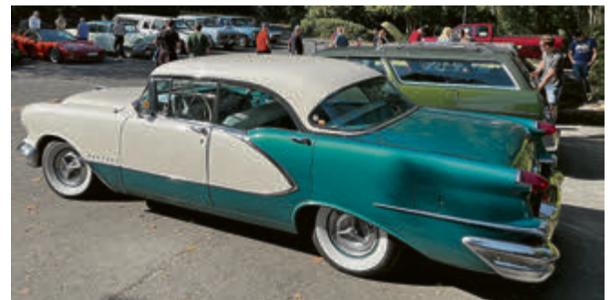
Auf dem Schulhof parkten diverse US-Cars.