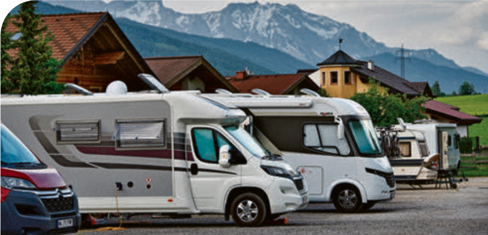
Im Herbst kann langsam an das Einmotten des Wohnmobils gedacht werden. Dabei sollten einige Punkte beachtet werden.

gehört es, den Motor mitten im Winter ab und zu anzulassen. Dabei entsteht neben unnötigem Verschleiß eine Menge Kondenswasser, das im Motor und in der Auspuffanlage für Korrosion sorgt.