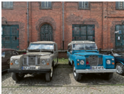
Zweimal Land Rover.