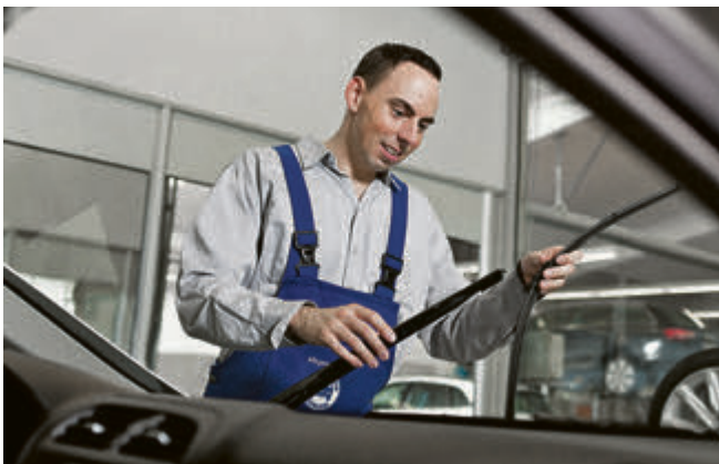
Die Wischerblätter sollten je nach Nutzungsfrequenz einmal im Jahr erneuert werden.

Damit die Wischer optimal arbeiten, muss die Scheibe aber auch einwandfrei sauber sein. Hartnäckige Insektenreste lassen sich mit entsprechendem Reiniger lösen, Wachsschlieren aus der Waschanlage mit Silikonentferner. Für drinnen tut es ein guter Glasreiniger. Aber nicht sprühen, sondern mit einem Schwämmchen oder Mikrofasertuch gezielt auftragen, sonst kann es Flecken auf den Kunststoffen geben. Dann nicht an-