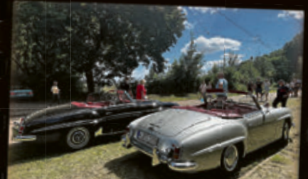
Hannoversches Straßenbahn Museum