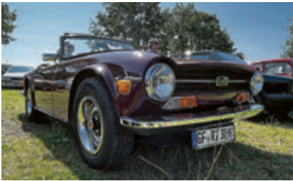
Mit 2,5 Liter Reihensechszylinder: Triumph TR 6 von 1972.

fen am 24. und 25. August wieder alles, was man an den bisherigen Treffen immer mochte – sehr zur Freude der vielen Teilnehmer und Zuschauer. Hier ein Überblick: