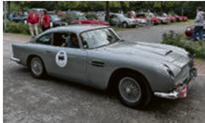
James Bonds Dienstwagen: Aston Martin DB5.