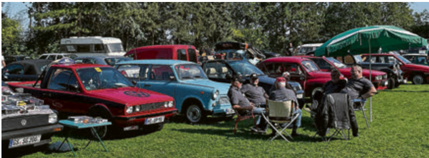
Die Oldtimerfreunde Söhlede.