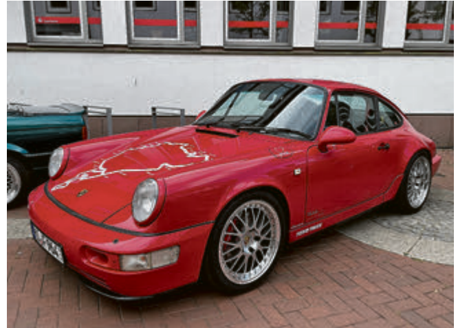
Porsche 964 – Mit Nürburgring auf der Fronthaube.