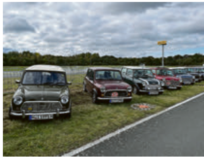
Eine Horde klassischer Minis.