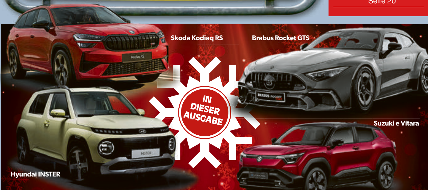
Skoda Kodiaq RS