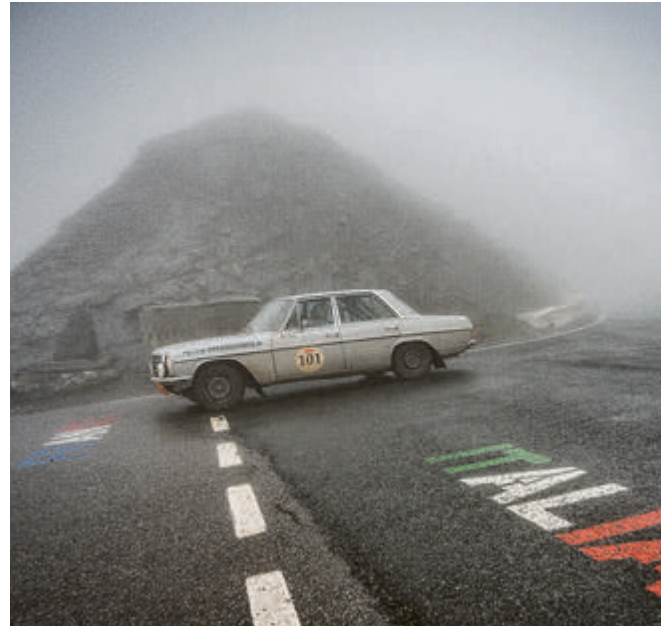
Grenzübertritt von Italien nach Frankreich im dichten Nebel.

te. Dass die freien Tage und auch Abende oft zum Schrauben genutzt wurden. Und dass sie in China zusätzlich Schnaps in den Tank gefüllt haben, weil das Benzin zu viel Wasser enthielt. 14.700 Kilometer haben Engelhardt und Schreiber hinter sich gebracht. Unterwegs gab es unzählige Schotterpisten, (Wüsten-)Sand und Matsch in allen Ritzen, Löcher in den Straßen tief und groß wie Plantschbecken, kaputte Bremshügel, von denen nur noch die Nägel empor rag-