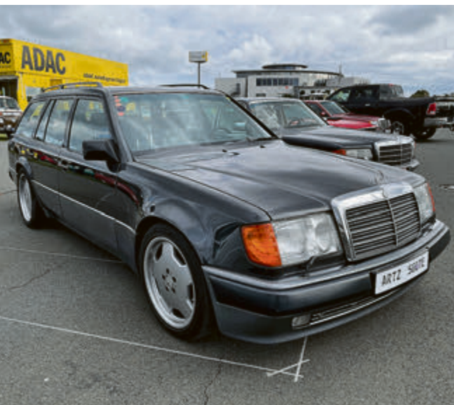
Gibt es nur zweimal: Mercedes 500 TE. Günther Artz aus Hannover (bekannt für seine exotischen Fahrzeugumbauten) hatte eine 500 E Limousine zum Kombi gemacht.