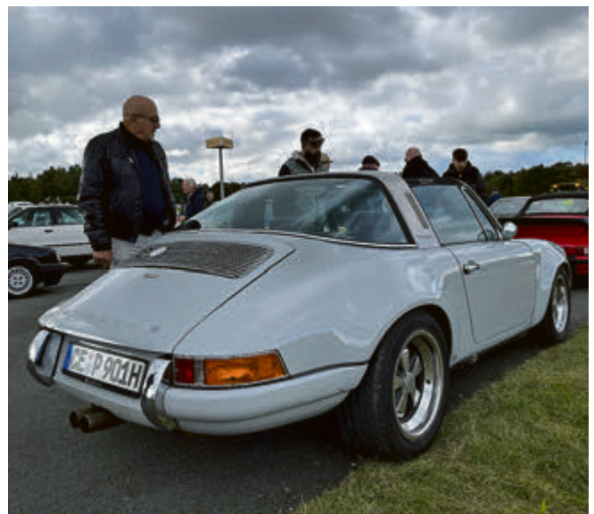
Mit einem Autogramm von Porsche-Papst Magnus Walker: Sehr gelungener Porsche 911 Backdate-Umbau von G-Modell (1989) auf F-Serie durch „Fineeleveln“.