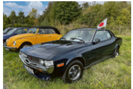
Hält die Japanische Flagge hoch: einer der schönsten Japanischen Oldtimer, der Toyota Celica GT von 1976.