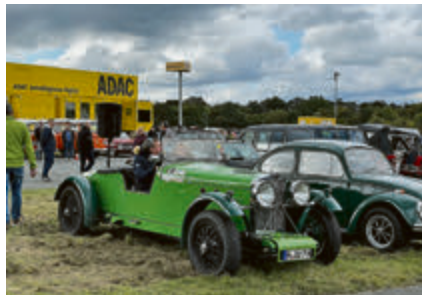
Mit sonorem Klang aus seinem 6-Zylinder machte sich dieser Talbot London von 1933 auf den Weg.