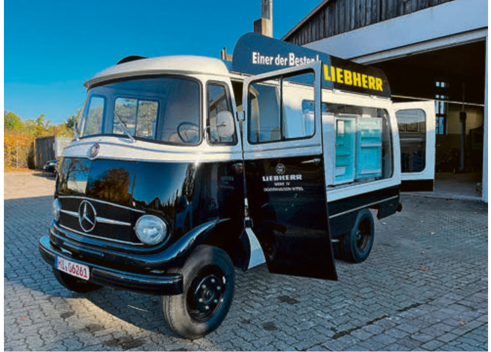
„Einer der Besten“ - Der Liebherr Mercedes-Benz L 319 ist ein echter Hingucker.

Und da kommt die Firma Werner Dreyer in Alfeld ins Spiel. Weit über die Stadtgrenzen hinaus hat sich der Mercedes-Benz-Classic-Service einen Ruf als kompetenter Spezialist für Mercedes-Veteranen-Nutzfahr-