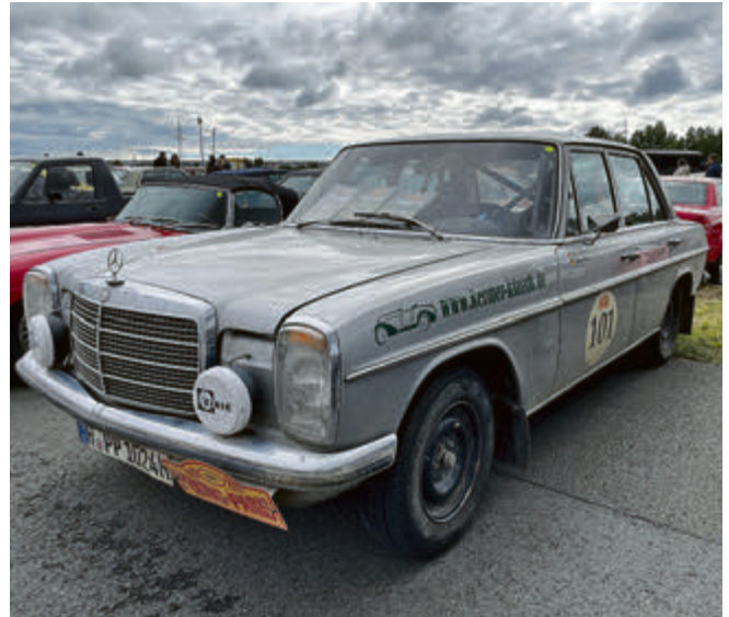
Dieser Mercedes-Benz 230 von 1975 hat an der diesjährigen Langstrecken-Rallye Peking-to-Paris teilgenommen (Mehr dazu ab Seite 16).