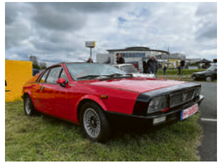
Lancia Beta Montecarlo.