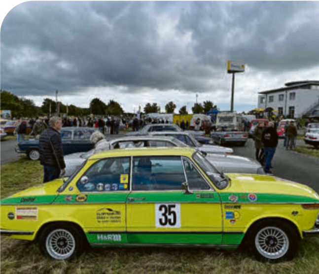
Oben graue Wolken, unten farbenfrohe Fahrzeuge. Bis mittags hatten insgesamt etwa 700 Old- und Youngtimer das Gelände des ADAC Fahrsicherheitszentrums besucht.