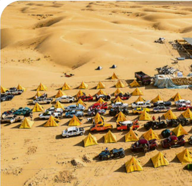
Offt wurde unterwegs in Luxushotels übernachtet – aber in der Wüste auch diverse Male in kleinen Zelten.