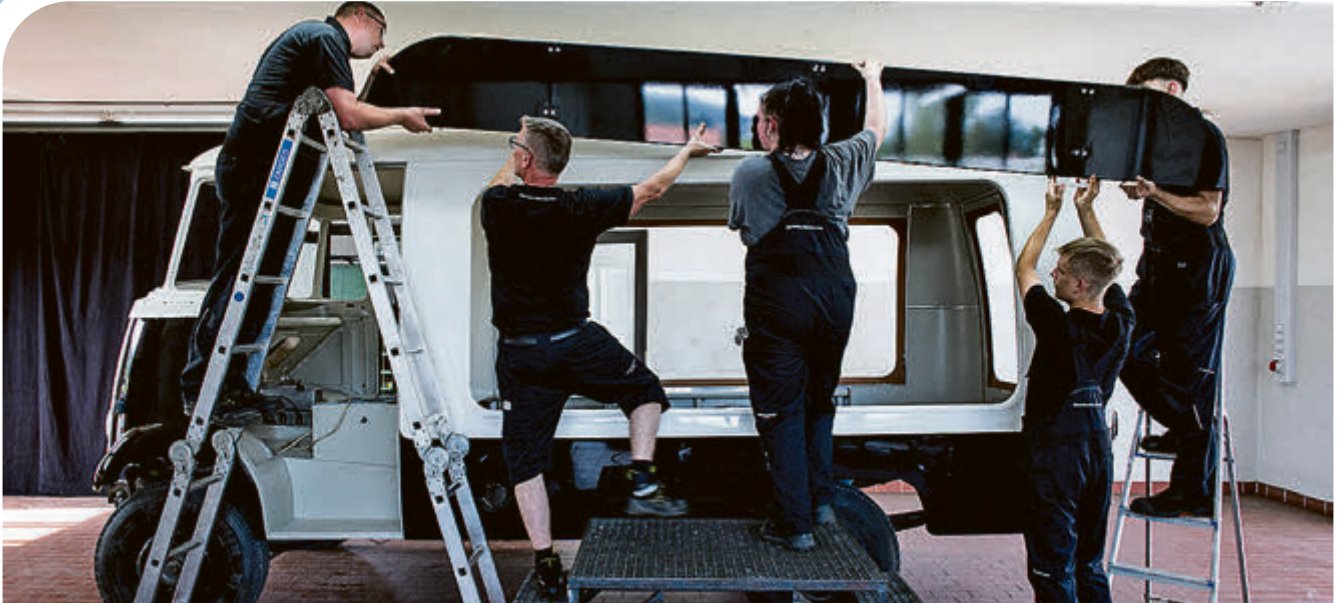
Mit vereinten Kräften: das Werbeschild wird installiert. Das Team von Dreyer sucht übrigens für den Oldtimerbereich noch nach personeller Verstärkung.