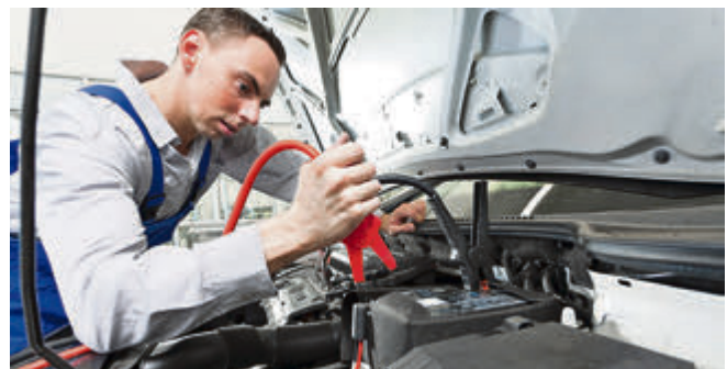
Die Autobatterie kann in der Werkstatt einfach auf Speicherkapazität, Ladezustand und die Kaltstromfähigkeit geprüft werden.

Während längerer Fahrten von 40 bis 60 Kilometern auf Landstraßen oder Autobahnen lädt sich die Starterbatterie schnell wieder auf. Eine volle Ladung setzt hingegen drei bis fünf Stunden Fahrzeit voraus.