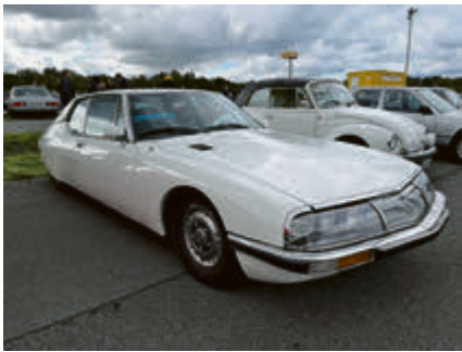
Mit Maserati-Motor: Citroen SM.

zwei- und vierrädigen Oldtimer die Besuchermagneten – von denen wir ein paar Highlights auf den folgenden Bildern zeigen. Was man auf den Bildern auch sieht: das Regenradar hatte recht, es blieb tatsächlich trocken!