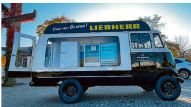
Sogar die Kühlschränke für die Schaufenster wurden vom Dreyer-Team restauriert.

de er dann komplett fahrbereit mit authentischen Ausstattungsstücken auf der Ladefläche und in einer schmunken Zweifarb-lackierung an Liebherr übergeben – ein echter Sympathieträger und unter den noch zugelassenen Mercedes L 319 sicher „einer der Besten“!