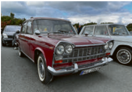
Fiat 2300 aus dem Jahr 1963 mit 105 PS Sechszylinder.