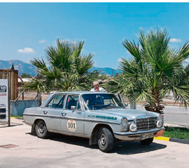
Das Arbeitsgerät: Ein fast handelsüblicher Mercedes 230, Baujahr 1975.