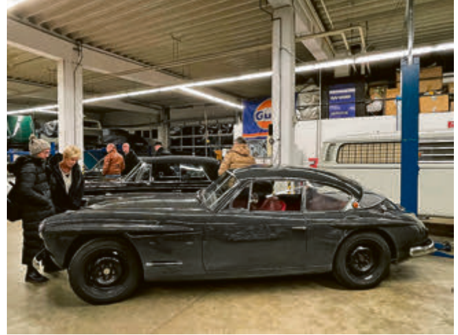
Die Besucher von HAC, Porsche Club und Mercedes SL Club bestaunten die Preziosen in Uwe Kermers Werkstatt.