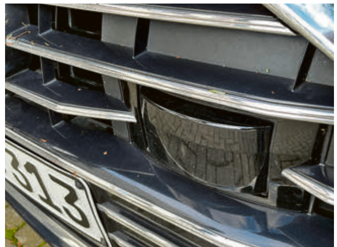
Dieses unauffällige, seltsame Gerät im Kühlergrill ist ein Radarsensor.

Damit gelingt sowohl die Abstandswarnung, als auch die automatische Geschwindigkeitsregelung ziemlich gut. Aber auch diese Technik kann an ihre Grenzen kommen. Während sie bei Nebel und Regen noch anstandslos arbeiten können, melden viele Radar-Sensoren bei Schneefall sicherheitshalber eine Funktionsstörung, weil sie von Schnee bedeckt schlicht nicht mehr uneingeschränkt und verlässlich Signale senden und empfangen können.