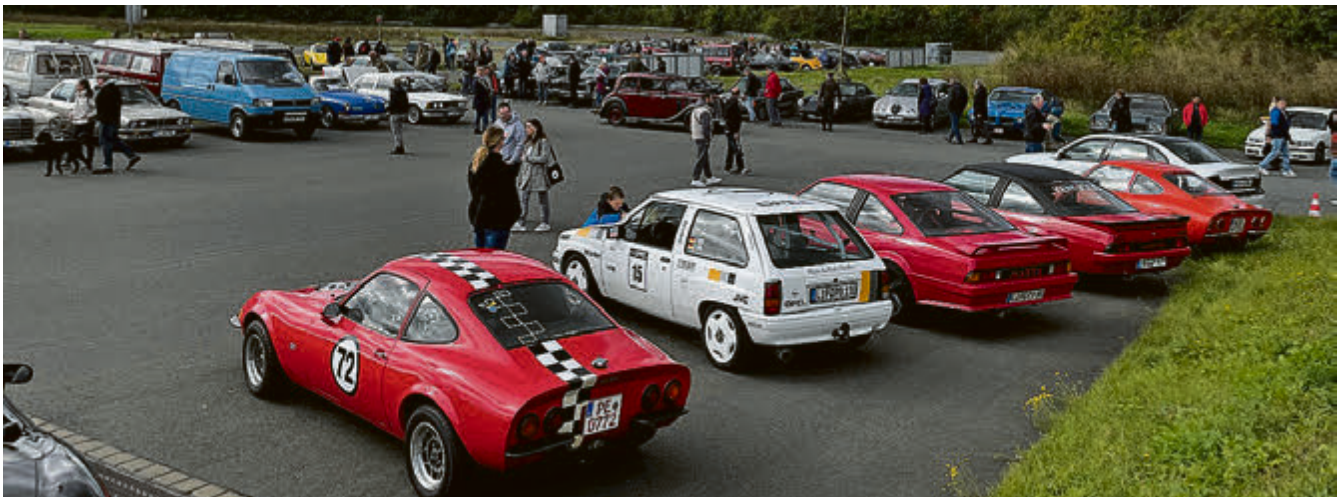
Opel GT, Corsa und Manta.