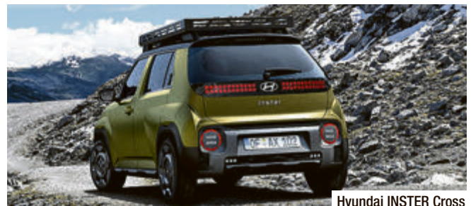
Hyundai INSTER Cross