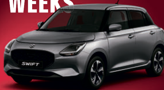
Abbildung zeigt aufpreispflichtige Sonderausstattung.