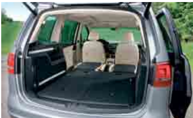
Dank EasyFold lassen sich die Sitze der zweiten Reihe einfach im Fahrzeugboden versenken.