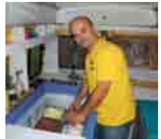
Verbrauch: 45 Eiskugeln auf 100 km.

Der 2,3 Liter-Diesel unter der Haube hat eine Leistung von 79 PS und ist gut für eine Höchstgeschwindigkeit von 122 km/h. Der Motor war eine – damals hoch gelobte – Neuentwicklung des Baujahres 1989, dieser Eiswagen ist von 1990. Mercedes bot ab Werk alleine 252 lieferbare Varianten