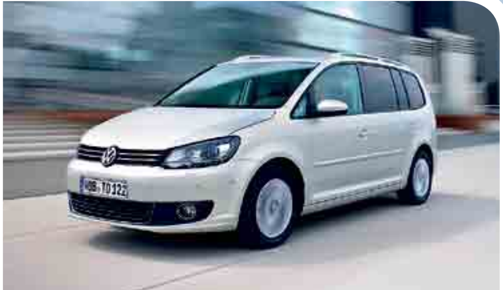
Neues Familiengesicht: auch der Touran trägt jetzt die VW-Design-DNA.

Außerdem neu an Bord: der Einstiegsbenziner 1.2 TSI, ein aufgeladener Direkteinspritzer mit ebenfalls 105 PS. Er verbraucht im Schnitt nur 6,4 l/100 km Kraftstoff (analog 149 g/km CO2). Als Variante mit BlueMotion Technology – und damit inklusive Start-Stopp-System und Rekuperation – sogar nur 5,9 l/100 km (139 g/km CO2). Eine hohe Effizienz zeichnet alle der insgesamt acht Antriebe –