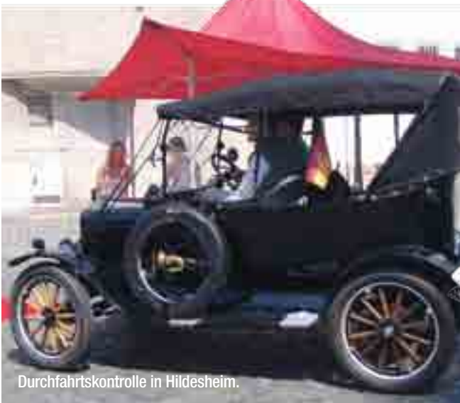
Durchfahrtkontrolle in Hildesheim.