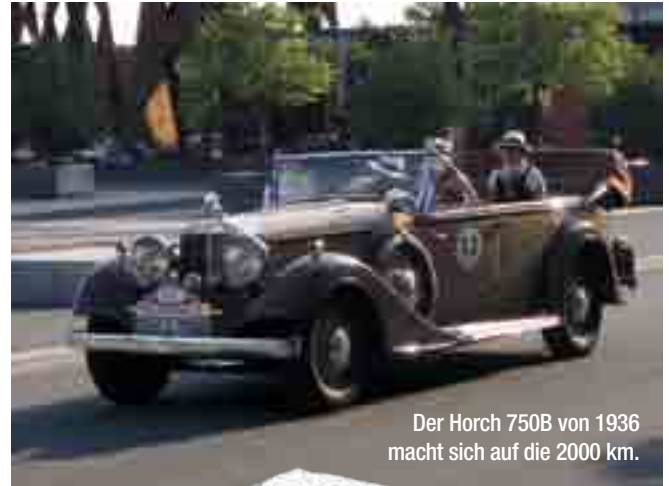
Der Horch 750B von 1936 macht sich auf die 2000 km.