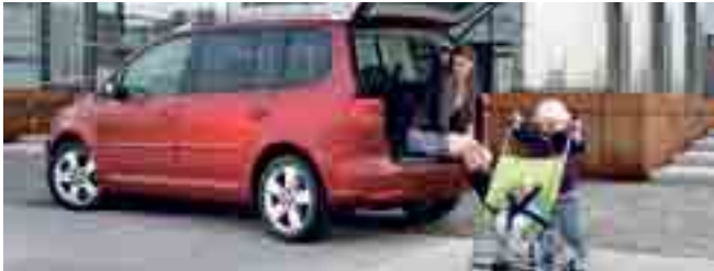
Platz fürs Familiengepäck: der Kofferraum des neuen Touran fasst 695 bis 1989 Liter.