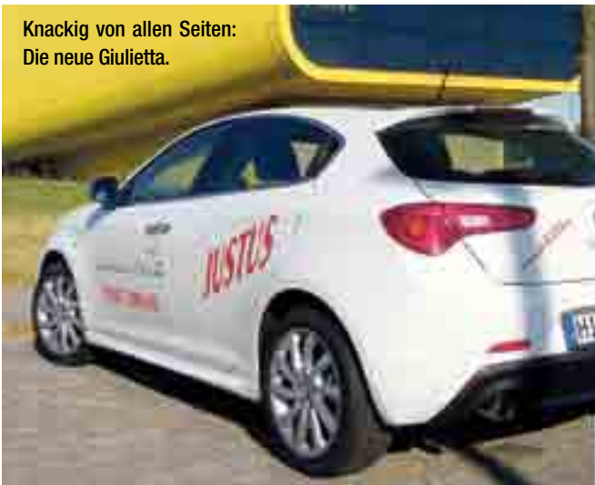
Knackig von allen Seiten: Die neue Giulietta.

Im Gegensatz zum Vorgänger Alfa Romeo 147 ist die Giulietta um 13 Zentimeter in der Länge und 7 Zentimeter in der Breite gewachsen. Das kommt vor allem dem Platzan-