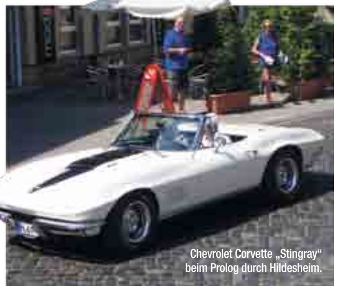
Chevrolet Corvette „Stingray“ beim Prolog durch Hildesheim.