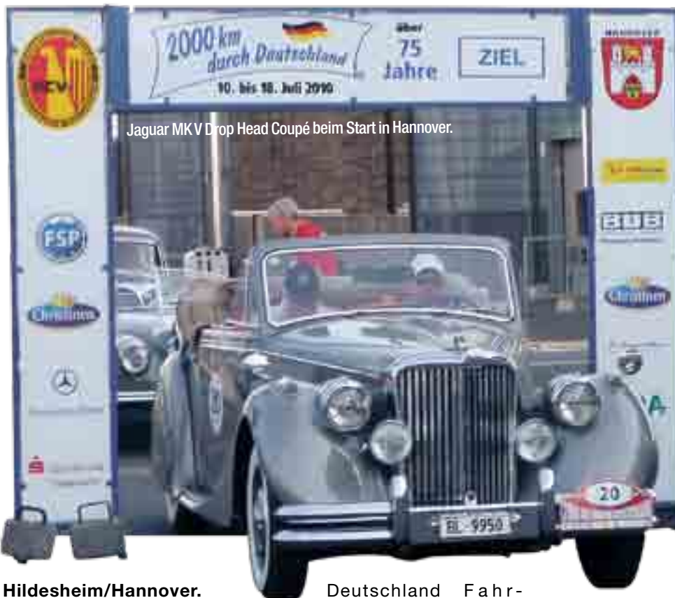
Jaguar MK V Drop Head Coupé beim Start in Hannover.

Hildesheim/Hannover. Nach der erfolgreichen Premiere im letzten Jahr, fand auch 2010 wieder ein Prolog zu den 2000 km durch