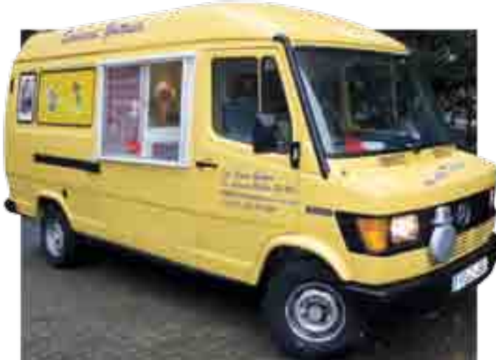
Von THOMAS SCHROEDEL

Auf den Straßen in Stadt und Landkreis tummeln sich nicht nur PKW aller Marken und Klassen, sondern auch mal das ein oder andere Vehikel, das für besondere Aufgaben konzipiert wurde: als Transportmittel, Lastenesel, Versorger, Aufräumer, Aufpasser und mehr. Diese Fahrzeuge stellen wir Ihnen hier in lockerer Reihenfolge vor.