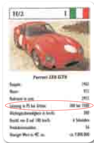
Schon im Auto-Quartett war die PS-Zahl das Wichtigste.

Als James Watt (geboren 1736 im schottischen Greenock) dieses Prinzip dann noch verfeinerte und kleinere, leistungsstarke Dampfmaschinen entwickelte, wurde der Beginn der weltweiten Industrialisierung eingeläutet. Er selbst führte 1770 eine Maßeinheit ein, mit der er den