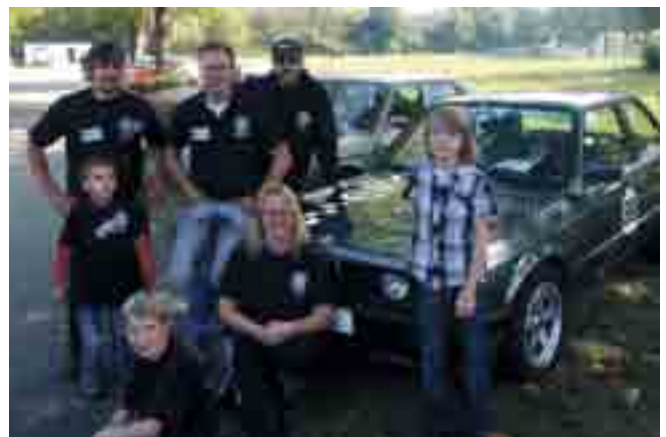
Das Orga-Team freut sich auf rege Beteiligung.