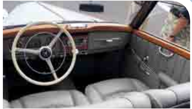
Blick in den makellosen Innenraum des 170S Cabriolet A. Für den damaligen Preis des Röhrenradios konnte man auch ein einfaches Motorrad kaufen!

Dieser Wagen stellte seinerzeit das deutsche Traumcabriolet überhaupt dar und begeistert noch heute durch den besonderen Gelbton seiner Lackierung. Dicht dahinter ein 170S Cabriolet A. Man könnte die beiden fast für Zwillinge halten, wenn da nicht der Leistungsunter-