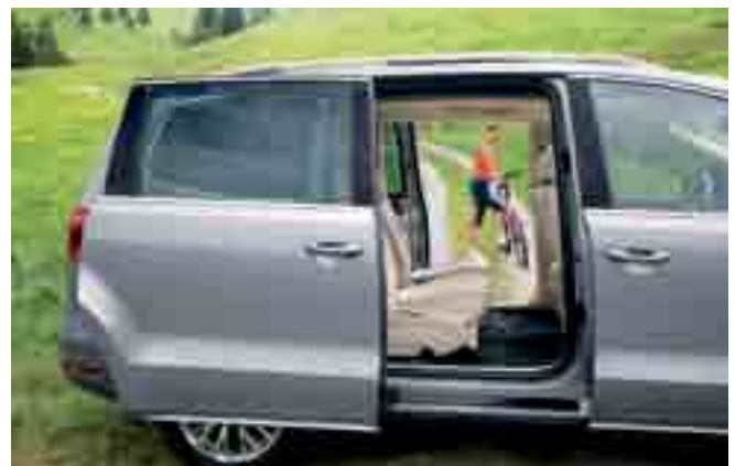
Durchreiche: der Sharan mit praktischen Schiebetüren.