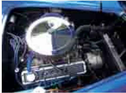
Kraftpaket: der 5,7 Liter V8 von Chevrolet mit Edelbrock-Zylinderköpfen.