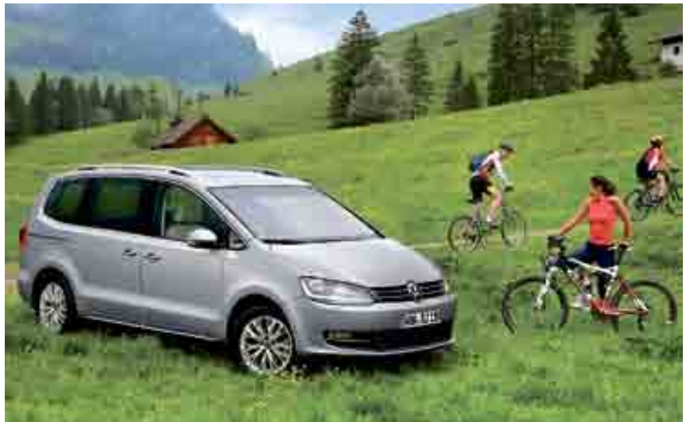
Mit 4,85 Metern genau 22 Zentimeter länger als sein Vorgänger: der neue VW Sharan.