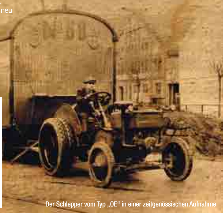
Der Schlepper vom Typ „OE“ in einer zeitgenössischen Aufnahme