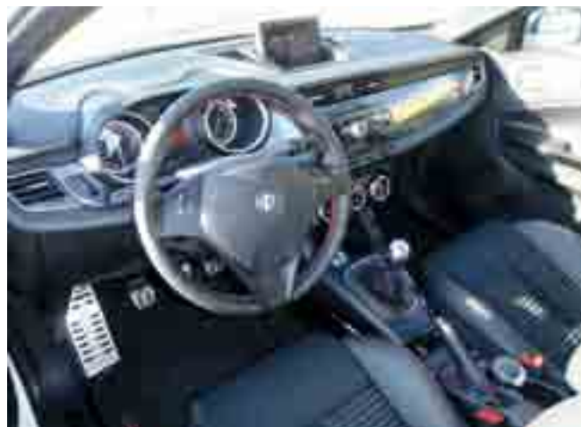
Hochwertiges Interieur mit gebürstetem Alu und Klavierlack.

Fazit: Mit dem neuen Julchen hat Alfa Romeo alles richtig gemacht: Ein elegant sportliches Automobil, mit kräftigen Motoren und umfangreicher Ausstattung, zu fairen Preisen. Diese Giuliet-