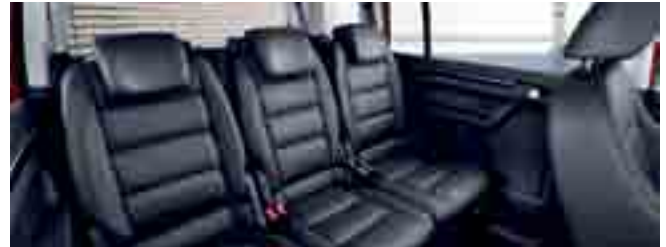
Den Touran gibt es als 5- und 7-Sitzer.