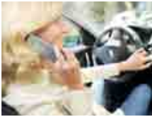
Gefährlich und Teuer - das Telefonieren beim Autofahren.

40 Euro Bußgeld und ein Punkt in Flensburg – das ist die Strafe für diejenigen, die während der Autofahrt mit dem Telefon in der Hand hinterm Steuer erwischt werden. Die Nutzung einer Freisprechanlage dagegen ist erlaubt. Trotz-