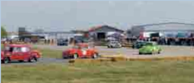
Oldtimertreffen, Teilemarkt und Renn-Action: das ist die Technorama

teratur, Modelle, restaurierte und patinierte Auto- und Motorradoldtimer auf neue Besitzer, Clubs zeigen ihre Autos, genau wie etwa 1000 Privatleute und auf dem 2,7 km langen Rundkurs gibt es klassischen Motorsport hautnah. Über 500 Rennteilnehmer liefern