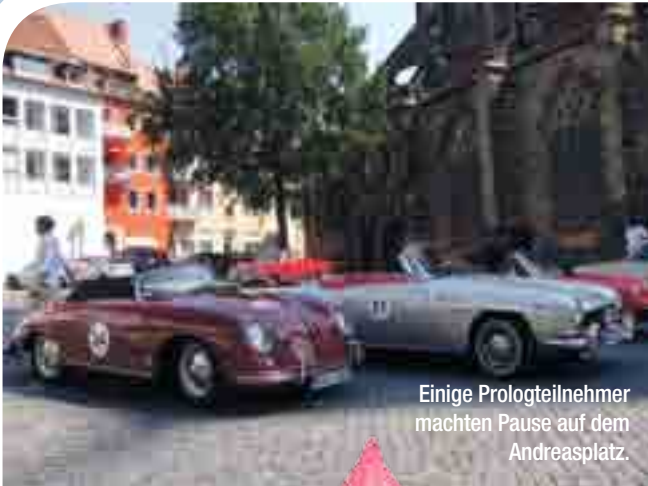
Einige Prologteilnehmer machten Pause auf dem Andreasplatz.