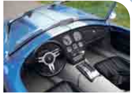
Nur das Nötigste: der Innenraum der Cobra verzichtet auf Luxus-Schnick-Schnack.

stammen aus einem Jaguar XJ6, das TH 350 Automatikgetriebe von Chevrolet, härter gemacht von Art Carr. Und damit gut für so manchen Zwischenspur („Auch auf der Autobahn kann man immer noch locker eine