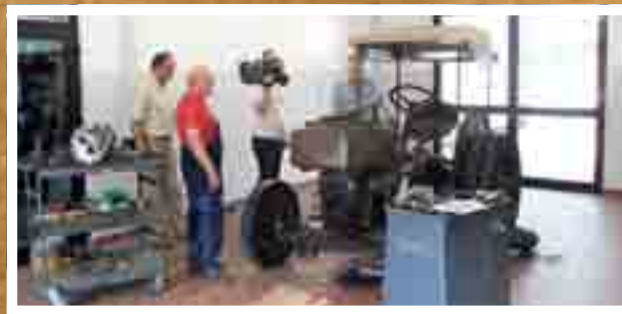
Ein Filmteam dokumentierte die Restauration

Mehr Infos über die Alfelder Lastwagen-Veteranenwerkstatt Dreyer gibt es im Internet unter: www.classic-truck.de