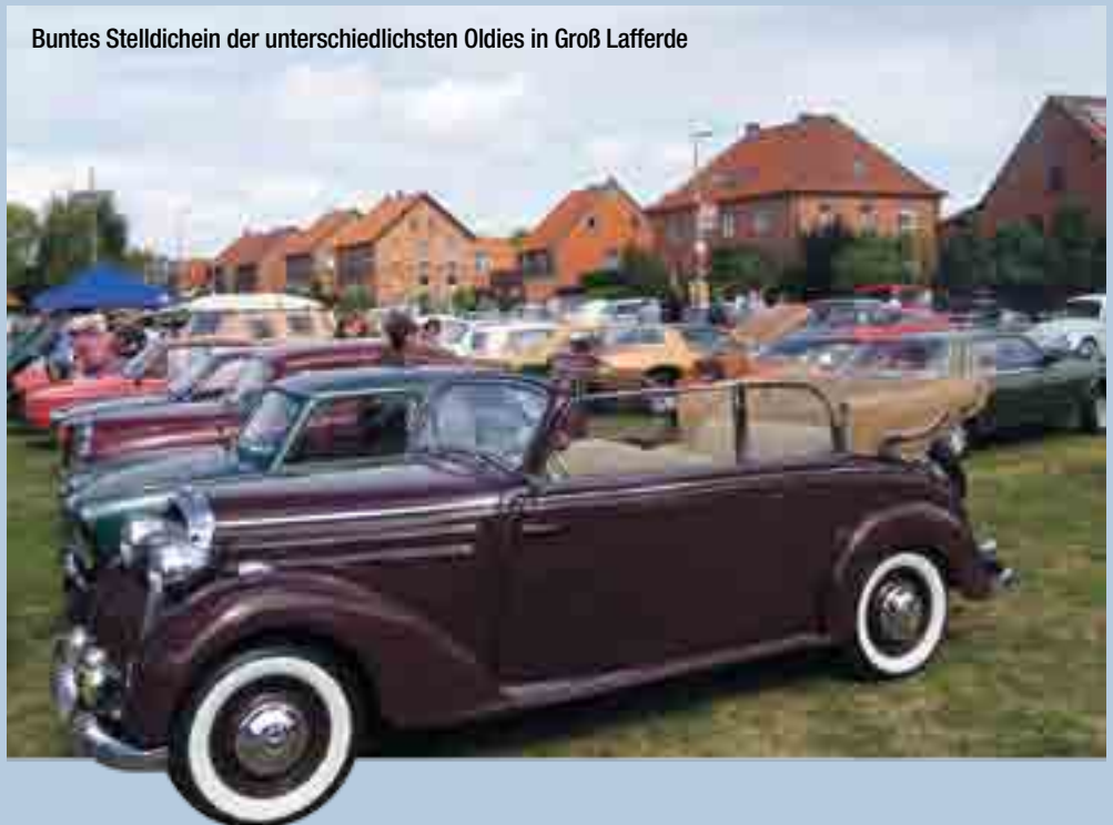
Buntes Stelldichein der unterschiedlichsten Oldies in Groß Lafferde