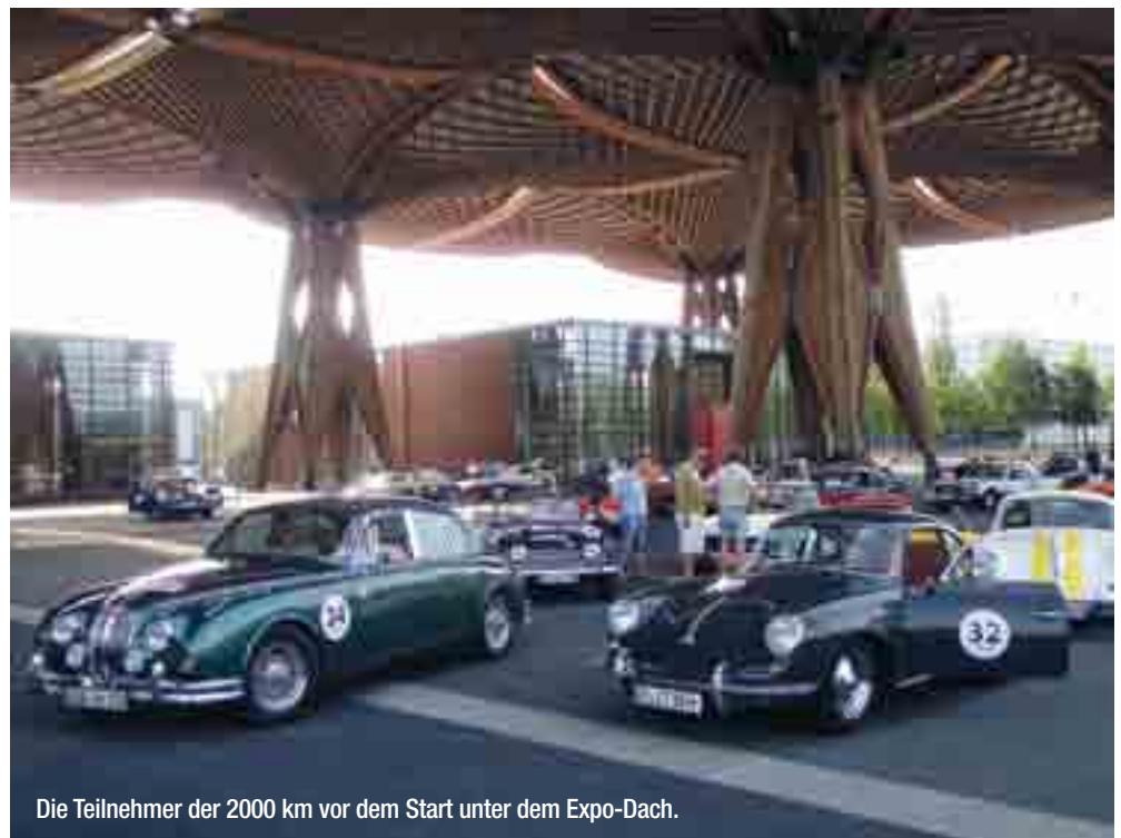
Die Teilnehmer der 2000 km vor dem Start unter dem Expo-Dach.