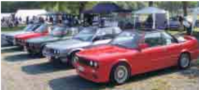
In Sarstedt sind alle BMW Old- und Youngtimer willkommen.

und privaten Teilemarkt, diverse Firmen präsentieren ihr Know-How rund ums Kfz, jedes Fahrzeug erhält ein Gastgeschenk, es gibt Preise, z.B. für die weiteste Anreise, eine Tombola und vieles mehr. Natürlich wird auch für das leibliche Wohl gesorgt. Informationen und Anmeldung unter www.e30-freunde-niedersachsen.de