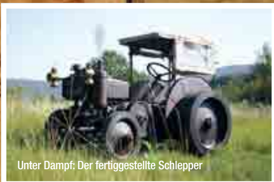
Unter Dampf: Der fertiggestellte Schlepper