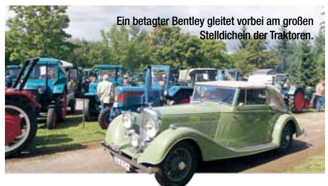
Ein betagter Bentley gleitet vorbei am großen Stelldichein der Traktoren.