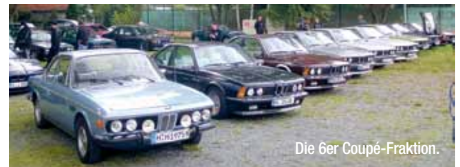
Die 6er Coupé-Fraktion.