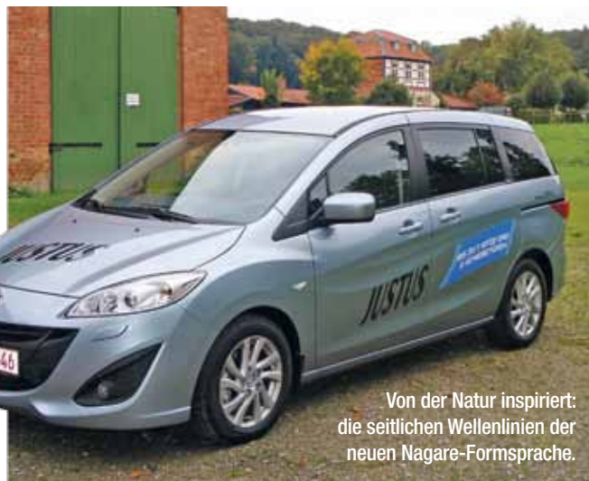
Von der Natur inspiriert: die seitlichen Wellenlinien der neuen Nagare-Formsprache.

Fahraktivität etwas anderes. Eine Disziplin, für die Vans auch nicht gerade bekannt sind. Der Testwagen hat den neuen 2-Liter-Benzin-Direkteinspritzer unter der Haube, mit 150 PS. Das reicht,