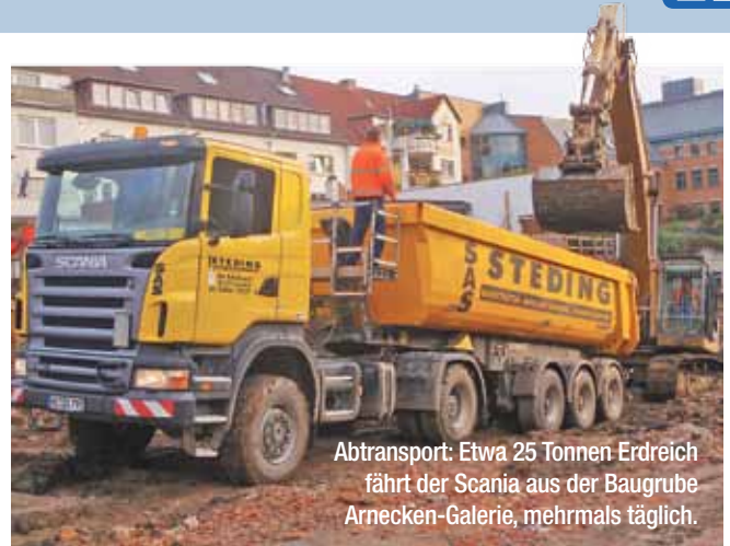
Abtransport: Etwa 25 Tonnen Erdreich fährt der Scania aus der Baugrube Arnecken-Galerie, mehrmals täglich.

auf dem Hof besser einparken konnte als die Fahrer.