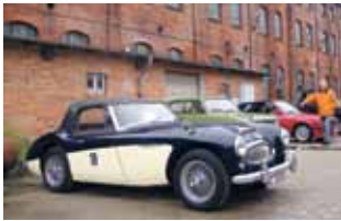
Schmuckstück: Austin Healey 3000 MKII von 1962.