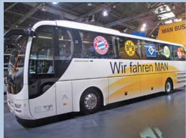
Mannschaftsbus: MAN Lion's Coach.