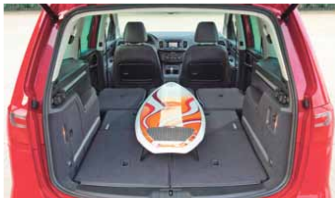
Zwei seitliche Schiebetüren und eine ebene Ladefläche mit bis zu 2430 Litern Volumen machen aus dem Alhambra einen praktischen Transporter.

cker. Der TSI Benziner leistet dabei 150 PS und ein weiterer TDI 170 PS. Letzterer ist serienmäßig mit dem Sechsstufen-Doppelkupplungsgetriebe DSG ausgestattet.