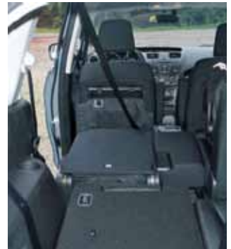
Das flexible 7-Sitz-System ermöglicht schier unerschöpfliche Sitzkonfigurationen.

Der Mazda5 ist komfortabel, mit dem neuen 2-Liter-Benzindirekteinspritzer sparsam und agil und mit dem flexiblen Sitzsystem unvergleichlich variabel. Ja, ich gestehe, für einen Van ist der neue Mazda5 kein schlechtes Auto!