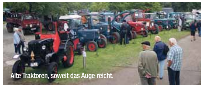
Alte Traktoren, soweit das Auge reicht.