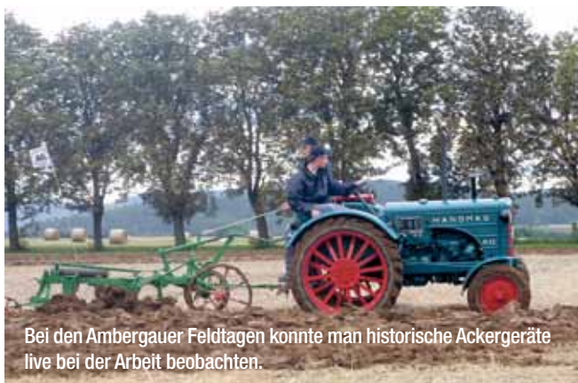
Bei den Ambergauer Feldtagen konnte man historische Ackergeräte live bei der Arbeit beobachten.