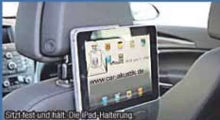
Sitzt fest und hält. Die iPad-Halterung