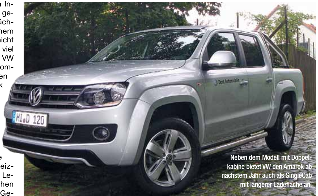
Neben dem Modell mit Doppelkabine bietet VW den Amarok ab nächstem Jahr auch als SingleCab mit längerer Ladefläche an.

Schweres Gelände habe ich auf der Testfahrt allerdings gemieden – denn auch dafür wirkte der Amarok viel zu edel.