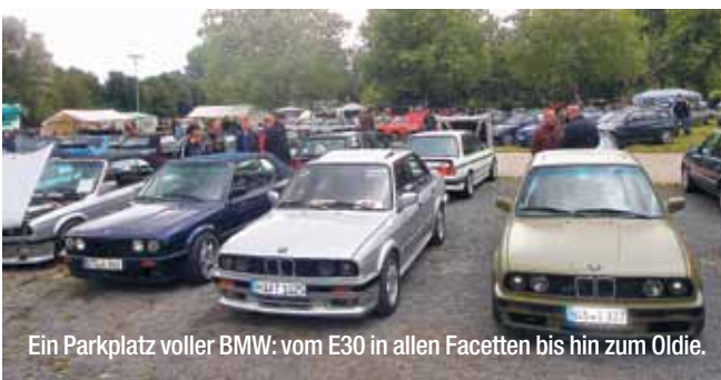
Ein Parkplatz voller BMW: vom E30 in allen Facetten bis hin zum Oldie.

BMW-Meisterprüfung: Welche BMW-Teile befinden sich in diesem Zylinder?