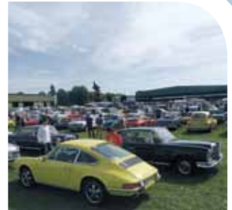
Oldtimer aller Marken, Klassen und Jahrgänge bevölkerten zur Technorama das Hildesheimer Flughafen-gelände.

bevölkerten. Sammler und Bastler fanden auf dem Teilemarkt das lang gesuchte Objekt der Begierde und Oldtimer-Clubs aus der Umgebung präsentierten ihre Fahrzeuge. Ob und wo die Technorama im nächsten Jahr stattfindet, stand zum Redaktionsschluss noch nicht fest, da das Dröhnen von Motoren leider nicht jedermanns Sache ist.