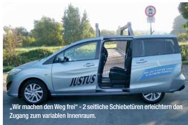
„Wir machen den Weg frei“ - 2 seitliche Schiebetüren erleichtern den Zugang zum variablen Innenraum.