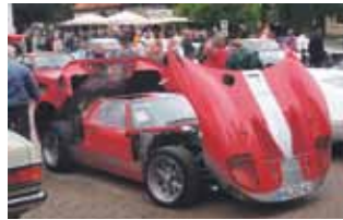
Publikumsmagnet: Ford GT 40.