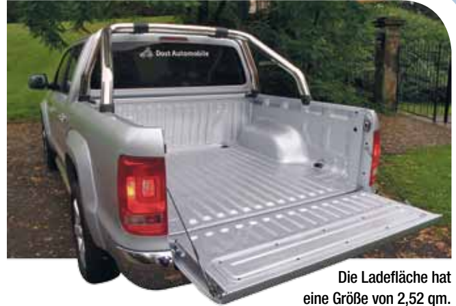
Die Ladefläche hat eine Größe von 2,52 qm.

Und weil unter der Haube der raue aber kräftige 2-Liter-Biturbo-Diesel mit 163 PS und einem Drehmoment