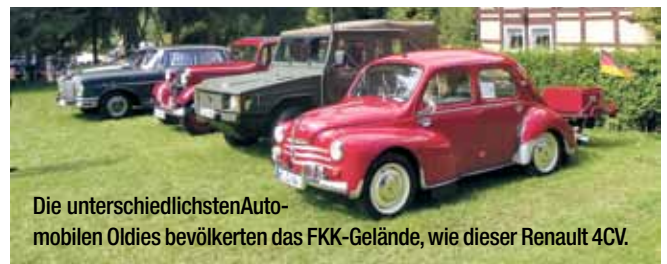
Die unterschiedlichsten Automobilen Oldies bevölkerten das FKK-Gelände, wie dieser Renault 4CV.

Zeitreise klingt, ist das Oldtimer-Treffen der Oldtimer IG Volkersheim e.V., das Ende August zahlreiche Besucher in den kleinen Ort bei Bockenem gelockt hat. Auf den parallel stattfindenden Ambergauer Feldtagen konnten dann die historischen Ackergeräte sogar live bei der Arbeit beobachtet werden. Eine Veranstaltung, die aufgrund ihres Eventcharakters trotz grauer Wolken am Himmel einmal mehr ein Publikumsmagnet war.