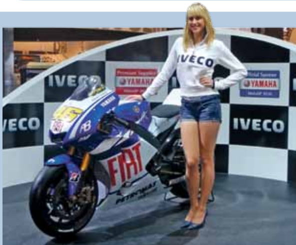
Heißes Teil: Iveco und Fiat als Sponsor von Yamaha beim MotoGP.

Top-Angebote an Winterreifen, Stahl- und Alufelgen!