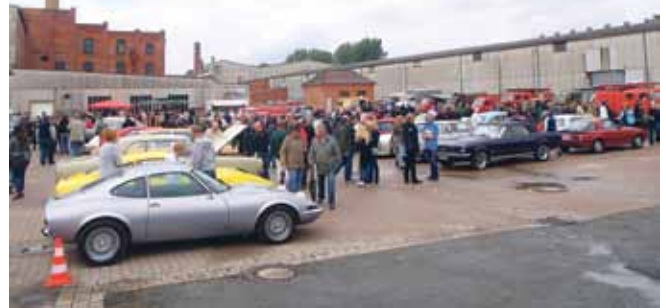
Auch bei den 3. Duingen Motor Classics tummelten sich wieder die unterschiedlichsten Old- und Youngtimer.

stang, vom Fiat 500 bis zum Buick Le Sabre, vom VW 1600 bis zum Austin Healey. Dazu tönnte live gespielte, handgemachte Rockmusik über das Gelände, für die Kinder gab es abwechslungsreiche Belustigung und für alle eine umfangreiche Gastronomie. Ein Mix, der für einen spannenden Familienausflug sorgte. Und für so manchen geheimen Wunsch: „Den will ich haben!“