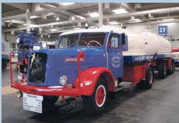
So transportierte man in den 50er Jahren: Henschel HS 140 mit 145 PS und einer Höchstgeschwindigkeit von 65 km/h.