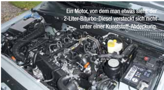
Ein Motor, von dem man etwas sieht: der 2-Liter-BiTurbo-Diesel versteckt sich nicht unter einer Kunststoff-Abdeckung.

Wie in den anderen PKW-Segmenten, in denen VW sehr spät eingestiegen ist, wird auch bei den Pickups der Amarok der Konkurrenz das Fürchten lehren. Der Wolf hetzt die Meute.