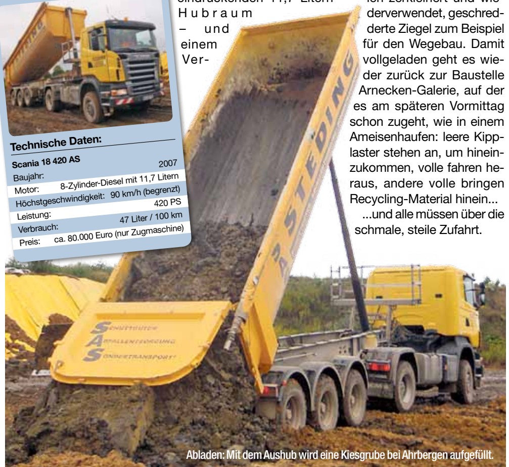
Abladen: Mit dem Aushub wird eine Kiesgrube bei Ahrbergen aufgefüllt.