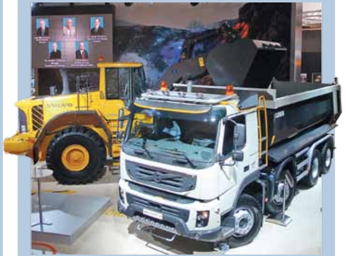
Schweres Gerät: Volvo zeigt Baustellen-Know-How.

160 Kilometer Reichweite ohne Emission: Premiere des Renault Kangoo Rapid Z.E. Der 4,21 Meter lange Elektrotransporter kommt 2011 mit den gleichen Ladekapazitäten wie der Kango Rapid mit Benzin- und Dieselladegerät: Je nach Ausbau bietet das Ladeabteil 3,0 bis 3,5 Kubikmeter Volumen.