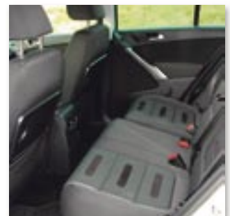
Hohe Variabilität durch verschiebbare Rückbank