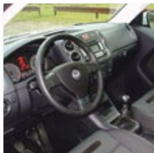
Gute Verarbeitung und eine hervorragende Ergonomie kennzeichnen den Innenraum des Tiguan

brett. Die Regler für Lüftung, Heizung und Radio liegen griffgünstig, die Instrumente sind gut abzulesen und die blaue Illuminierung mag man sowieso. Zahlreiche Ablagen schlucken Kleinkram, bei den vielen Flaschen- und Becherhaltern braucht niemand zu verdursten. Die Passagiere der Rückbank freuen sich über praktische Klappstischen in den Lehnen der