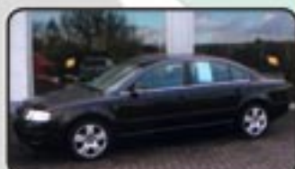
Skoda Superb 2.0 TDI DPF Comfort EZ 09/06, 31.000 km, 103 kW, Klima- autom., Partikelf., Tempomat, Leder, Sitzhg., Alu 17", Radio/CD uvm. MwSt. awb. EURO 19.970,-