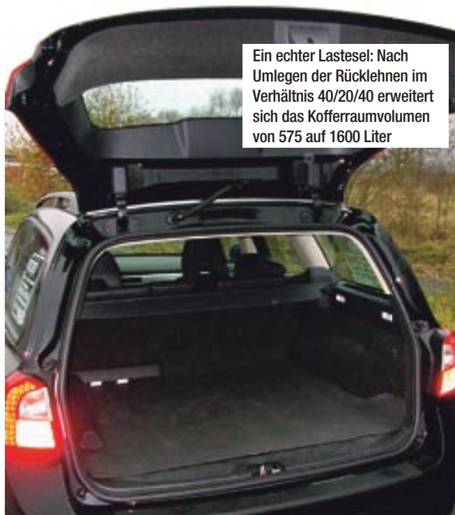
Ein echter Lastesel: Nach Umlegen der Rücklehnen im Verhältnis 40/20/40 erweitert sich das Kofferraumvolumen von 575 auf 1600 Liter