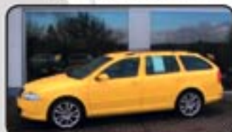
Skoda Octavia II Combi 2.0 TDI RS EZ 10/07, 14.800 km, 125 kW, Navig., CD-Wechsler, el. GSD, Sitzhg., Partikel- filter, Xenon, Klimaautom. uvm. MwSt. awb. EURO 24.970,-