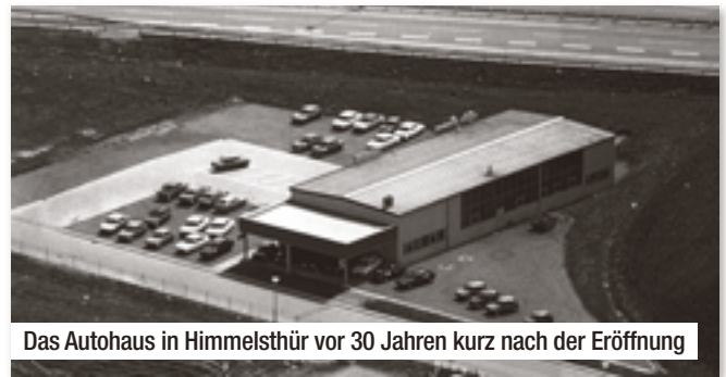
Das Autohaus in Himmelsthür vor 30 Jahren kurz nach der Eröffnung