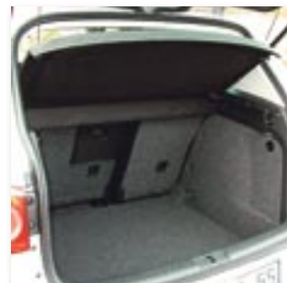
Das Kofferraumvolumen lässt sich durch Verschieben und Umliegen der Rückbank auf ein Volumen von bis zu 1510 Liter erweitern