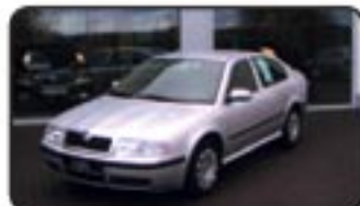
Skoda Octavia 1.6 Tour EZ 03/07, 7.200 km, 75 kW, Klima, el. FH, ABS, Radio/CD, el. Spiegel, BC, ABS, ASR, Rückbank geteilt uvm. MwSt. awb. EURO 12.270,-