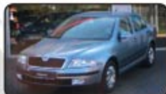
Skoda Octavia II 2.0 FSI Ambiente EZ 11/06, 2.000 km, 110 kW, Klimaau- tom., Einparkhilfe, Radio, Airbags, ABS, ESP, ZV, el. FH, ASR, 6-Gang uvm. MwSt. awb. EURO 17.470,-