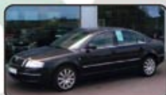
Skoda Superb 2.8 V6 Eleg. Tiptronic EZ 06/05, 22.200 km, 142 kW, Klima- autom., Navig., Leder, Xenon, Einpark- hilfe, CD-Wechsler, Tempomat uvm. MwSt. awb. EURO 19.970,-