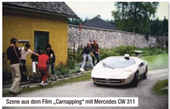
Szene aus dem Film „Car napping“ mit Mercedes CW 311

fer, die ihr Auto auch wegen des Images fuhren, waren ISDERA-Käufer einfach begeistert vom Styling und der innovativen Technik, die in den Autos steckte. Und die kam nicht von ungefähr: Sein Geld verdiente Schulz mit geheimen Entwicklungen für viele große Automobilhersteller, die Sportwa-