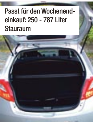
Passt für den Wochenend- einkauf: 250 - 787 Liter Stauraum