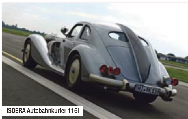
ISDERA Autobahnkurier 116i

Mit gut 5,60 Metern Länge, fast 2 Metern Breite, den ausladenden Kotflügeln und