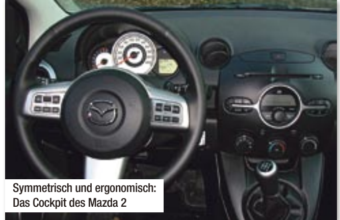
Symmetrisch und ergonomisch: Das Cockpit des Mazda 2