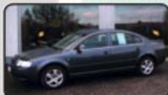
Skoda Superb 1.9 TDI Comfort EZ 08/07, 20 km, 85 kW, Klimaautom., Navig., Xenon, CD-Wechsler, el. FH, Sitzhg., Alu, Tempomat uvm. MwSt. awb. EURO 19.970,-