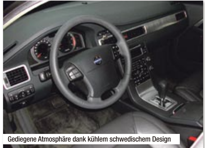
Gediegene Atmosphäre dank kühlem schwedischem Design

Fazit: Florian Illies liegt gar nicht so verkehrt mit seiner Aussage: Der Volvo V70 ist ein Kombi, der große Variabilität, einen souveränen Dieselmotor und innovative Sicherheitstechnik mit zeitlosem Understatement paart und damit das Zeug hat, Liebling der Zielgruppe zu bleiben – aber bitte in Schwarz.