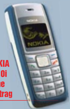
NOKIA 1110i ohne Vertrag

Die Firma Multimedia Store in Sarstedt hat das Nokia-Handy 1110i ohne Vertrag zur Verlosung bereit gestellt, mit außergewöhnlichen Klingeltönen in MP3-Qualität, im Wert von ca. 60,- Euro.