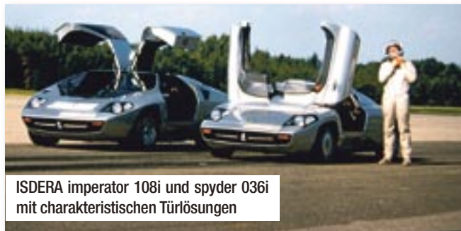
ISDERA imperator 108i und spyder 036i mit charakteristischen Türöffnungen

Wer den Autobahnkurier auf einer seiner seltenen Ausfahrten durch den Hildesheimer Stadtverkehr oder über die Landstraßen im Landkreis erblickt, ist von seiner Präsenz überwältigt.