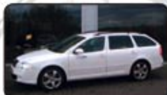
Skoda Octavia II Combi 2.0 TDI RS EZ 10/07, 5.000 km, 125 kW, Navig., CD-Wechsler, Tempomat, Sitzhg., Partikelfilter, Xenon, Klimaautom. uvm. MwSt. awb. EURO 28.970,-