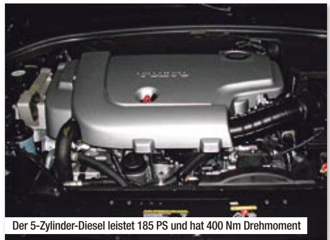
Der 5-Zylinder-Diesel leistet 185 PS und hat 400 Nm Drehmoment