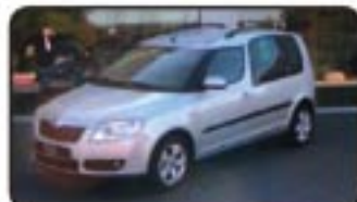
Skoda Roomster 1.4 TDI DPF Comf. EZ 06/07, 3.000 km, 59 kW, Klima, ABS, ESP, Partikelfilter, ZV, Sitzhg., el. Spiegel, BC, Dachreling uvm. MwSt. awb. EURO 16.970,-