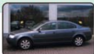
Skoda Superb 2.0 TDI DPF Comfort EZ 09/07, 1.000 km, 103 kW, Klima- autom., Partikelfilter, Leder, Sitzhg., Radio/CD, Xenon, Nebel uvm. MwSt. awb. EURO 22.870,-