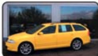
Skoda Octavia II Combi 2.0 TDI RS EZ 10/07, 3.000 km, 125 kW, Navig., CD-Wechsler, el. GSD, Sitzhg., Partikel- filter, Xenon, Klimaautom. uvm. MwSt. awb. EURO 29.470,-