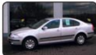
Skoda Octavia II 1.6 Ambiente EZ 11/06, 18.000 km, 75 kW, Klima, el. FH, el. Spiegel, BC, Einparkhilfe, Nebel, Airbags, ABS, ESP, Radio/CD uvm. MwSt. awb. EURO 14.770,-