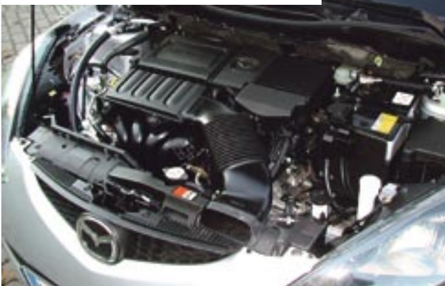
Der agile 1.5 Liter-Motor beschleunigt den kleinen Mazda in 10,4 Sekunden auf 100 km/h

Am Steuer hat man alles im Griff, blickt auf ein fast symmetrisches und dazu benutzerfreundlich gestaltetes Armaturenbrett, der