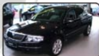
Skoda Superb 2.0 TDI DPF EZ 08/07, 20 km, 103 kW, Klimaau- tom., Leder, Sitzhg. v+H, Alu 17", CD-Wechsler, Tempomat, BC uvm. MwSt. awb. EURO 27.970,-