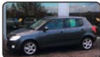
Skoda Fabia II 1.4 16V Sport EZ 08/07, 20 km, 63 kW, Klimaautom., ABS, ESP, Einparkhilfe, Tempomat, Sitzhg., getönte Scheiben uvm. MwSt. awb. EURO 14.470,-