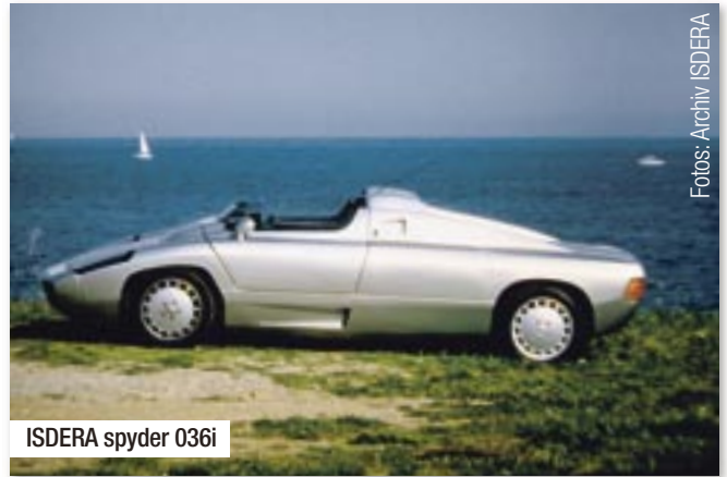
ISDERA spyder 036i