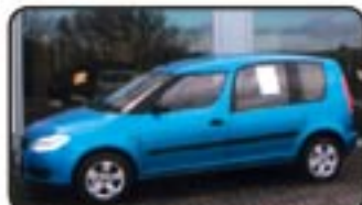
Skoda Roomster 1.2 12V HTP EZ 08/07, 20 km, 51 kW, Radio/CD, Alu, Airbags, Rückbank klappbar, ABS, ASR, Servo, ZV mit FB uvm. MwSt. awb. EURO 12.470,-