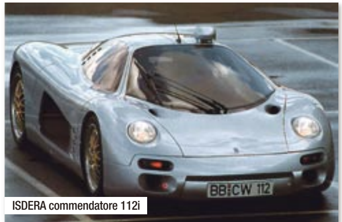
ISDERA commendatore 112i

Der erste Wurf unter dem Namen ISDERA wurde der spyder 036i, ein kompromissloser Roadster ohne richtige Windschutzscheibe und nur 970 kg schwer, von dem es im Original-Prospekt aus den 80er-Jahren heißt: „Wind spüren, Regen fühlen, PS hören, Kraft erleben: Leben.“ 17 Käufer wollten Leben und erstanden den 231 PS starken spyder, der in 6,4 Sekunden auf 100 km/h beschleunigte. Immerhin 30 Käufer fand dann der imperator 108i, ein rassiger Gran Turismo mit Flügeltüren, Mercedes-Benz V8-Mittelmotor und einer Spitzengeschwindigkeit von 292 km/h. „Meine Kunden waren keine Aufschneider!“ betont Eberhard Schulz. Anders als viele Ferrari-Käu-