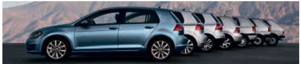
Die berühmteste C-Säule der Welt: Alle sieben Generationen des Golf.

schnittsverbrauch von 3,2 Litern Diesel auf 100 km Maßstäbe. Mit 4.255 mm wurde der neue Golf gegenüber seinem Vorgänger um 56 mm länger; der Radstand wuchs analog um 59 mm auf nun 2.637 mm. Parallel wurde die Karosserie um 28 mm flacher