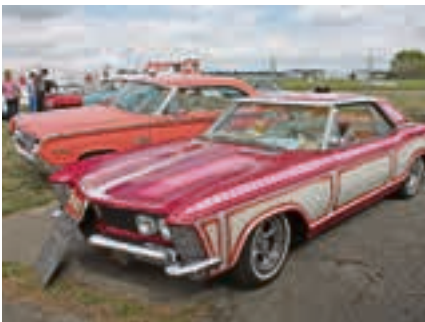
Echtes altes „Chicano-Gangster-Auto“: Buick Riviera in extrem auffälliger und aufwendiger Lackierung.