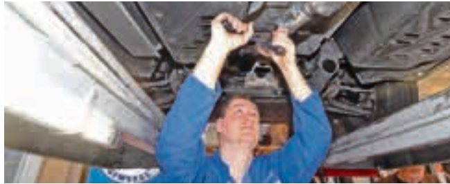
Auch 2013 fördert der Staat den Einbau von Rußpartikelfiltern.

Wer sich also für den Filtereinbau entscheidet, sollte dies noch in diesem Jahr tun, rät der Zentralverband Deutsches Kraftfahrzeuggewerbe (ZDK). Neben dem finanziellen Bonus von 330 Euro winken je nach Wirkungsgrad des