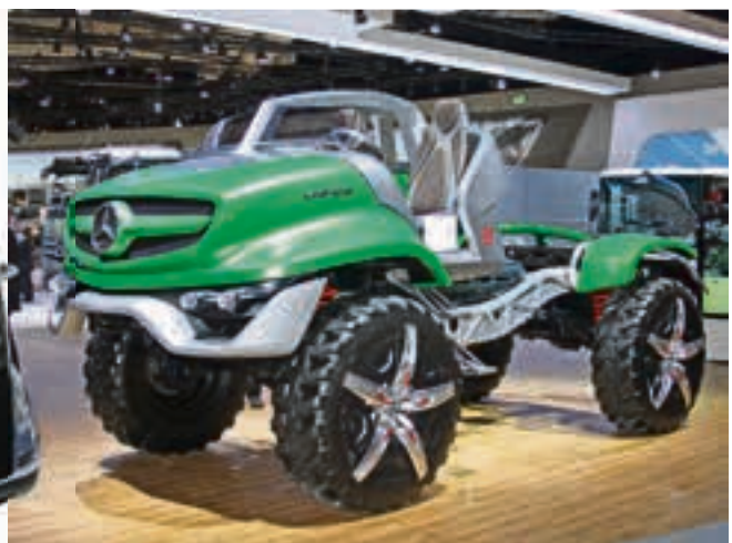
Mit dieser futuristischen Designspielerei gibt Mercedes einen Ausblick auf die neue Euro 6 Generation des Unimog ab 2014.