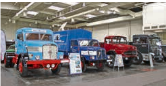
Ob IFA, Mercedes, Büssing oder andere: Freunde historischer Nutzfahrzeuge kamen auf der IAA ebenfalls auf ihre Kosten.