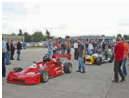
Rennautos zum Anfassen: die Boliden vor dem Start.