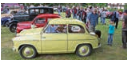
Schauen, fachsimpeln, in Erinnerungen schwelgen: Oldtimer der unterschiedlichsten Klassen und Jahrgänge – wie dieser Lloyd – standen auf dem Gelände des FKK Sportparks.

allel stattfindenden Ambergauer Feldtagen ihr Können, bei echter Feldarbeit. Eine Kombination, die auch in zwei Jahren wieder geplant ist, „der Erfolg motiviert uns, weiter zu machen!“