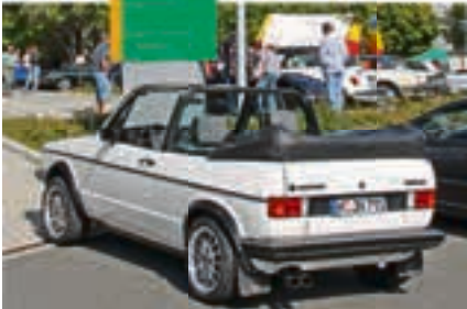
Auch Youngtimer wie das „Erdbeerkörbchen“ Golf Cabrio waren willkommen.