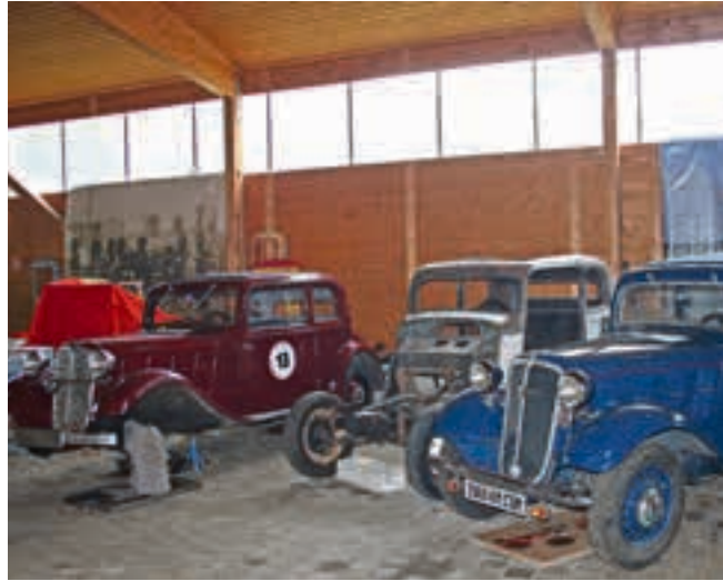
Das Domizil der HANOMAG IG in Störy.

Seither hat sich HILDESHEIMmobil prima entwickelt und mit einer spannenden Redaktion ein breites Publikum gewonnen. Dabei auch