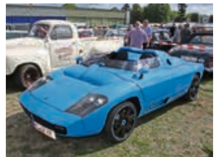
„Made in Hildesheim“: ein wiederbelebter ISDE-RA Spyder 036i – einer von insgesamt nur 17 gebauten.