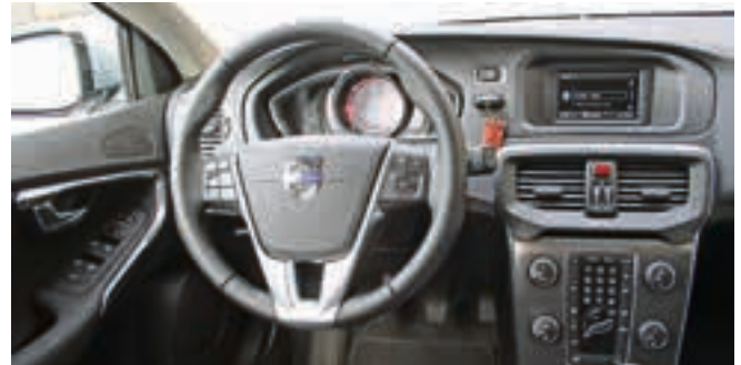
Die Gestaltung des Interieurs ist angenehm nordisch kühl und wirkt dabei sehr hochwertig. Nettes Gimmick: der beleuchtete Schaltknopf.

Auswahl stehen hier drei Anzeigevarianten: Elegance, Eco und Performance. Bei der Elegance-Variante ist der Tachometer mit klassischen Skalen in dezenten Brauntönen dargestellt. Wählt man Performance, erscheint anstelle der Tachoskala ein Drehzahlmesser auf dem TFT Display, die Geschwindigkeit steht mittig. Na, da wollen wir doch mal sehen, wie hoch wir den Volvo jubeln können. Hinter dem wohlgeformten Kühlergrill arbeitet der 115 PS Diesel des D2 – auf dem Papier nicht gerade ein Ausbund an Spritzigkeit: 12,3 Sekunden braucht er bis 100 km/h und erreicht 190. Aber, erstaunlich, während der ganzen Testfahrt habe ich mich nie untermotorisiert gefühlt. 270 Nm Drehmoment sorgen dafür, dass man immer ge-