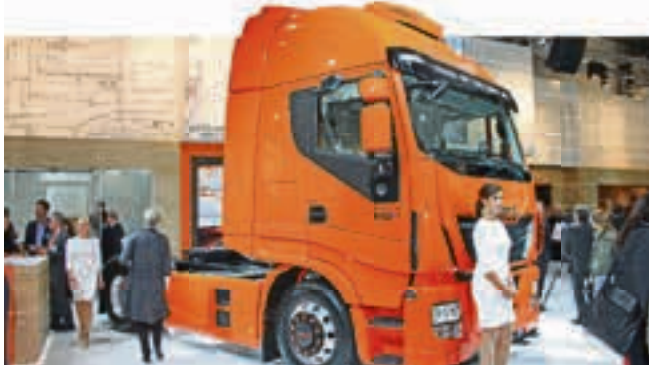
IVECOS Flaggschiff Stralis Hi-Way wurde am Vorabend der IAA von einer Fachjury zum „International Truck of The Year 2013“ gewählt, unter anderem aufgrund seiner Kraftstoffeffizienz und der Erreichung der Abgasnorm Euro 6.