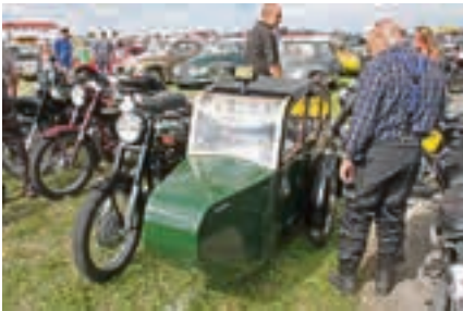
Taxi mal anders...

Die Mischung macht's: die Kombination aus Oldtimertreffen, Teilemarkt und packender Rennaction lockte auch in diesem Jahr wieder zahlreiche Besucher zur Technorama auf dem Hildesheimer Flughafen, genauer: 12.000 – so viel wie nie zuvor! Dazu kamen etwa 2.000 Old- und Youngtimer an den beiden Veranstaltungstagen auf's Gelände, 300 Aussteller versorgten Suchende mit Teilen und Automobilia und über 200 Rennfahrer lieferten sich in den unterschiedlichsten Klassen heiße Rennen auf der Piste.