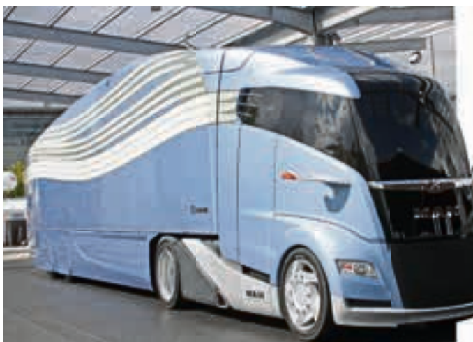
Soll bis zu 25 % Kraftstoff sparen: die MAN LKW-Studie Concepts S in Verbindung mit dem Krone Trailer AeroLiner.