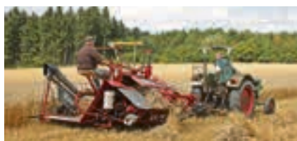
Feldarbeit wie damals: bei den Ambergauer Feldtagen konnte man historisches Ackergerät im Einsatz beobachten.