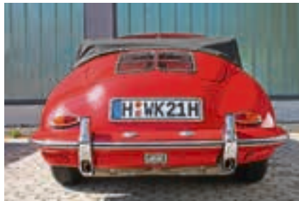
Ein schöner Rücken kann entzücken: Heckansicht eines Porsche 356 Cabrio.