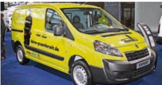
Peugeot bietet beim neuen Expert besonders günstige Tarife für Existenzgründer an.