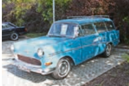
Seltener Anblick: Opel Olympia Rekord Caravan von 1959.