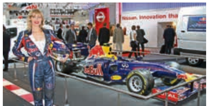
Ja, das ist der echte Formel 1 Rennwagen von Sebastian Vettel (Vorjahresmodell) und ja, das ist tatsächlich auch sein echter Rennanzug ...!