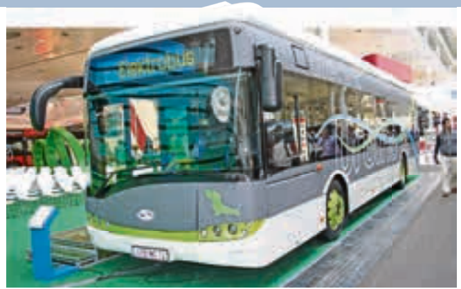
Nicht nur die Straßenbahn, auch die Stadtbusse können in Zukunft elektrisch fahren – ganz ohne Oberleitung.