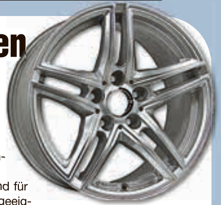
Borbet Design XR brilliant silver.