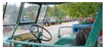
Wenn die Oldtimer IG Volkersheim einlädt, kommen vor allem die Trecker: Von Lanz Bulldog über Porsche Diesel bis hin zu Kramer und Hanomag waren alle vertreten.