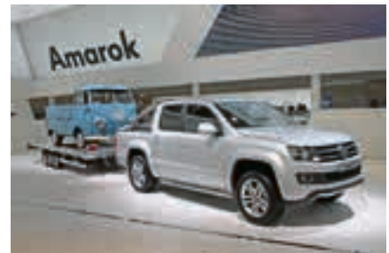
Jung zieht alt: der VW Amarok mit einem Bulli T1 im Schlepptau.