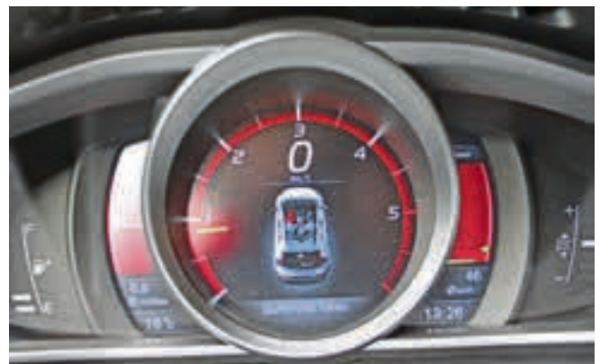
Hingucker: der Digitaltacho in der Performance-Variante.

Und sollte so nicht nur die Individualisten unter den Kompaktwagenkäufern ansprechen.