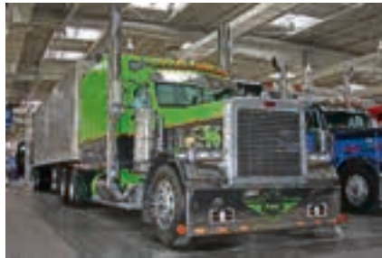
Sonderschau Amerikanische Trucks: hier ein Peterbilt Sattelzug von 2005 mit 15 Litern Hubraum und 550 PS.