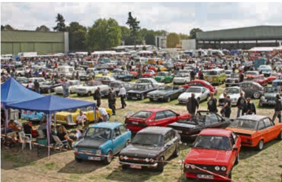
Oldies, soweit das Auge reicht: Die Technorama konnte wieder einen Besucherrekord verzeichnen.