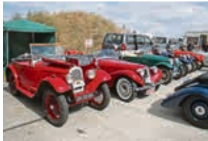
Die Aero IG kümmert sich um den Erhalt der fast in Vergessenheit geratenen Marke aus Prag.