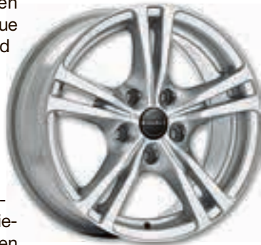
Borbet Design XLB crystal silver.