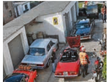
Platz ist in der kleinsten Hütte: bis zu 50 Oldtimer trafen sich zum Stelldichein auf dem Privatgelände von Thomas Lietzmann.