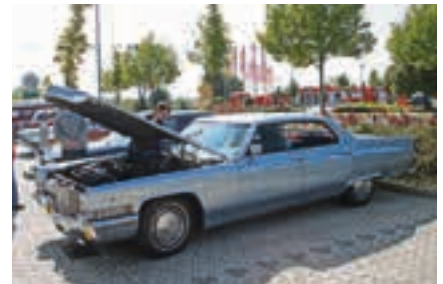
Länge läuft: Cadillac Sedan de Ville, mit 7,7 Liter V8 und einer Gesamtlänge von 5,68 Metern.