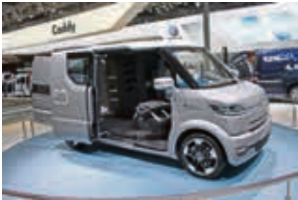
Bullis Nachfolger? Volkswagen zeigte mit der Studie eT einen rein elektrisch betriebenen City-Transporter.

HILDESHEIMmobil war für Sie auf dem Hannoverschen Messegelände unterwegs, um die interessantesten Neuheiten zu sammeln: