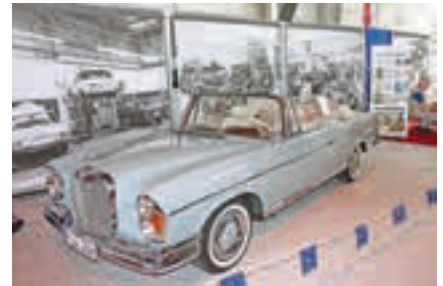
Glänzend in Schuss: 1963er Mercedes-Benz 220 Seb Cabrio vom Mercedes Veteranen Club.