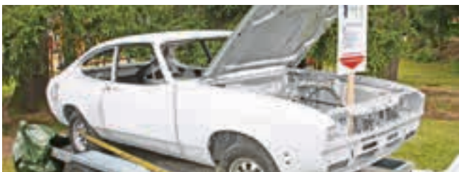
Ein Projekt für lange Winterabende: Ford Capri von 1978 als Bausatz.