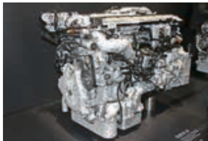
Kraftpaket: Dieser MAN-Motor holt aus enormen 12.419 ccm Hubraum 480 PS und satte 2.300 Nm Drehmoment.