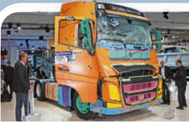
Auch beim LKW-Bau legt Volvo großen Wert auf Sicherheit: diese gecrashte Sattelzugmaschine zeigt im Innenraum kaum Beeinträchtigungen.