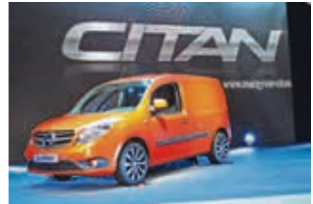
Mit dem Citan bietet Mercedes einen Stadtlieferwagen mit bis zu 3,8 Kubikmetern Laderaum und einem niedrigen Verbrauch von 4,3 Litern Diesel auf 100 Kilometern an.