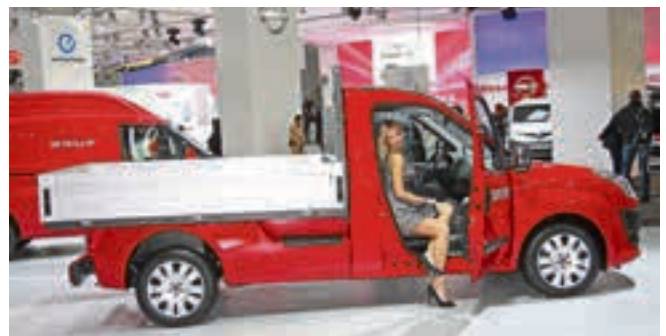
Neuheit: der Pickup Fiat Doblò Cargo Work Up will mit einer Ladefläche von rund vier Quadratmetern, einer Nutzlast von einer Tonne und klappbaren Bordwänden punkten.