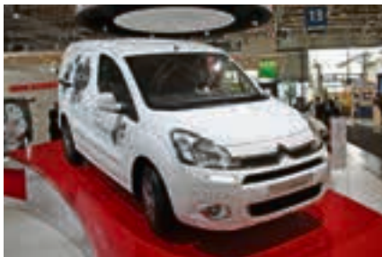
Weltpremiere in Hannover: der Citroën Berlingo Electric mit einem Ladevolumen von 4,1 Kubikmetern und einer Reichweite von 170 Kilometern.