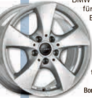
Borbet Design TB brilliant silver.