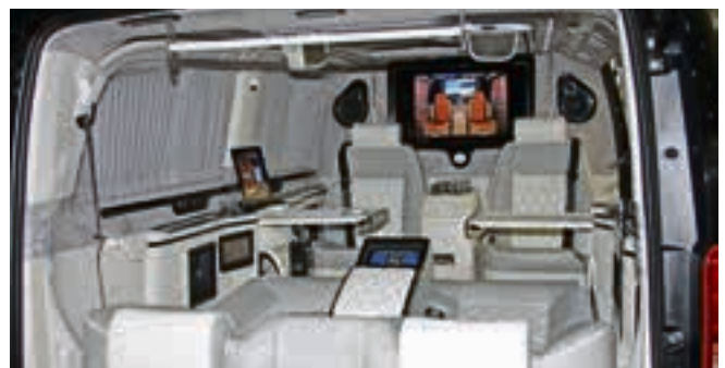
Doch, auch das ist mal ein Nutzfahrzeug gewesen: die Firma Klassen aus Minden hat diesen Mercedes Vito zum Luxusgefährt veredelt.