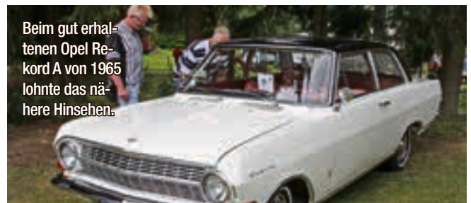
Beim gut erhaltenen Opel Rekord A von 1965 lohnte das nähere Hinsehen.