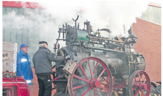
800 Liter Wasser lösen sich in Rauch auf: die Lokomobile von 1904 unter „Volldampf“.

Vorführung geladen. Dafür wurde eine von den Freunden historischer Fahrzeuge e.V. (FhF) aus Immensen bei Peine zur Verfügung gestellte Lokomobile von 1904 angeheizt. „800 Liter Wasser auf dem Kessel haben uns ein wenig Kopfschmerzen wegen der Witterung gemacht“, kommentiert Horst-Dieter Görg von der HANOMAG IG die Aktion. Aber nach langer Anlaufzeit stieg dann endlich der charakteristische weiß-graue Dampf aus dem langen Schornstein der von Ruston Proctor aus Lincoln in England gebauten Lokomobile. Und die Zuschauer wussten spätestens jetzt „wat ne Dampfmaschin is“!