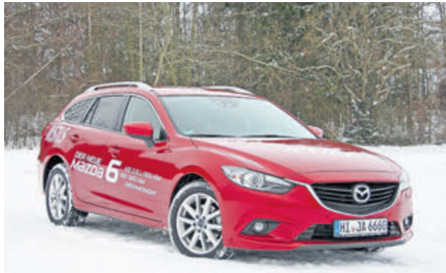
Rubinrotes Auto im Schnee: der neue Mazda6 ist nicht nur im Winter ein Hingucker.

Unter der von markanten Sicken eingefassten Motorhaube sorgt ein 2-Liter Benziner nicht eben für animalische Kraft, aber doch für zügiges Vorankommen. Das 165-PS-Aggregat zeichnet sich durch eine lineare Beschleunigung aus, nach 9,1 Sekunden ist der