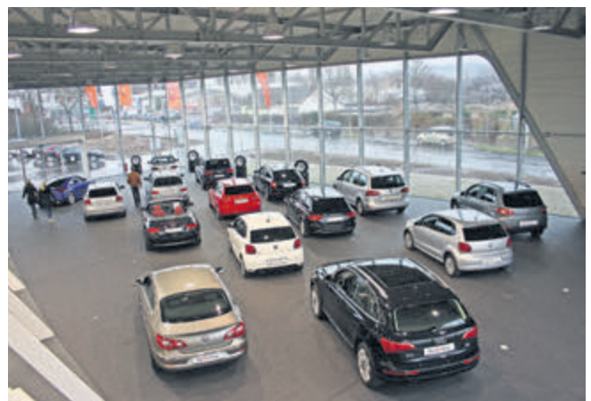
Von der Empore im Blick: die „Highlights“ unter den Gebrauchten – und die beiden Kühl Autohäuser für VW und Skoda schräg gegenüber auf der anderen Straßenseite.