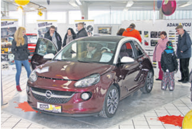
Der ADAM ist auf 3,70 Metern Länge ein echter Lifestyle-Flitzer.