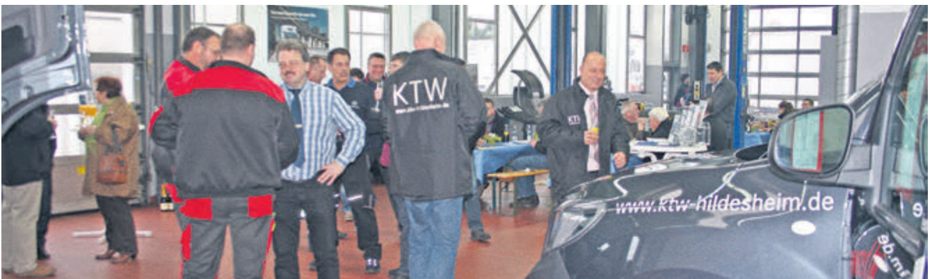
Bei Currywurst und Champagner kam man beim KTW-Neujahrsempfang ins Gespräch.