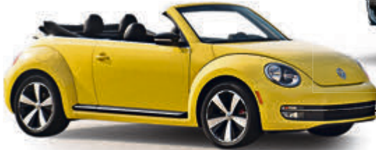
VW Beetle Cabrio