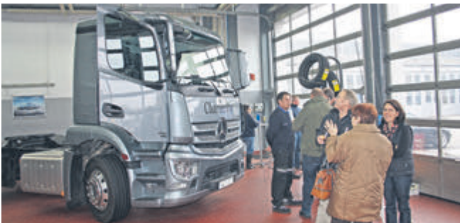
Kraftpaket: Der Mercedes Antos hat bis zu 510 PS unter der Haube.

der“ des Actros konzipiert, wird als Sattelzugmaschine und Pritschenwagen mit 67 verschiedenen Radständen geliefert. Für Power sorgen die neuen Euro-6-Norm erfüllenden Mercedes Reihensechszylinder Diesel mit 238 bis 510 PS. Beeindruckend. Gesprächsthema Nummer 1 auf dem KTW-Neujahrsempfang war jedoch – genau wie in der Tuning-Szene – der „aufgemotzte“ Citan. Weitere Infos dazu unter 05121-97300.