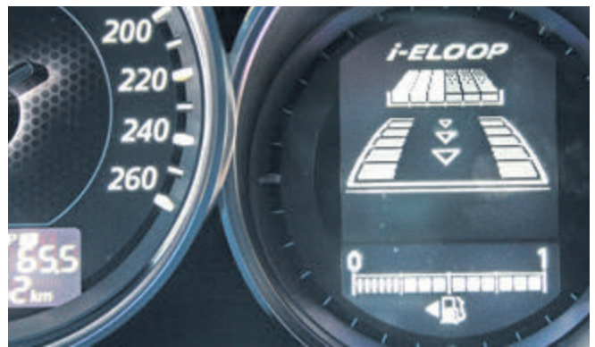
Alles fließt: ein Display im Armaturenbrett dokumentiert die Arbeit des Bremsenergieerückgewinnungssystems i-ELOOP.

Sparsamer Verbrauch dank moderner Effizienz-Technologie, zeitgemäße Assistenzsysteme, ansprechendes Interieur und jede Menge Platz: der neue Mazda6 macht in jeder Disziplin eine gute Figur. Und ist aufgrund seiner sportlich-dynamischen Formgebung ein echter Hingucker – nicht nur in Rubinrot.