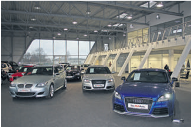
Die Architektur: Großzügig und mit eigene Akzenten. Die Stahlposten rechts im Bild sollen an eine Rennstrecken-Steilkurve erinnern.