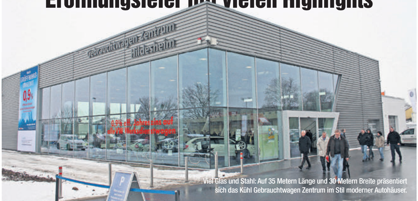
Viel Glas und Stahl: Auf 35 Metern Länge und 30 Metern Breite präsentiert sich das Kühl Gebrauchtwagen Zentrum im Stil moderner Autohäuser.