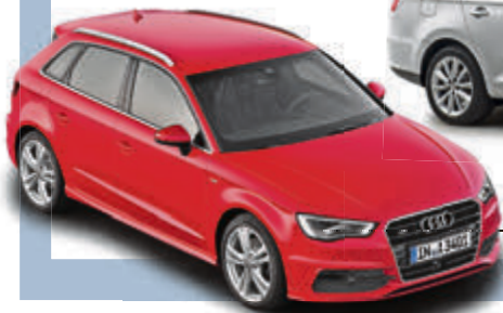
Audi A3 Sportback