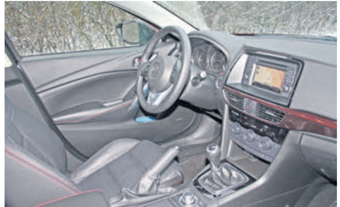
Klassisch, gradlinig und gut verarbeitet: das Cockpit kann sich sehen lassen. Der Touchscreen zeigt die Bilder der optionalen Rückfahrkamera sowie die Navi- und Entertainment-Funktionen.

Gepäckraumabdeckung spendiert und Hebel zum Umlegen der Rücksitzlehnen vom Kofferraum aus.