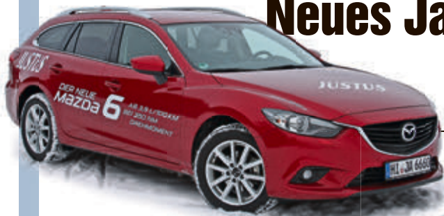
Im Test: Mazda6