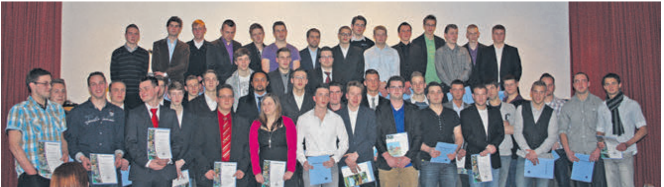
Gruppenbild mit Dame: 46 Kfz-Mechatroniker haben Ende Januar im Relexa ihre Gesellenbriefe erhalten.