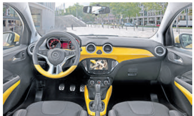
Das Cockpit des ADAM mit vielen Individualisierungsmöglichkeiten.

DÜRKOP GmbH, WWW.DUERKOP.DE Filiale Hildesheim, Bavenstedter Str. 90, 31135 Hildesheim, Tel. 05121 20408-10 Filiale Alfeld, Limmerburg 5, 31061 Alfeld (Leine), Tel. 05181 40-33