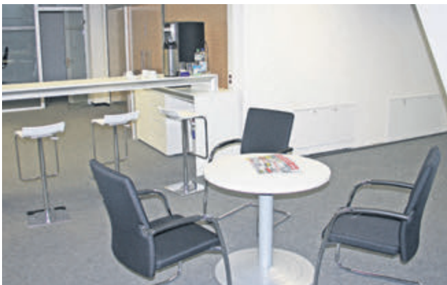
Lädt zum Verweilen ein: Sitzzecke mit Highend-Kaffeemaschine.