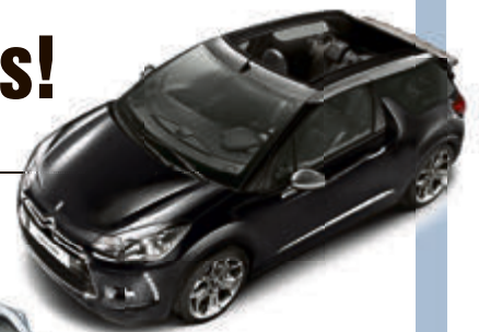
Citroen DS3 Cabrio