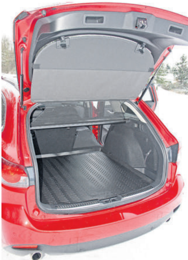
Der schafft was weg: Mit 522 bis 1664 Litern Volumen erfüllt der Gepäckraum auch die ausgefallensten Platzbedürfnisse. Praktisch: die Rücksitzlehnen lassen sich vom Kofferraum aus umklappen.

er dank Laufruhe und nied- rigem Innengeräusch für eine angenehme Reiseat- mosphäre. Und die zahl-