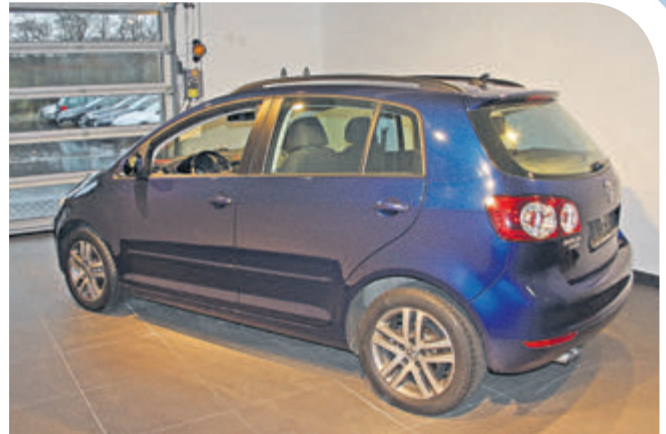
Ein Golf Plus wartet in der Auslieferungshalle auf seinen neuen Besitzer.