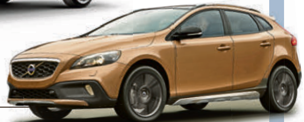
Volvo V40 Cross Country