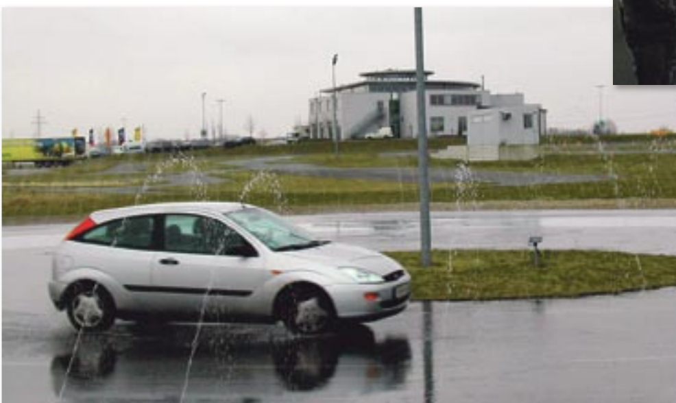
Kurvenhandling auf dem Kreisbahn-Modul

Zwischendurch erklärt er uns im Schulungsraum wie die elektronischen Helferlein im Auto funktionieren, warum der richtige Reifendruck