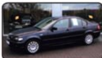
BMW 320d EZ 03/04, 113.000 km, 110 kW, SD, el. FH, Navig., Einparkhilfe, Sitzhg., Klimaautom., 4x Airbags uvm. EURO 14.470,-