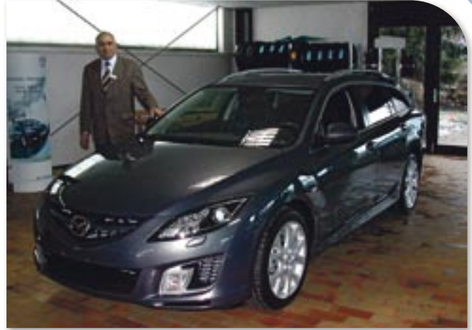
Premiere auf der Automeile: das Autohaus Justus zeigt die Kombivariante des neuen Mazda 6 hier erstmals einem breiten Publikum. Neben dem ansprechenden Äußeren, dem qualitativ überzeugenden Interieur und den kräftigen Motoren, punktet der Kombi außerdem mit jeder Menge Platz.

Auch die Erwachsenen können Fahrerlebnisse sammeln. Am Almstortunnel lädt das Autohaus Krumrey zur Peugeot Roadshow und bietet die Möglichkeiten, auf den neuesten Modellen des französischen Au-