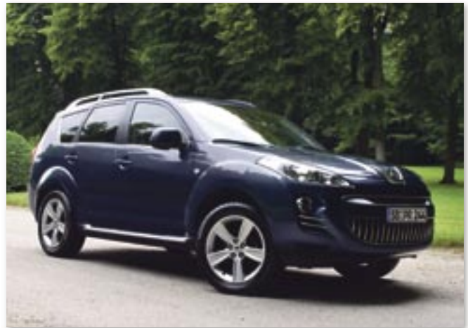
Als erster SUV der Marke Peugeot verspricht der 4007 Abenteuer im Alltag, ob auf oder abseits der Straße - dank ausgefeilter Allradtechnik kein Problem und mit Platz für bis zu 7 Personen. Das Autohaus Krumrey zeigt den kernigen Franzosen am Almstortunnel und lädt zur Probefahrt.