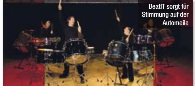
BeatIT sorgt für Stimmung auf der Automeile

Natürlich sind auch in diesem Jahr am Sonntag die Innenstadt-Geschäfte ge-