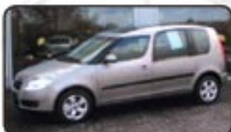
Skoda Roomster 1.6 16V Tiptronic EZ 08/07, 20 km, 77 kW, Climatronic, el. Spiegel, el. FH, Panoramadach, Einparkh., Sitzhg., Radio/CD/MP3 uvm. MwSt. awb. EURO 17.370,-