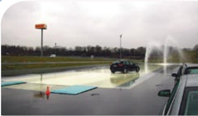
Die Hydraulikplatte sorgt für das Ausbrechen des Hecks

und die der Witterung angepasste Bereifung wichtig ist. Außerdem ist in der Kursgebühr ein Mittagessen vom kalt-warmen Buffet enthalten. Lecker, aber wir wollen wieder auf den Platz!