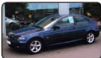
BMW 316 ti Compact EZ 09/04, 32.500 km, 85 kW, Alu, Schiebendach, Tempomat, Einparkhilfe, Sitzhg., CD-Wechsler, Glasdach uvm. EURO 15.470,-