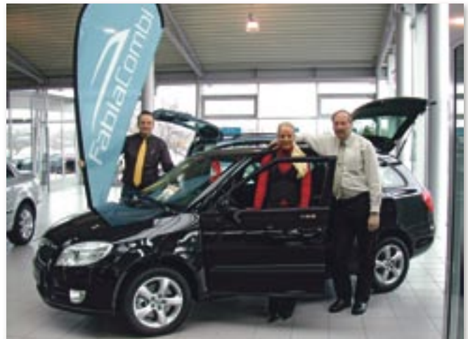
„Der neue Skoda Fabia transportiert Güter und gute Laune“, so der Slogan zum geräumigen Kompakten. Auf der Lilie informiert das freundliche Team vom Autohaus Kühl über dieses und alle anderen Modelle aus dem Hause Skoda, außerdem gibt es eine Bühne mit abwechslungsreicher Roadshow.