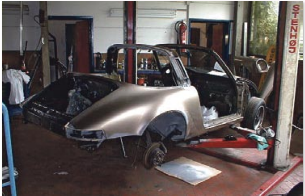
Der ehemals silber-goldene Targa wurde komplett zerlegt, blau lackiert und wieder aufgebaut

mir Fotos von jedem Arbeitsschritt gemacht, damit ich den Wagen hinterher auch wieder richtig zusammen bekomme!“ 2003 war der Targa dann fertig für die ersten Ausfahrten im Landkreis, „ein echter Genuss bei geöffnetem Dach!“ Als dann etwa 3 Jahre später ein Kunde mit einem 911er zu Jentz kam, um ihn durch den TÜV zu bekommen, wurde er erneut schwach: „Das Auto war so schrottig, da war alles Mögliche weggefault, der hat so keinen TÜV mehr bekommen, da habe ich ihm ein