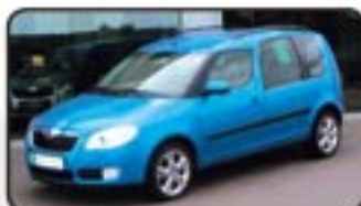
Skoda Roomster 1.9 TDI Comfort EZ 07/06, 8.600 km, 77 kW, Klimaautom., Einparkhilfe, Navig., Sitzhg., Tempomat, Alu, Metallik, el. FH uvm. MwSt. awb. EURO 16.470,-