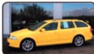
Skoda Octavia II Combi 2.0 TDI RS EZ 10/07, 13.000 km, 125 kW, Navig., CD-Wechsler, el. GSD, Sitzhg., Partikelfilter, Xenon, Klimaautom. uvm. MwSt. awb. EURO 27.970,-