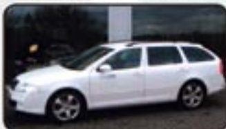
Skoda Octavia II Combi 2.0 TDI RS EZ 10/07, 19.852 km, 125 kW, Navig., CD-Wechsler, Tempomat, Sitzhg., Partikelfilter, Xenon, Klimaautom. uvm. MwSt. awb. EURO 27.470,-