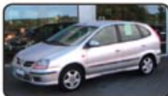
Nissan Almera Tino 2.2 Di Fresh EZ 06/03, 80.750 km, 84 kW, Leder, Alu, el. FH, Klima, CD-Wechsler, Airbags, Nebel uvm. MwSt. awb. EURO 7.970,-