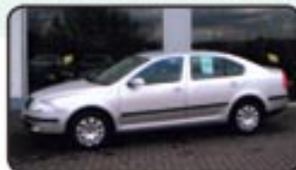
Skoda Octavia II 1.6 Ambiente EZ 11/06, 25.900 km, 75 kW, Klima, el. FH, el. Spiegel, BC, Einparkhilfe, Nebel, Airbags, ABS, ESP, Radio/CD uvm. MwSt. awb. EURO 12.970,-