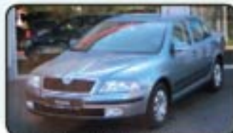
Skoda Octavia II 2.0 FSI Ambiente EZ 11/06, 2.000 km, 110 kW, Klimaautom., Einparkhilfe, Radio, Airbags, ABS, ESP, ZV, el. FH, ASR, 6-Gang uvm. MwSt. awb. EURO 16.870,-