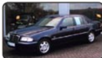
Mercedes-Benz C 220 CDI Elegance EZ 08/00, 130.560 km, 92 kW, AHK, el. FH, Einparkhilfe, Klimaautom., Servo, Regensensor, ASR, AHK abr. uvm. EURO 10.970,-