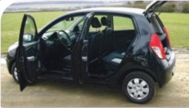
Platz ist in der kleinsten Hütte: die 4 Türen erleichtern den Zustieg.

zen Radstandes holpert er über schlechte Straßen und wegen der winzigen Räder (13-Zöller mit 155/70er Bereifung) sind keine raschen Kurvenumrundungen anzuraten, zumal es in der Benziner-Version auch gegen Aufpreis kein ESP gibt. Die 13-Zöller gehören übrigens zu der getesteten Ausführung Classic E. Das E steht dabei für Economic und die schmalen Räder tragen dazu bei, dass der kleine Koreaner nur oben erwähnte 5 Liter auf 100 Kilometern verbraucht und damit gerade mal 119 g CO 2 je Kilometer emittiert. Und nicht nur hier zeigt sich der i10 als Sparfuchs, auch der Preis ist heiß: für 9.990 Euro wechselt der City-Flitzer den Besitzer.