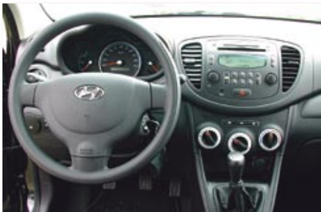
Hier lenkt nicht viel vom Fahren ab: ergonomisches Cockpit mit ordentlicher Verarbeitung.

Verlässt man mit dem i10 sein Revier und startet zur Überlandfahrt, merkt man doch, dass es eben ein Kleinwagen ist. Aufgrund des kur-