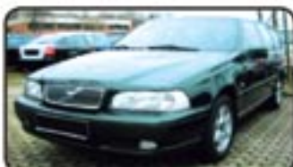
Volvo V70 2.5 TDI Automatik EZ 03/00, 129.000 km, 103 kW, AHK, ZV, el. FH, Airbags, Servo, el. Spiegel, Rückbank klappbar, Nebel uvm. EURO 9.970,-