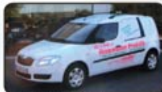
Skoda Praktik 1.4 16V EZ 07/07, 10.000 km, 63 kW, Klima, Radio beta, Airbags, ABS, ESP, Servo, ZV mit FB, ASR uvm. MwSt. awb. EURO 11.970,-