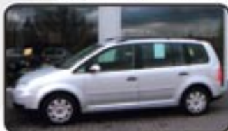
VW Touran 1.6 Trendline EZ 03/05, 46.850 km, 75 kW, ZV, el. FH, Tempomat, Klima, 1. Hand, MAL, el. Spiegel, Nebel uvm. EURO 14.470,-