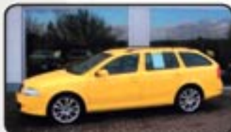
Skoda Octavia II Combi 2.0 TDI RS EZ 04/07, 14.750 km, 125 kW, Navig., CD-Wechsler, el. GSD, Sitzhg., Partikelfilter, Xenon, Klimaautom. uvm. MwSt. awb. EURO 23.690,-