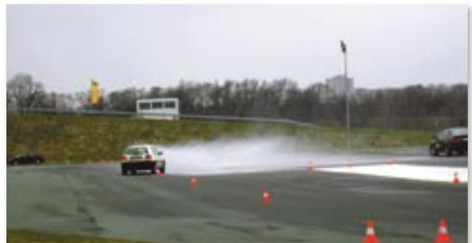
Beim Slalom lernt man das Fahrverhalten des eigenen Fahrzeugs kennen