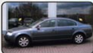
Skoda Superb 2.0 TDI DPF Comfort EZ 09/07, 6.000 km, 103 kW, Leder, Sitzhg., Bi-Xenon, Klimaautom., Tempomat, Alu 17", Radio/CD uvm. MwSt. awb. EURO 21.990,-