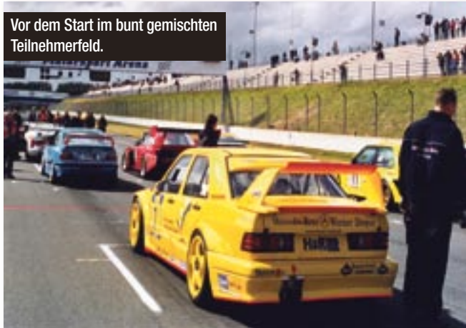
Vor dem Start im bunt gemischten Teilnehmerfeld.

bis 15.000 Euro, wenn man Vorne mitfahren möchte. Das hat er dann auch geschafft, im ersten Jahr reichte es gleich zum 2. Platz in seiner Klasse und zum 7. Platz gesamt. Mit dem gelben Mercedes 190E EVO II von der