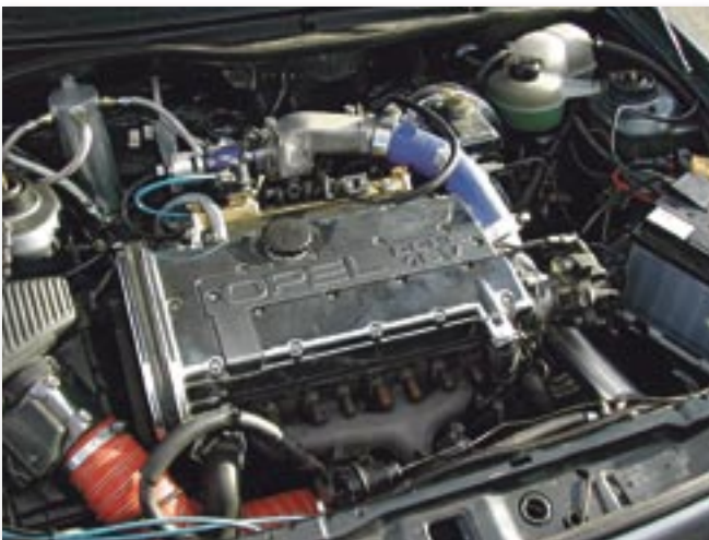
Kraftpaket: der modifizierte Turbomotor leistet über 400 PS und hat ein Drehmoment von 550 Nm