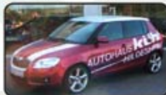
Skoda Fabia II 1.9 TDI DPF Elegance EZ 05/07, 8.000 km, 77 kW, Klimaautom., Radio/CD/MP3, Sitzhg., Tempomat, Alu 17", Sportfahrwerk uvm. MwSt. awb. EURO 17.970,-