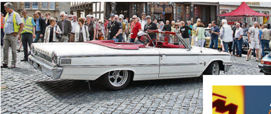
Ankunft in Hildesheims „guter Stube“: Ford Galaxie aus den 60er Jahren.