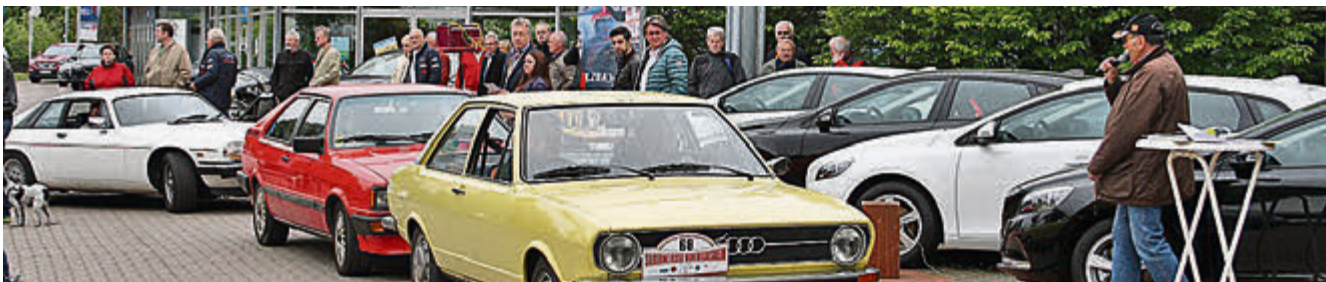
Zielankunft der Teilnehmer beim Autohaus Hentschel, begleitet mit fachkundiger Fahrzeugvorstellung. Im Vordergrund ein Audi 80 aus dem Jahr 1974.