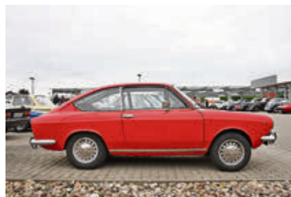
Mini-Sportler: Fiat 850 Sport Coupé mit rasanten 52 PS.