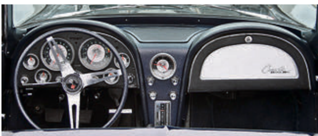
Beim Cockpit-Bau der Chevrolet Corvette Stingray wurde Symmetrie groß geschrieben.