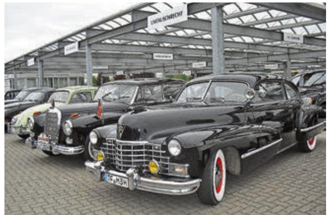
Cooler Coupé: Zweitürer der Cadillac Series 62 von 1942.