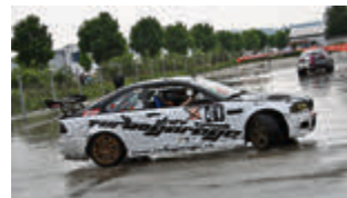
Mit quietschenden Reifen quer um die Pylonen: ein gewässerter Parcour sorgte bei der Drift-Show dafür, dass die Räder nicht ganz so schnell verschlissen. Mutige Zuschauer mit stabilem Magen durften auf dem Beifahrersitz mitfahren.