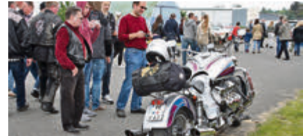
Fetter geht's nicht: Monsterbike von Boss Hoss mit 8,2 Liter V8 Big Block und 502 PS.