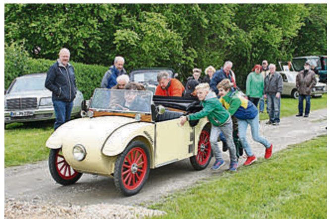
Schiebung: mit vereinten Kräften wurde das Hanomag Kommissbrot zum Laufen gebracht – sehr zur Freude der umstehenden Zuschauer.