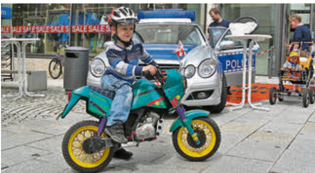
Alle Risikogruppen werden während des 10. Tages der Verkehrssicherheit angesprochen.

BITTE BEACHTEN: Samstag den 28.6.14 und Freitag + Samstag den 11. + 12.7.14 bleibt unser Geschäft geschlossen