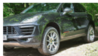
Die Luftfederung mit Niveauregulierung hebt den Macan auf geländetaugliche 230 Millimeter Bodenfreiheit.