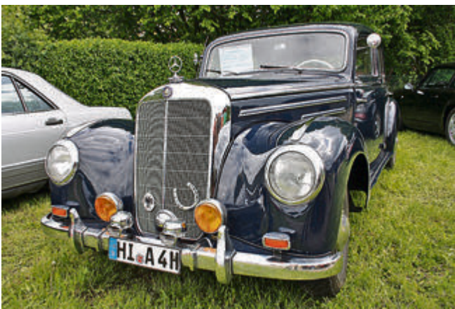
Zu verkaufen: dieser schucke, vollrestaurierte Mercedes 220 sucht einen neuen Besitzer.

Metern „Schiebung“ ertönte endlich das charakteristische „Pötpöt“ des Einzylinder-Viertakters, sehr zur Freude der umstehenden Besucher, von denen einer das abgewandelte Galilei-Zitat ausrief „... und er bewegt sich doch!“