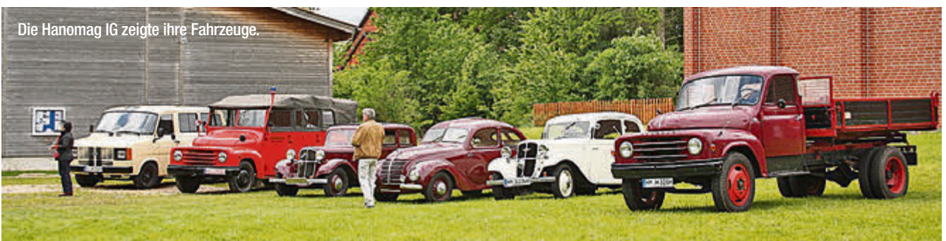
Die Hanomag IG zeigte ihre Fahrzeuge.