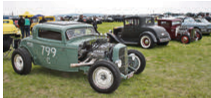
Die beliebten Hot Rods durften natürlich nicht fehlen.