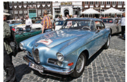
Kostete Ende der 50er Jahre etwa den halben Preis eines Reihenhauses: BMW 503, designed von Albert Graf von Goertz aus Brunkensen bei Alfeld. Unter der formschönen Haube arbeitet ein V8 mit 140 PS.