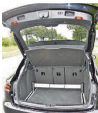
Ausreichend groß und variabel: das Gepäckabteil fasst 500 bis 1500 Liter.