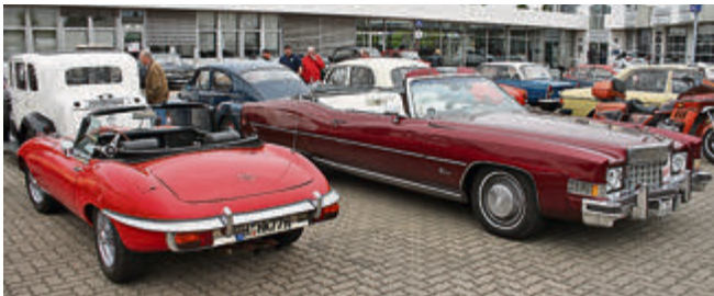
So unterschiedlich kann man offen fahren: knapper englischer Roadster Jaguar E-Type und ausladender Ami Cadillac Eldorado.