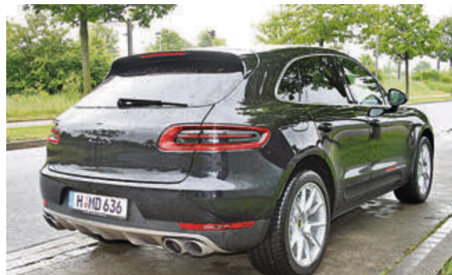
Ansprechendes Heck mit coolem Rücklichtdesign.

Genau wie die Tatsache, dass das Zündschloss links vom Lenkrad sitzt. Eine Drehung und der 3-Liter V6 Turbodiesel erwacht zum Leben. Wie lebhaft er ist, zeigt er nach dem beherzten Tritt aufs Gaspedal: druckvoll prescht der Macan nach