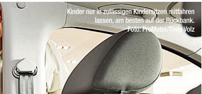
Kinder nur in zulässigen Kindersitzen mitfahren lassen, am besten auf der Rückbank.