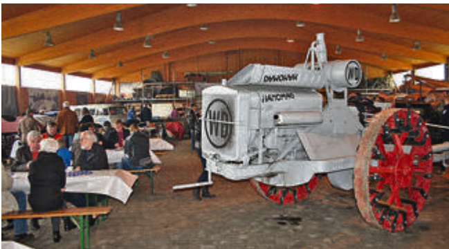
Zwischen Hanomag-Altmetall, wie diesem aus Südafrika zurückgeholten WD-Motortragpflug, konnten die Besucher lecker speisen und dabei ausführliche Benzingspräche führen.