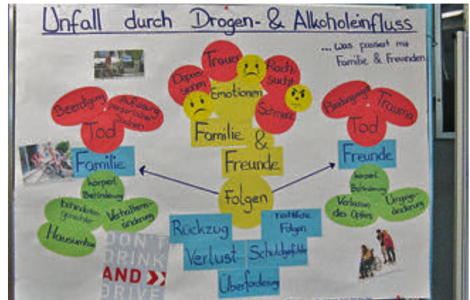
Arbeitsergebnis BBS Alfeld (BGW 2 a) zur Thematik „Verkehrsunfallprävention“

Am Samstag, dem 21.06.2014, werden in der Hildesheimer Innenstadt, direkt vor der Innenstadtwache, Angehörige der Hildeshei-