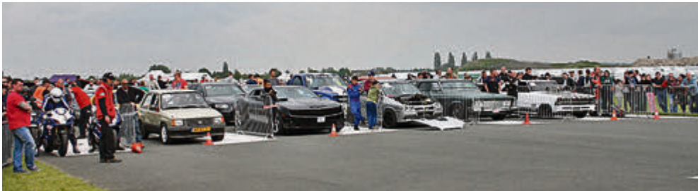
Warten auf den Start. Beim Viertelmeilenrennen war von Opel Corsa bis zum Ami-Dragester alles dabei.