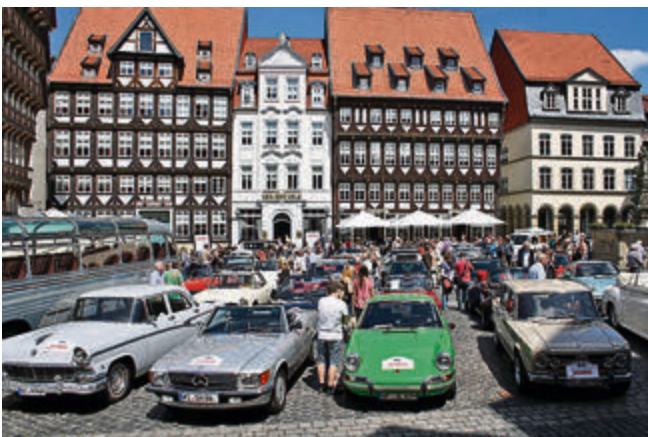
Parkplatz auf dem Marktplatz: während die Rallye-Teilnehmer den Drivers Lunch im Van der Valk genossen, hatten die Zuschauer ausgiebig Zeit, die Autos zu betrachten.