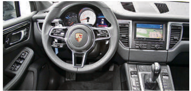
Typisch Porsche: das Cockpit mit aufsteigender Mittelkonsole, zentralem Drehzahlmesser – sowie makelloser Verarbeitung.

vorne, schafft den Sprint auf 100 km/h in gerade mal 6,3 Sekunden und rennt bis zu 230 km/h schnell – nicht schlecht für ein immerhin fast zwei Tonnen schweres Auto. Vollkommen sein Gewicht verleugnen kann der Macan dann auf der kurvenreichen „Hausteststrecke“. Beide Hände ans Lenkrad, den Fuß aufs Gas und los! Das Porsche Doppelkupplungsgetriebe findet immer exakt die richtige Fahrstufe um die 258 PS und 580 Nm Drehmoment in rasanten Vortrieb umzusetzen, der Sportmodus des elektronischen Dämpfersystems lässt den Macan trotz seines höheren Schwerpunkts nahezu ohne Wankbewegungen um die Kurven flitzen und auch die direkte Lenkung gaukelt einem vor, in einem Sportwagen und nicht in einem SUV zu sitzen. Nur eins fehlt für die perfekte Illusion: der Motorsound. Der Diesel verrichtet