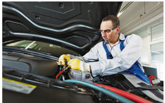
Klimaanlage - eine regelmäßige Wartung ist das A und O.