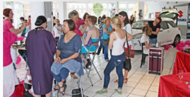
Beauty Trends bei Finke: wegen des großen Erfolges ist eine Wiederholung geplant.

und gesündigt werden konnte auch: die Firma Boemke lockte mit feinen belgischen Pralinen. Und, ja, Autos gab es natürlich auch zu sehen. Zum Beispiel das Jubiläumsmodell Suzuki Swift „30 Jahre“. Mit Zusatzausstattungen wie den schicken Alufelgen, LED-Tagfahrlicht, Sitzen und Lederlenkrad mit weißen Ziernähten, Tempomat und Metallic-Lackierung kann der Cityflitzer nicht nur bei der Damenwelt punkten. Erst recht bei dem Angebot, das das Autohaus Finke – seit knapp einem Jahr Suzuki-Händler – derzeit unterbreiten kann: „Statt für die UVP von 14.190 Euro bieten wir den 3-Türer als Finke-Hauspreis ab 12.490 Euro an“, verspricht Filialleiter Carsten Weitenkamp.