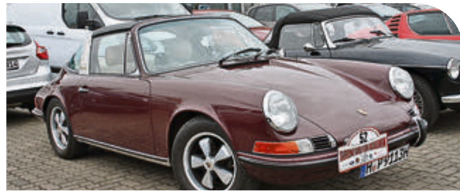
Von diesem Modell wurden nur 614 Stück gebaut: Porsche 911 S Targa aus dem Jahr 1969.