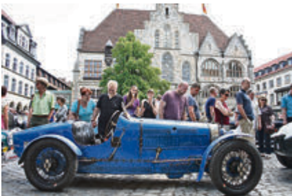
Rarer Racer mit außenliegendem Schalthebel: Bugatti Type 35.

ab 17 Uhr wieder im Autohaus Kühl einzulaufen. Viele Gelegenheiten also für Oldtimerfans, die betagten Vehikel in Aktion zu sehen - und dementsprechend begeistert fällt dann auch das Urteil einer Passantin auf dem Marktplatz aus: „So viele schöne Autos auf einem Fleck!“