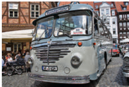
Der größte Rallye-Teilnehmer: Büssing Bus von 1961, mit einer Länge von gut 10 Metern, einer Höhe von 2,80 Metern und 40 Sitzplätzen.