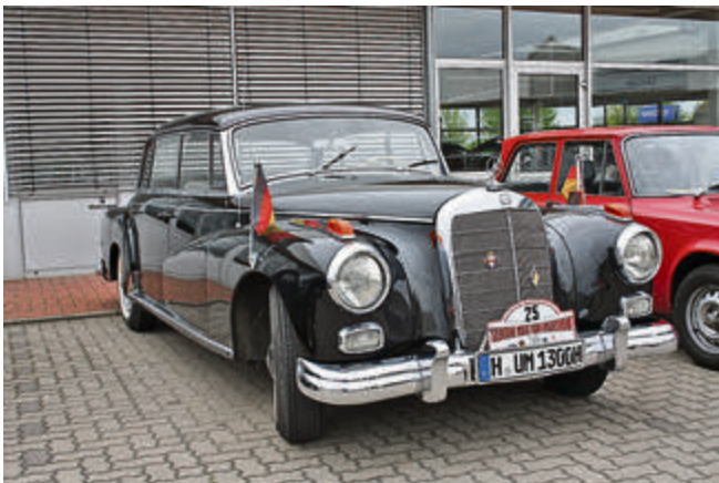
Er war seinerzeit das größte und schnellste Serienfahrzeug aus Deutschland – der Mercedes 300. Der Umstand, dass der Wagen vom damaligen Bundeskanzler als Dienstwagen genutzt wurde (und auch in anderen Ländern als Staatslimousine beliebt war) brachte ihm den Beinamen „Adenauer“ ein.

Hier einige Impressionen der teilnehmenden Schmuckstücke: