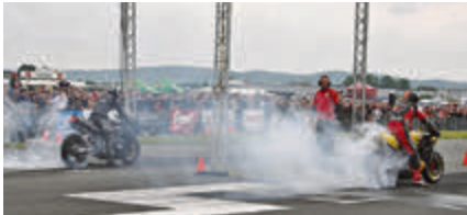
Vor dem Start wird bei den Bikes ordentlich Qualm erzeugt - um die Räder auf Temperatur zu bringen.