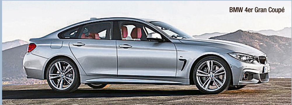
BMW 4er Gran Coupé

Kofferraumvolumen beträgt 480 bis 1.300 Liter und markiert bei den viertürigen Premium-Coupés den Klassenbestwert. Zur Markteinführung stehen fünf durchzugsstarke und verbrauchsgünstige Motoren zur Auswahl. Das Leistungsspektrum reicht von 143 PS im BMW 418d Gran Coupé bis zu 306 PS im 435i Gran Coupé.