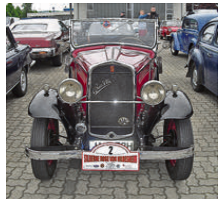
Das zweitälteste Auto im Teilnehmerfeld: Fiat 508 Balilla Spider aus dem Jahr 1932 – damals ein Wagen der unteren Mittelklasse.