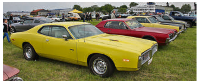
Das in Szenekreisen bekannte Magazin „Street Mag“ aus Hannover hatte im Rahmen von Hotwheelz Hildesheim zur Street Mag Show geladen – und ähnlich wie bei der Sommerveranstaltung auf dem hannoverschen Schützenplatz kamen auch zum Hildesheimer Flugplatz jede Menge cooler V8-Cruiser.