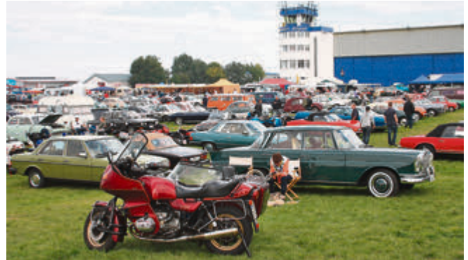
Die Technorama bietet Old- und Youngtimer, soweit das Auge reicht.