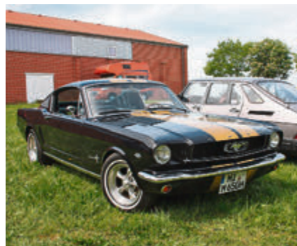
Auch einige Besucher kamen mit ihren Oldtimern, hier ein Ford Mustang Fastback.