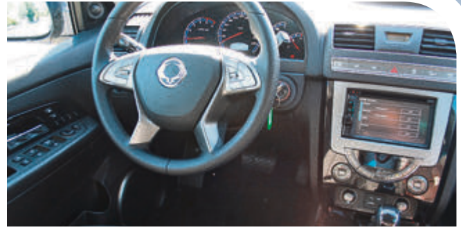
Im Sondermodell Executive gibt es unter anderem ein Kenwood-Navi.

Niedrig sind auch die Anschaffungspreise für den Rexton W: für den 2WD werden 27.190,- Euro aufgerufen, den Allrader gibt es ab 29.190,- Euro. Sparfüchse aufgepasst: derzeit bietet das Autohaus Justus (noch bis zum 30. September 2016) auf alle SsangYong Modelle wie den dynamischen Korando, den kom-