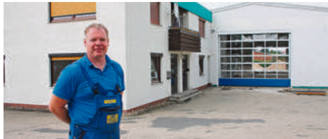
Auf 450 Quadratmetern bietet die neue Werkstatthalle genügend Platz für sieben Hebebühnen, die neue 3D-Achsvermessung und das komplette Equipment einer modernen Kfz-Meisterwerkstatt.

„Wir hoffen, ab Mitte August hier einziehen zu können“, so Thiem. „Und wir freuen uns, wenn viele alte – und auch gerne neue – Kunden mit uns kommen!“ Weit ist es ja nicht.