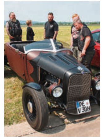
Verwegene Typen an verwegenen Karren.