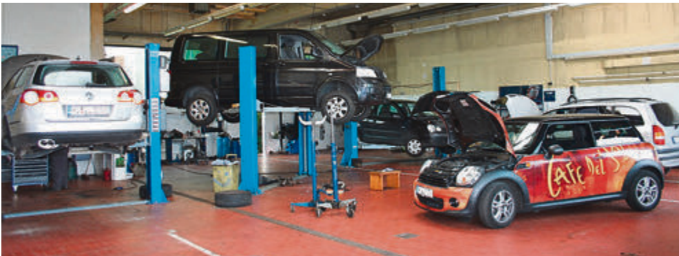
Die komplett ausgestattete Kfz-Meisterwerkstatt mit vier Hebebühnen.

Wer sich jetzt selber ein Bild vom neuen Hornburg-Betrieb machen möchte, ist jederzeit dazu eingeladen – ein schöner Anlass ist aber auch der 13. August: Dann findet die Eröffnungsveranstaltung statt, mit buntem Programm sowie einer Fahrradverlosung!