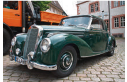
Schön und selten: Mercedes Benz 220 Coupé von 1954.