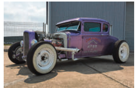
Hot, hotter, Hot Rod.