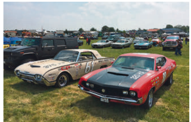
Zum US-Car-Treffen des Street Magazine tummelte sich allerlei V8-Getier auf der grünen Wiese.