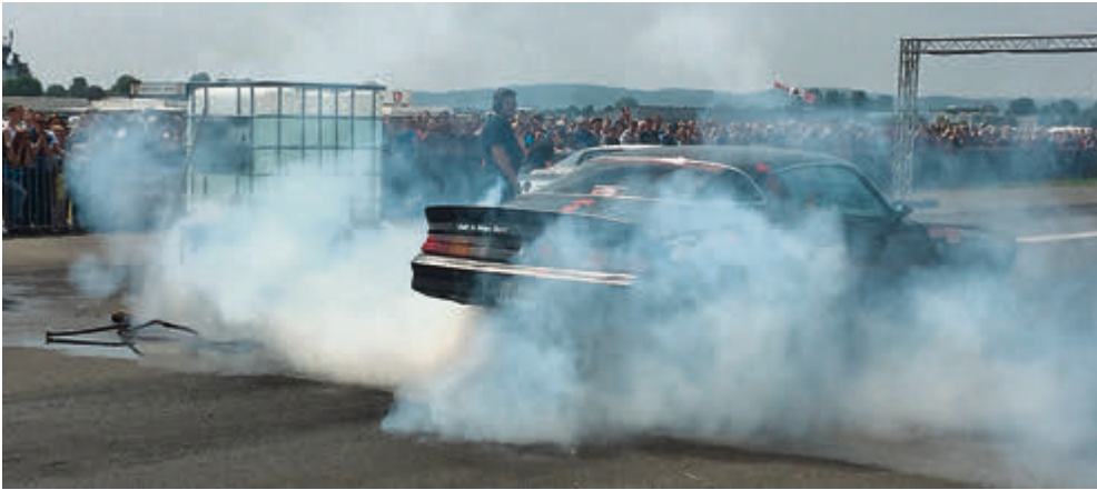
Rauchende Räder: vor dem Start zum 1/4-Meilen-Rennen werden die Reifen auf Temperatur gebracht.