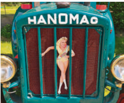
Hingucker: Die Veedol-Dame.