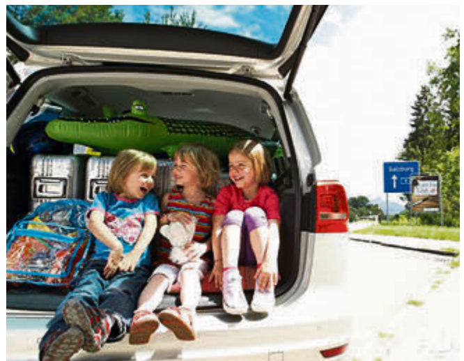
Auf Tour: Im Schatten Parken und vor der Weiterfahrt alle Türen auf – dann entweicht die Hitze schneller aus dem Auto.