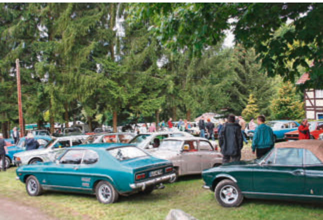
Die Old- und Youngtimer-Fans bekommen in Volkersheim wieder einiges zu sehen.