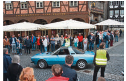
Ein Lancia Beta Spider macht sich unter den interessierten Augen der Zuschauer auf den Weg.