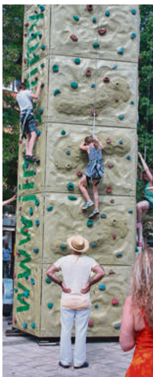
Hoch hinaus ging es am Kletterturm auf der Lilie.