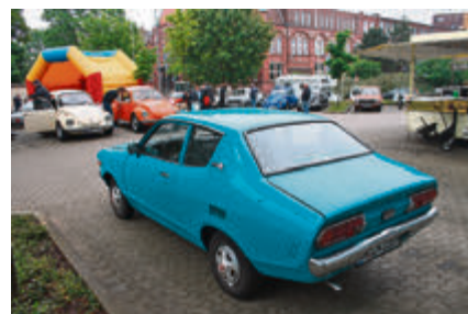
Trotz Regen kamen einige Oldtimerbesitzer mit ihren Fahrzeugen zur DEKRA Niederlassung Hannover. Im Vordergrund ein seltener Datsun 120Y.