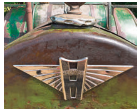
Der Hanomag Radschlepper AR 38 mit ordentlich Patina.