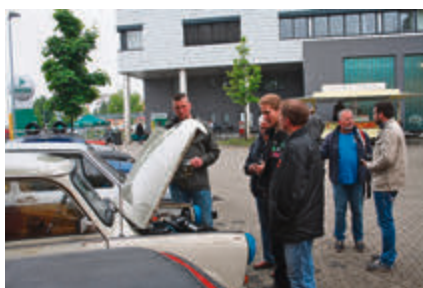
Fachsimpeln an der offenen Motorhaube eines Trabbis.