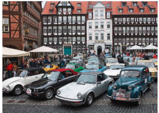
„Start your Engine“: Abfahrt zur 3. Etappe.