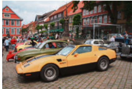
Exotischer Bricklin von 1975 aus Kanada. Mit 5,8 Liter 8-Zylinder, 250 PS, GFK-Karosserie und Flügeltüren.