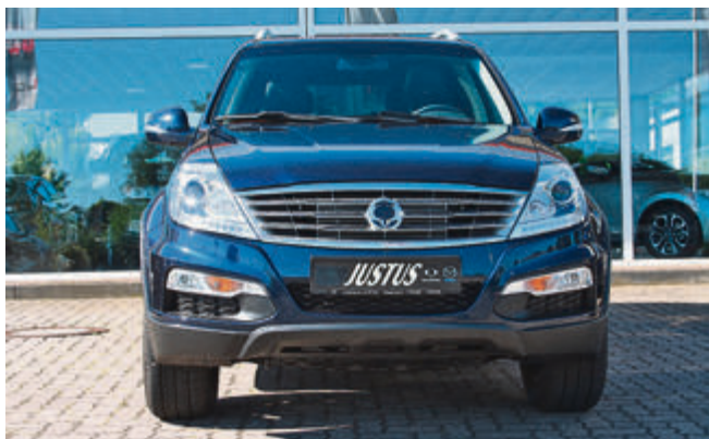
Hinter der bulligen Front des Rexton W arbeitet der neue 2,2-Liter-Dieselmotor mit 178 PS.