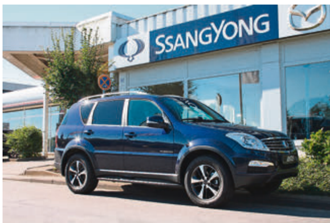
Der SsangYong Rexton W kann bis zu 3,5 Tonnen Anhängelast ziehen.

Daneben profitieren Kunden dank des neu entwickelten Dieselmotors auch von niedrigen Verbrauchs-