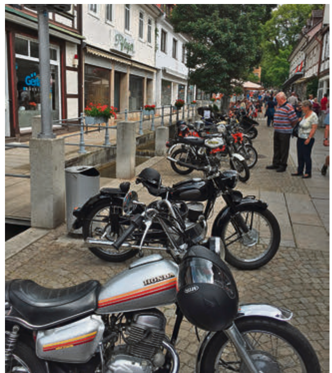
Auch die Zweiradfreunde kamen auf ihre Kosten.