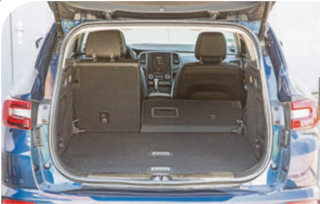
Der Kofferraum des Talisman Grandtour fasst 572 - 1681 qdm.

boden. Zusätzlich kann die Beifahrersitzlehne umgelegt werden, so dass sich im Mégane Grandtour Gegenstände bis zu 2,77 Meter Länge transportieren lassen. Der neue Mégane Grandtour verfügt, genau wie sein Schrägheck-Bruder, über eine Vielfalt an modernsten Technologien. Diese umfasst unter anderem das Head-up-Display im Cockpit, das Renault MULTI-SENSE zur individuellen Personalisierung von Fahrerlebnis und Innenraumambiente und das Online-Multimediasystem Renault R-LINK 2.