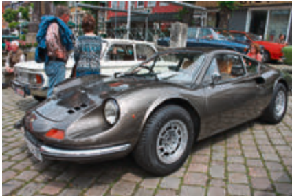
Gut erhaltener 1972er Ferrari Dino 246 GT mit 195 PS V6-Motor.