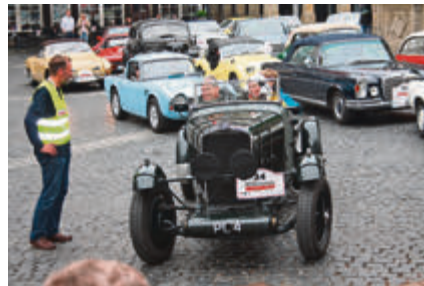
Gnadenlos offen – trotz ab und zu Regenwetter.