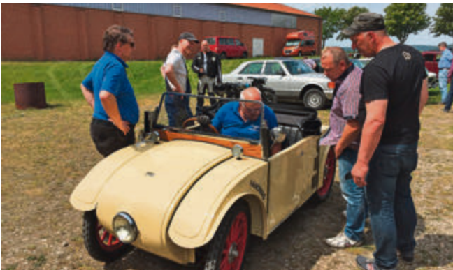
Das Kommißbrot bekam Auslauf – sehr zur Freude der Besucher.