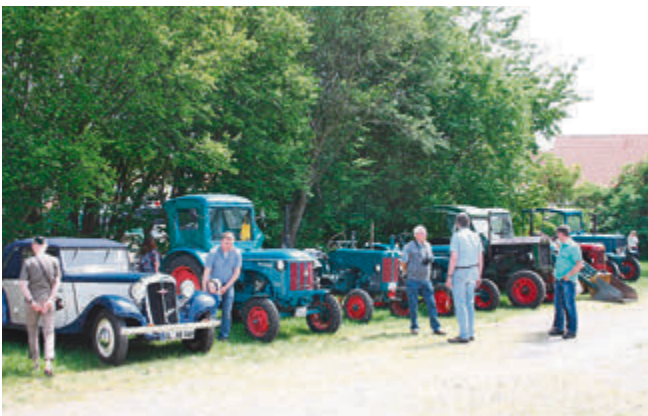
Auswahl an Hanomag Traktoren.