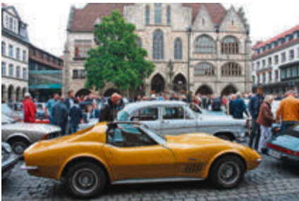
„Coke-Bottle-Design: Corvette Stingray.