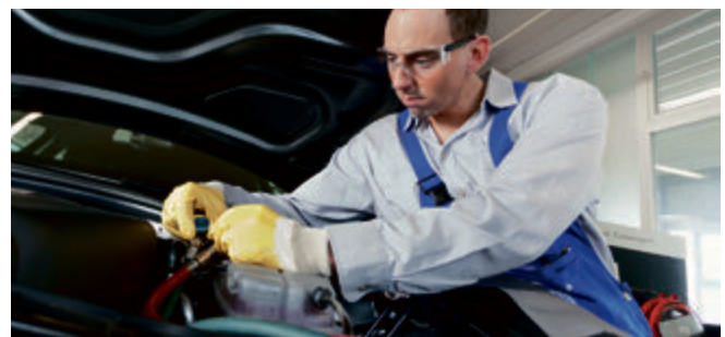
Klimaanlage - eine regelmäßige Wartung ist das A und O.