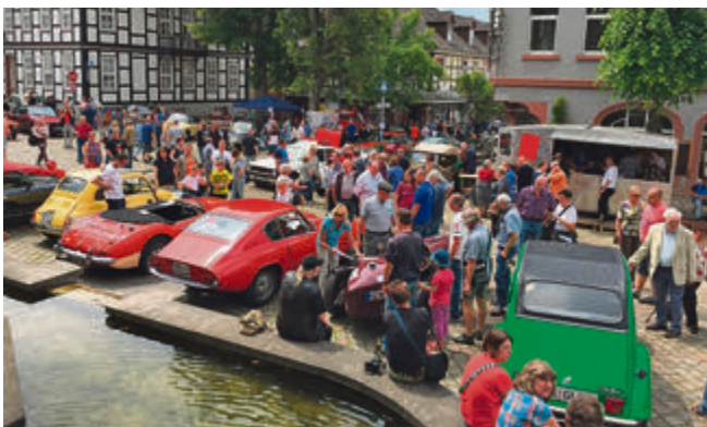
Zum diesjährigen Oldtimertreffen der Siegfried Grösche Stiftung kamen so viele Fahrzeuge wie nie zuvor in Alfelds gute Stube – und jede Menge interessierte Besucher.