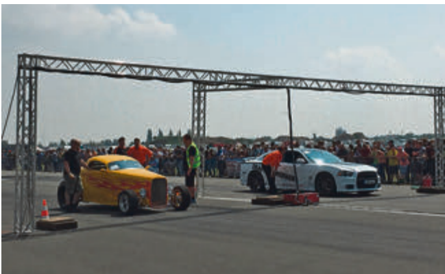
Letzte Startvorbereitungen in der Street-Klasse. Das sind Fahrzeuge, die auch im normalen Straßenverkehr unterwegs sein dürfen – was man dem Gelben nicht unbedingt ansieht...