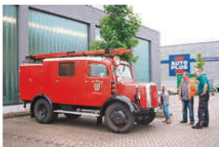
Gut in Schuss: alter Mercedes Feuerwehrgewagen.