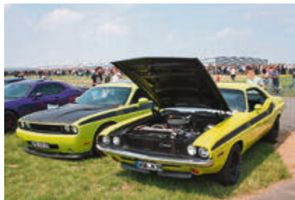
Challenger: Alt vs. Neu.