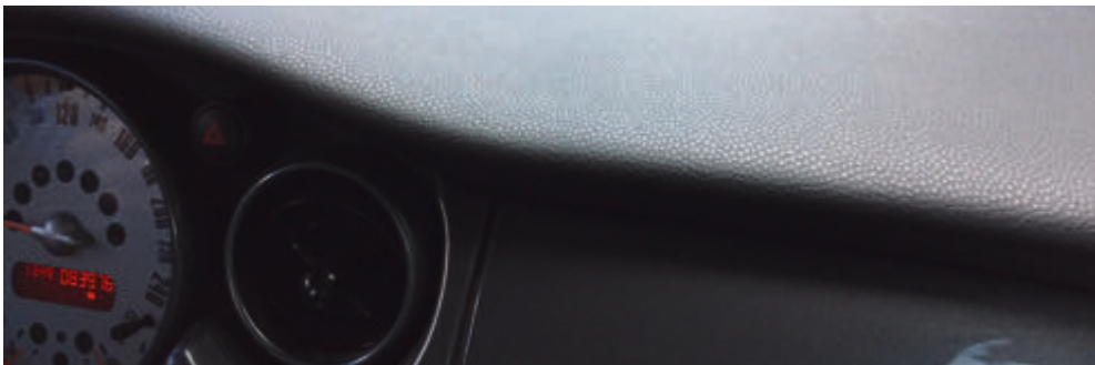
Kunststoffe finden Verwendung an allen Ecken und Enden unserer Autos, z.B. am Armaturenbrett.

Am Ende hat man die unterschiedlichsten „Plastik-Werkstoffe“, von denen ein jeder durch seine einmalige Eigenschaft sein ganz spezielles Einsatzgebiet bekommt. Ob nun als stabiles Lüftungsgitter, gnubbeliger Radioknopf, luftdichter Tankdeckel, flotte Radzierblende, genarbtes Armaturenbrett, weiche Dichtung, durchsichtiges Scheinwerfer-„Klarglas“ oder korrosionsschützender Lackbestandteil. Ja, vereinzelt sogar als kuscheliges Lederimitat Alcantara.