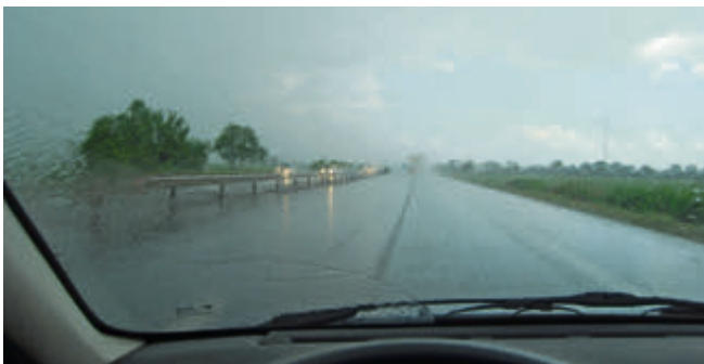
Achtung Aquaplaning: Bei zu hoher Geschwindigkeit verlieren die Räder den Kontakt zur Straße und der Wagen wird manövrierunfähig.

Der ADAC Pfalz empfiehlt allen Autofahrern, bei Regen das Tempo den Verhältnissen anzupassen und die Fahrbahn besonders aufmerksam zu beobachten, um Aquaplaning-Fallen rechtzeitig zu erkennen. Vorbeugend sollten Reifendruck, Profiltiefe, Beleuchtung und Scheibenwischer regelmäßig überprüft werden.