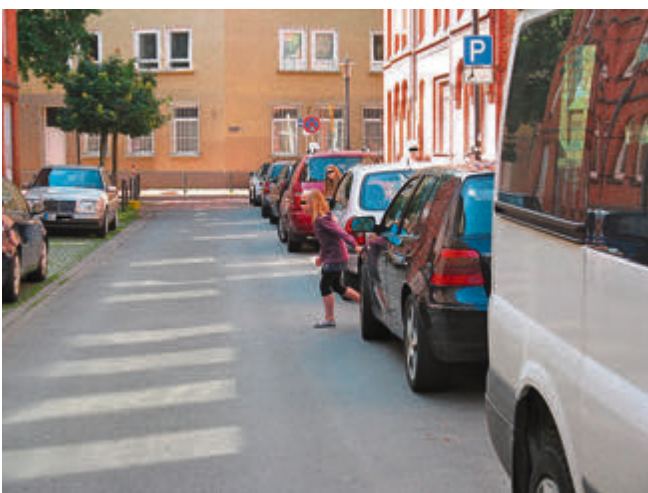
Selbst für langsam fahrende Autofahrer eine überraschende Verkehrssituation.

Rechtzeitig aufstehen und auf den Schulweg begeben, damit kein Zeitdruck entsteht