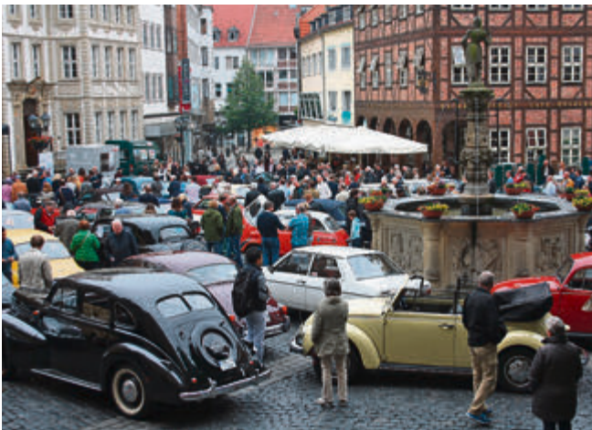
Parkplatz auf dem Marktplatz: in Hildesheims guter Stube herrschte allerlei Trubel.