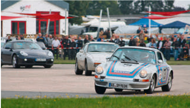
Autos und Motorräder werden sich wieder packende Rennen auf dem Flugplatzrundkurs liefern.