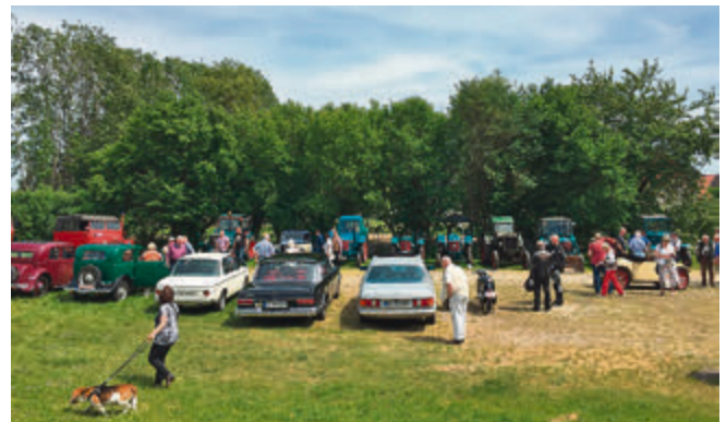
Bei bestem Wetter kamen zahlreiche Besucher nach Störy.