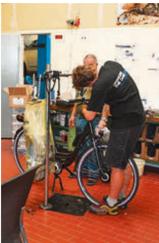
In der Fahrradwerkstatt werden auch Räder repariert, die nicht bei Hornburg gekauft wurden.