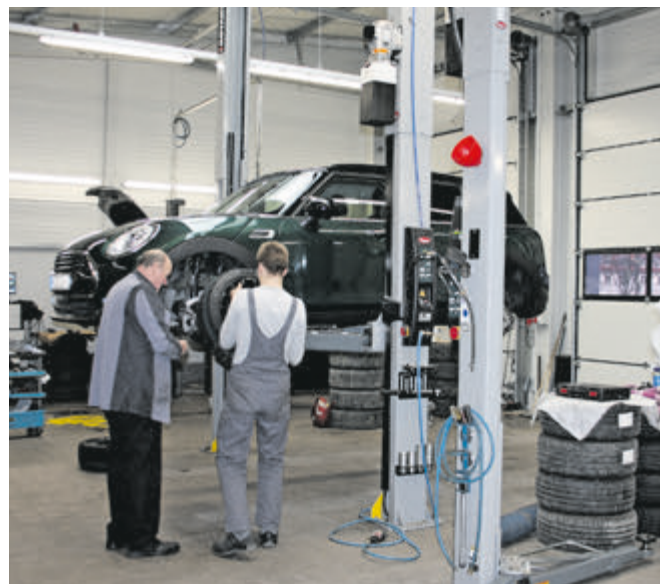
Das Angebot im Autoland Brüggemann reicht vom Räderservice bis zur Inspektion nach Herstellervorgaben.