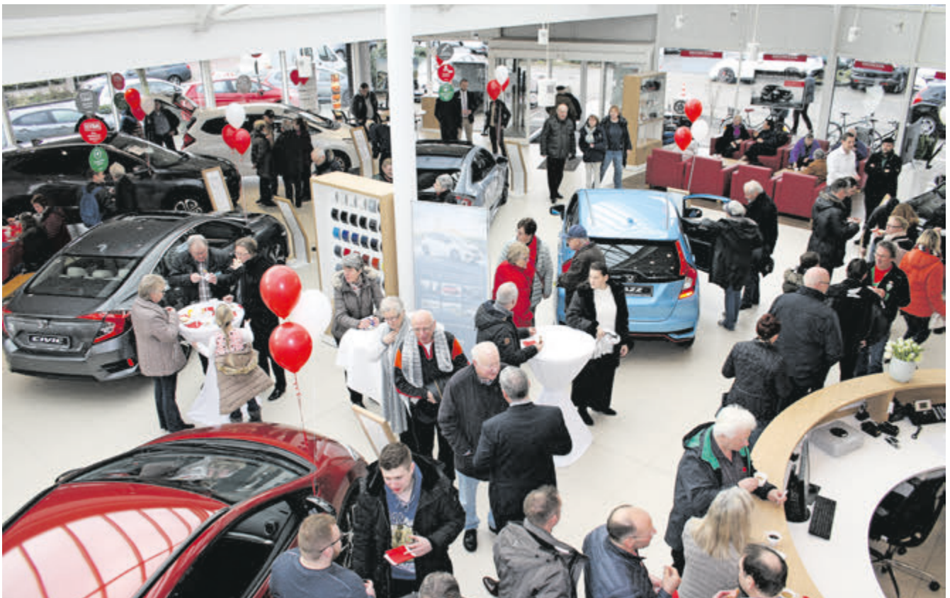
Volles Haus: Das Frühstück lockt jedes Jahr hunderte Besucher ins Autohaus Moritz.

Zur Serienausstattung des kompakten Hondas gehören ein Tempomat und der City-Notbremsassistent. Außerdem verfügen höhere Ausstattungsvarianten über das Infotainmentsystem