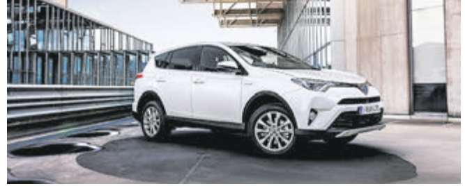
Hybrid zieht: 85 % aller RAV4 werden mit dem alternativen Antrieb geordert.

Das beliebteste Toyota Modell 2017 war der Yaris, der sich mehr als 20.000 Mal verkauft hat. Über 12.100 und damit gut 59 Prozent aller Kunden entschieden sich dabei für den Yaris Hybrid, der damit das erfolgreichste