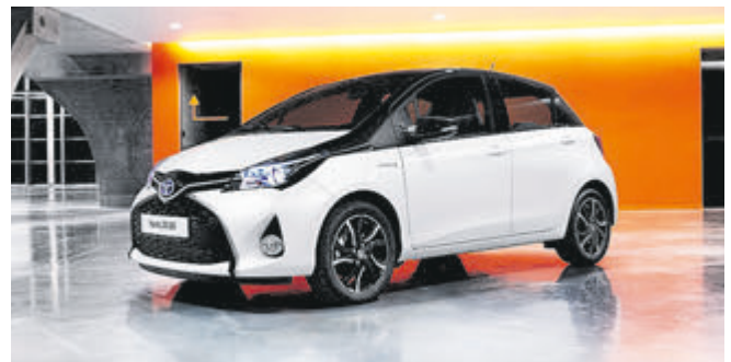
Toyotas Bestseller: Mehr als 20.000 Yaris wurden 2017 in Deutschland verkauft.

Steuerwälder Str. 161 • 31137 Hildesheim Tel. 05121/749960 • www.auto-schuder.de