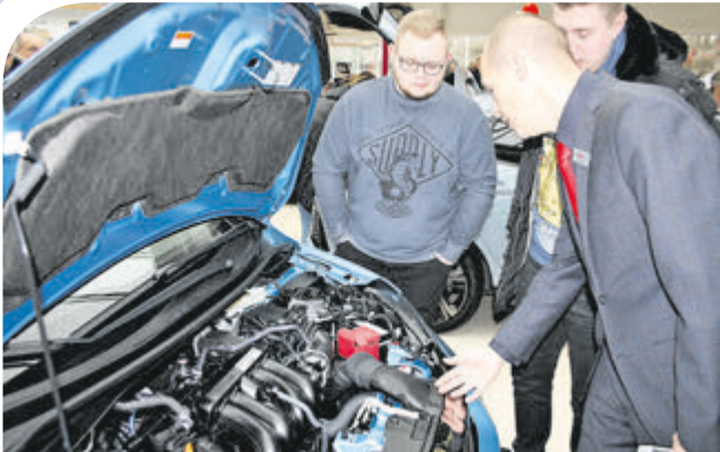
Da lohnte das nähere Hinsehen: der neue 1,5-Liter-i-VTEC-Benzinmotor im Jazz leistet 130 PS.

Honda Connect, eine Rückfahrkamera, ein schlüsselloses Zugangs- und Startsystem sowie Sicherheitstechnologien wie Kollisionssystem, Verkehrszeichenerkennung und Spurhalteassistent.