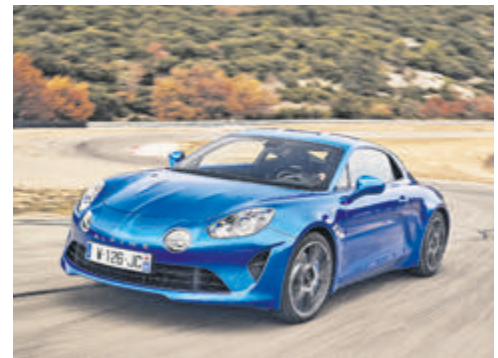
Alpine A110.