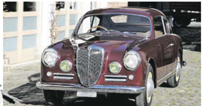
Das Aurelia-Coupé von Lancia gilt als Urvater der Fahrzeugklasse Gran Turismo. Traumautos wie dieses waren in der Sonderschau „Gran Turismo 2+2: Jetset für die Straße“ auf der Bremen Classic Motorshow 2018 zu sehen.