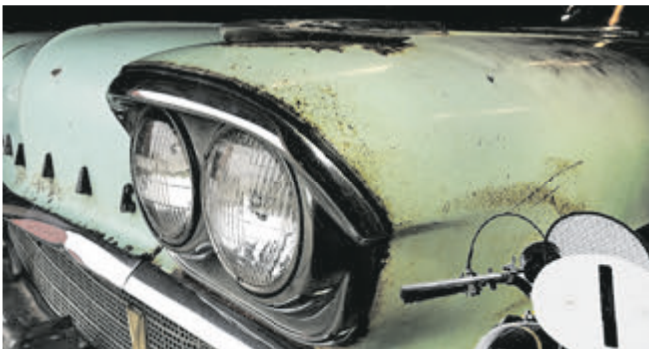
Auch V8-Survivors wie dieser Pontiac Chieftain waren auf der Bremen Classic Motorshow Anfang Februar zu sehen.

denkilometer – ständig werden neue Bestmarken erreicht. Neben dem Aurelia GT führen in Bremen „vor allem solche Traumwagen vor, die manch ewiger Bewunderer bislang nur aus dem Autoquartett kennt“, sagt Frank Ruge, Projektleiter der Bremen Classic Mo-