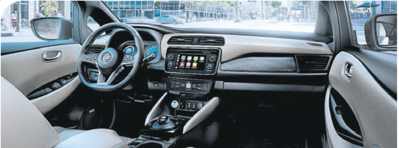
Das Cockpit mit hochwertigen Materialien und Fertigungsqualität sowie mit einer geschmackvollen, schlichten Optik.

Vier hochauflösende Kameras und zwölf Ultrasensoren leiten den neuen Leaf in die Parklücke.