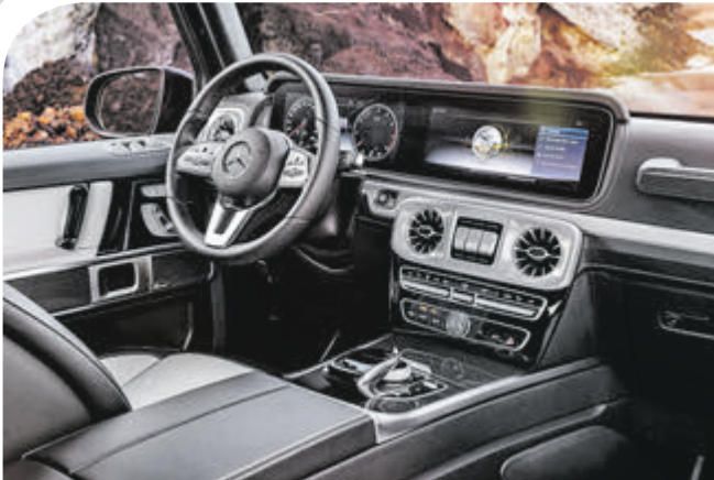
Das große Display mit virtuellen Instrumenten kennt man aus der neuen E- und S-Klasse.