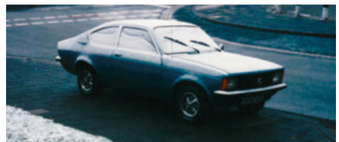
Kaltstart: Jetzt bloß nicht den Motor zu hoch drehen!