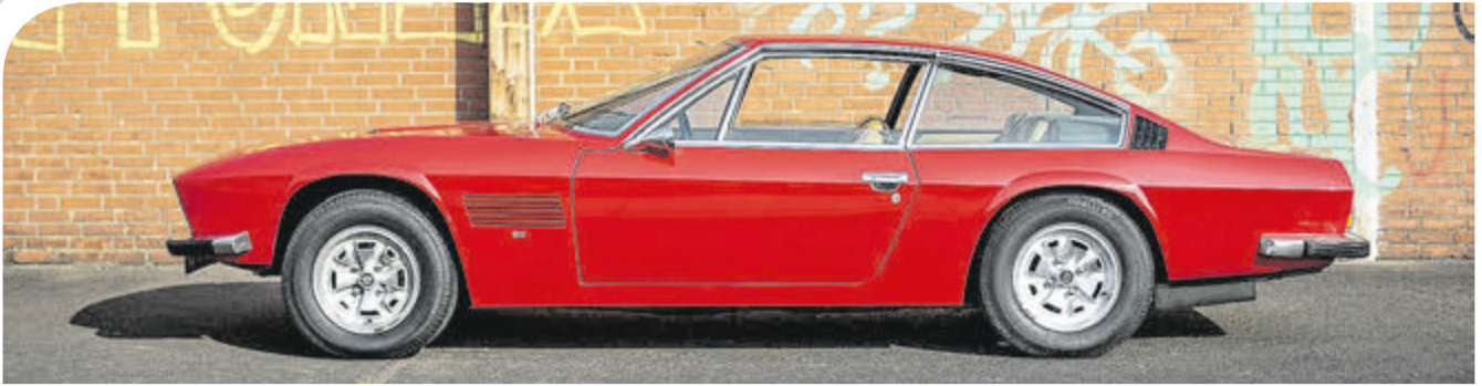
Schnellreise-Coupés wie der Monteverdi High Speed 375 L fuhren bei der Bremen Classic Motorshow 2018 vor.

torshow. Dazu zählten etwa der 7,2-Liter-Bolide Monteverdi High Speed 375 L oder der Gordon-Keeble mit Chevrolet-Corvette-V8-Motor aus England.