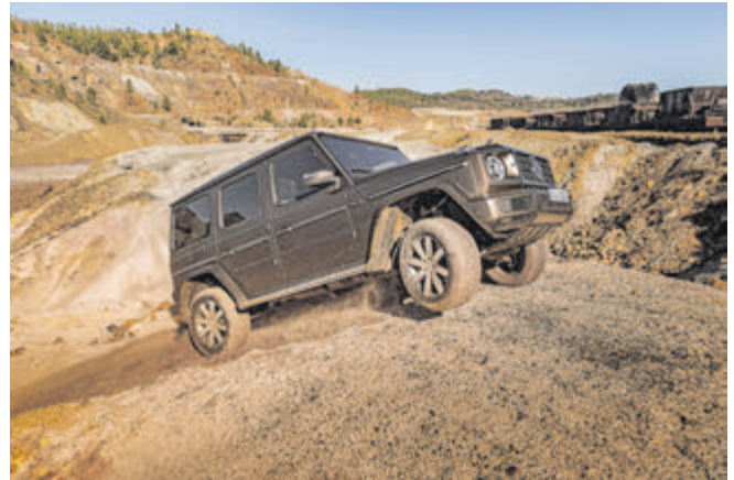
Das konnte sie schon immer: Die G-Klasse macht auch im Gelände einen souveränen Eindruck.

Durchsetzungsfähigkeit und Fahrspaß im Gelände.