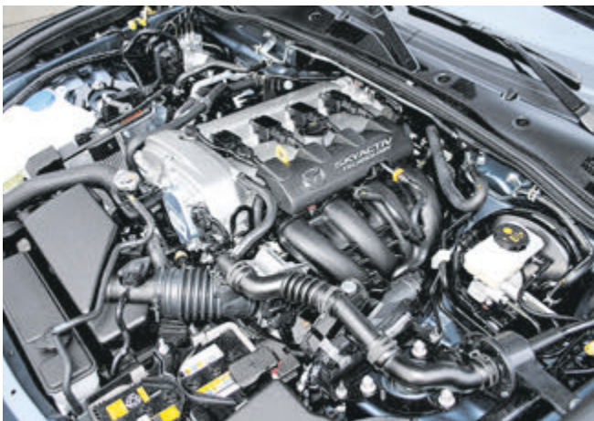
Das, liebe Kinder, ist ein Motor: Der agile 2-Liter-Sauger versteckt sich nicht unter einer Plastikabdeckung.

Jetzt also offen fahren. „Aber nicht ohne Mütze“ klingt mir der Spruch besorgter Eltern in den Ohren. Doch! Und warum? Weil es geht! Tief unten im en-