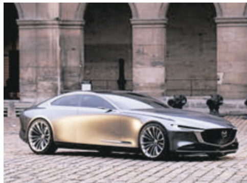
Mazda Vision Coupé.

mit Audi Aicon, BMW i Vision Dynamics, Kia Proceed Concept, Lamborghini Terzo Millennio, Mercedes-AMG Project One, Vision Mercedes-Maybach 6 Cabriolet, Nissan Vmotion und Peugeot Instinct. (ampnet/Sm)