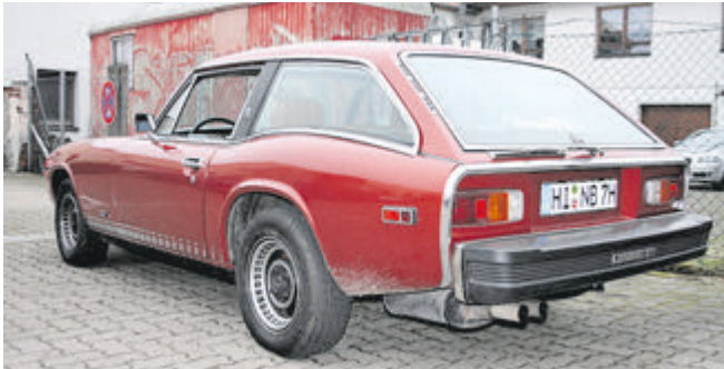
Schicke Shooting-Brake-Linie, die Heckscheibe ist gleichzeitig Kofferraumklappe.