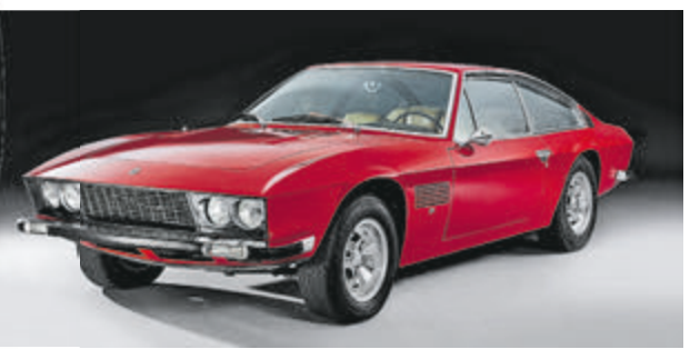
Monteverdi High Speed 375 L