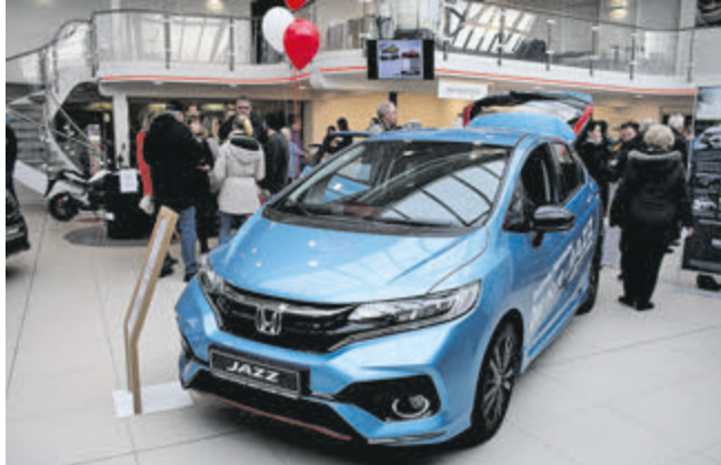
Feierte seine Premiere beim Moritz-Frühstück: der überarbeitete Honda Jazz.

Laatzen (tms). Die komplette Bernd-Rosemeyer-Straße in Laatzen ist zugesperrt, man muss schon suchen, um noch eine freie Lücke zu ergattern, in die das Auto dann auch wirklich reinpasst. Wenn das im Januar passiert, hat das Autohaus Moritz zu seinem beliebten Frühstück geladen. Und auch in den Verkaufsräumen gibt es „the same procedure as every year“: hunderte Besucher tummeln sich zwischen den ausgestellten Fahrzeugen. Kein Wunder, gibt es doch auch immer liebevoll zubereitete Snacks, von Schmalzbröten über belegte Baguettes bis frische Crêpes und leckere Heiß- und Kaltgetränke. Außerdem die aktuellen Modelle von Hyundai und Honda.