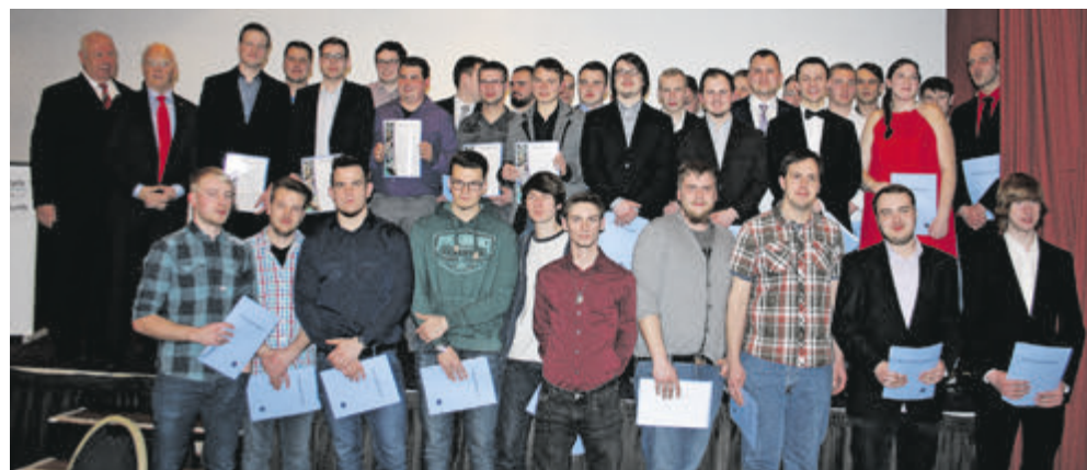
Gruppenbild mit Dame: 37 Kfz-Mechatroniker wurden Anfang Februar im Relaxa freigesprochen.