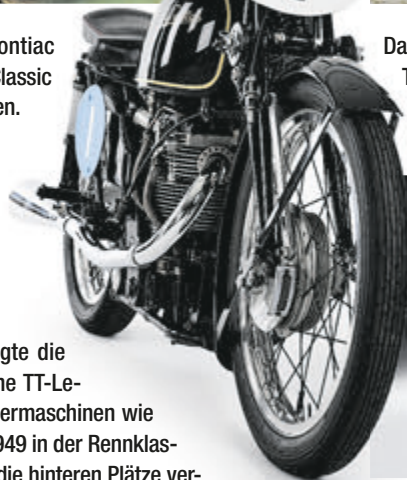
20 englische Rennmaschinen zeigte die Sonderschau „Best of British – The TT-Legends“. Darunter waren auch Siegermaschinen wie die Velocette DOHC 350 ccm, die 1949 in der Rennklasse „Junior TT“ die Konkurrenz auf die hinteren Plätze verwies.