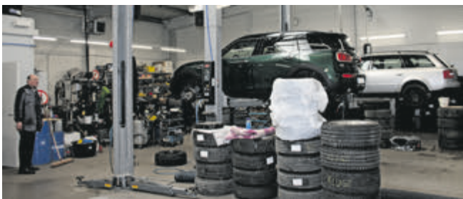
Mit modernen Geräten wird auf drei Hebebühnen der komplette Service einer Kfz-Meisterwerkstatt geboten.