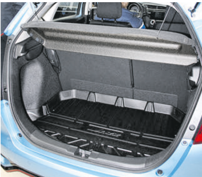
Dank variabler „Magic Seats“ bietet der Honda Jazz ein Kofferraumvolumen von 354 bis 1314 Litern.

So gibt es im neuen Jazz nach wie vor jede Menge Platz auf gerade mal 4 Metern Gesamtlänge. Ein echter Vorteil bei der nächsten Parkplatzsuche.