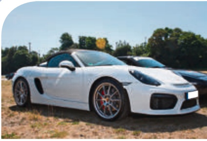
Seltener Spyder: von diesem Modell wurden weltweit nur 2446 Fahrzeuge verkauft, 280 davon in Deutschland.