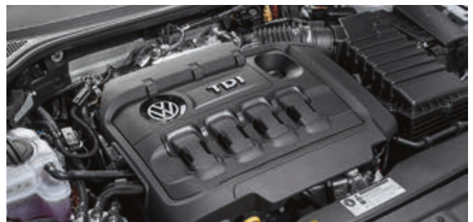
Auch wenn sie derzeit gerne verteufelt werden: Diesel-Motoren (hier ein TDI von VW) kennzeichnet ein besonders hoher Wirkungsgrad und damit maximale Sparsamkeit.

Und auch wenn die Wirkungsgrade moderner Diesel physikalisch schon ziemlich gut und enorm effizient sind, wird sich spätestens im tiefsten Winter kein Fahrer mehr darüber beschweren, dass sein Motor nebenbei noch immer ein wenig wohlige Wärme produziert.