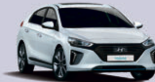
Hyundai IONIQ als Hybrid-, Plug-in-Hybrid und Elektroversion

Die Zukunft ohne lokalen CO 2 -Ausstoß beginnt jetzt! Unsere Hyundai-Elektrofahrzeuge machen das emissionsfreie, umweltschonende Fahren zur alltäglichen Realität. Wir stellen Ihnen alle Antriebsvarianten für eine Probefahrt zur Verfügung: Hybrid-, Plug-in-Hybrid, Elektro und der moderne Brennstoffzellenantrieb.