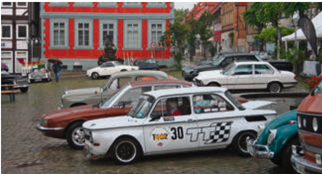
Jetzt aber weg hier: Ein NSU TT macht sich auf den Weg.