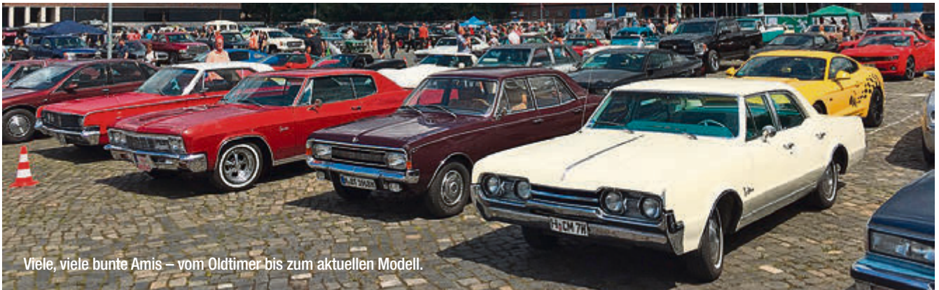
Viele, viele bunte Amis – vom Oldtimer bis zum aktuellen Modell.