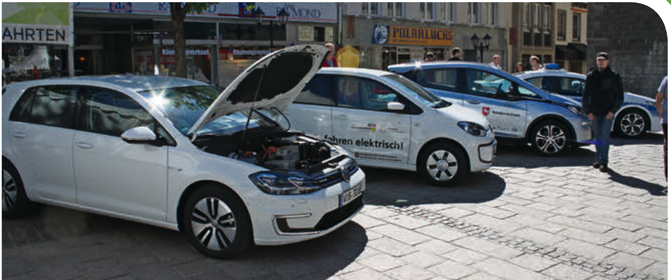
Unterschiedlich E-Mobile, aber auch Hybrid- oder Brennstoffzellen-Modelle stehen zur Probefahrt bereit.