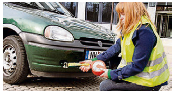
Beim Abschleppen defekter Fahrzeuge sind einige Regeln zu beachten.