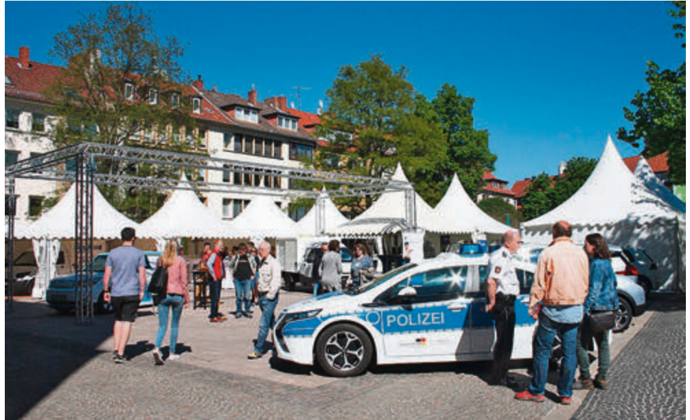
Am 14. September bietet der Hi-Move in der Hildesheimer Innenstadt die Möglichkeit, sich ausgiebig über nachhaltige Energiegewinnung und umweltfreundliche Mobilität zu informieren.

„Nach wie vor ist Umweltschutz, umweltbewusste Energie und Mobilität und insbesondere Elektromobilität kein Thema bei dem wir direkt überall mit wehenden Fahnen empfangen werden. Grund genug für uns, das Thema auch dieses Jahr wieder auf dem Hi-Move in den Focus zu stellen, um auf die Bedeutsamkeit von Umweltschutz aufmerksam zu machen und ein Umdenken anzuregen“, so der Veranstalter. Und die Event-Werft stellt