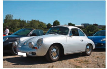
Der Älteste: Porsche 356 SC.

mäßigkeitsrennen, an denen einige Mitglieder teilnahmen. Und seit 2010 richtet der Porsche Club Hildesheim e.V. im Rahmen der Technorama Hildesheim eine eigene Gleichmäßigkeitsprüfung (GLP) auf dem Flugplatzgelände in Hildesheim aus.