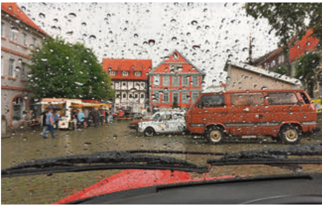
Nein, hier will ich nicht aussteigen...