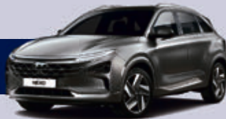
Hyundai NEXO Mit modernem Brennstoffzellenantrieb

Autohaus Moritz GmbH Bernd-Rosemeyer-Str. 2 + 3 30880 Laatzen · Tel. 05102 / 93880 www.autohaus-moritz.de