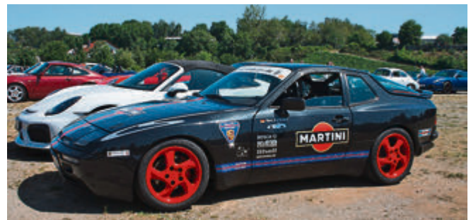
Die „bunte Kuh“ von Dirk Mielke, ein Porsche 944 S2 aus dem Jahr 1989, der mit seinen 211 PS bei der Technorama auch stärkeren Autos gerne mal davonfährt.