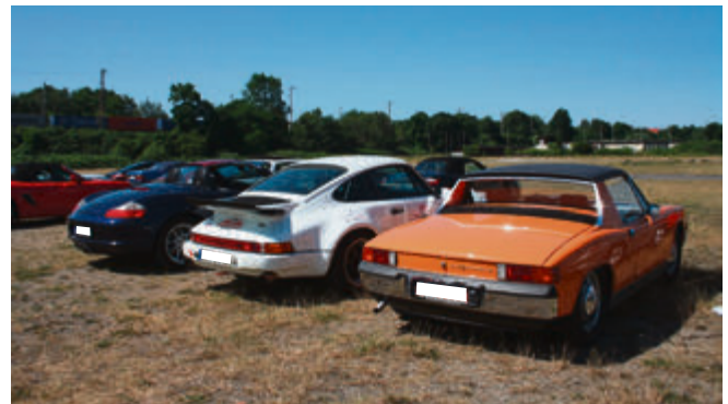
Schöne Rücken: Boxster, 911 und 914 stehen exemplarisch für die Vielfalt der Fahrzeuge im Porsche Club Hildesheim.