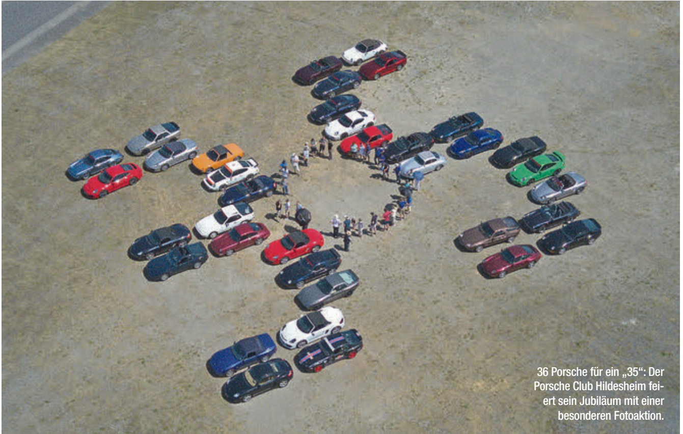
36 Porsche für ein „35“: Der Porsche Club Hildesheim feiert sein Jubiläum mit einer besonderen Fotoaktion.