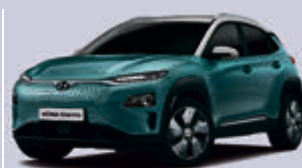
Hyundai KONA Elektro