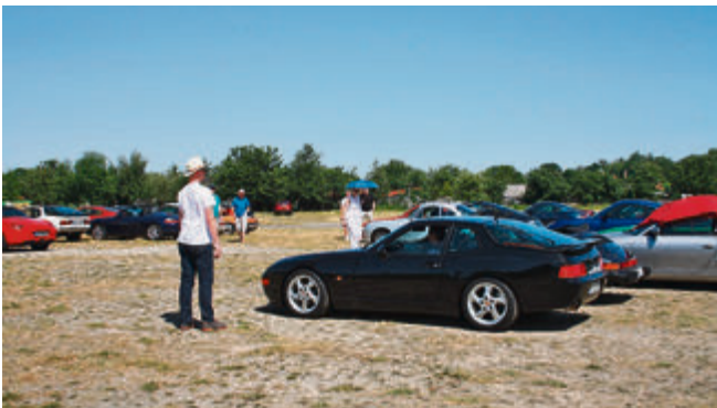
Es wird rangiert und gelotst, bis alle Autos an ihren – am Computer ausgetüftelten – Platz stehen.

In der Clubhistorie gab es zahlreiche Motorsport-Veranstaltungen, wie Slalomläufe, Langstrecken- und Gleich-