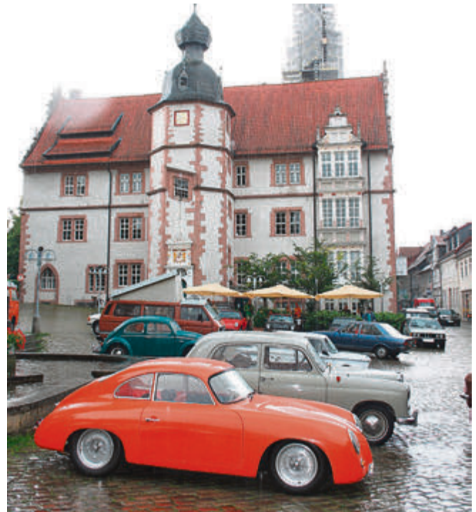
Farbklecks im ganzen Grau: orangefarbener Porsche 356.