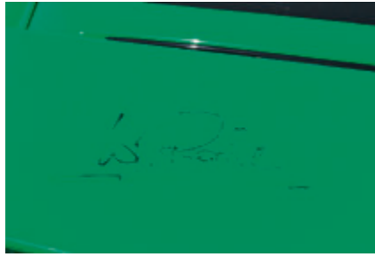
Autogramm vom Besten: Walter Röhl hat sich auf dem Spoiler eines GT3 verewigt.