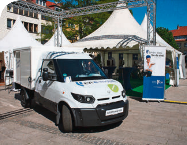
Auf dem Hi-Move zeigen diverse Anbieter, vom Dienstleister bis zum Autohaus, ihr Know-How zum Thema umweltbewusste Mobilität.