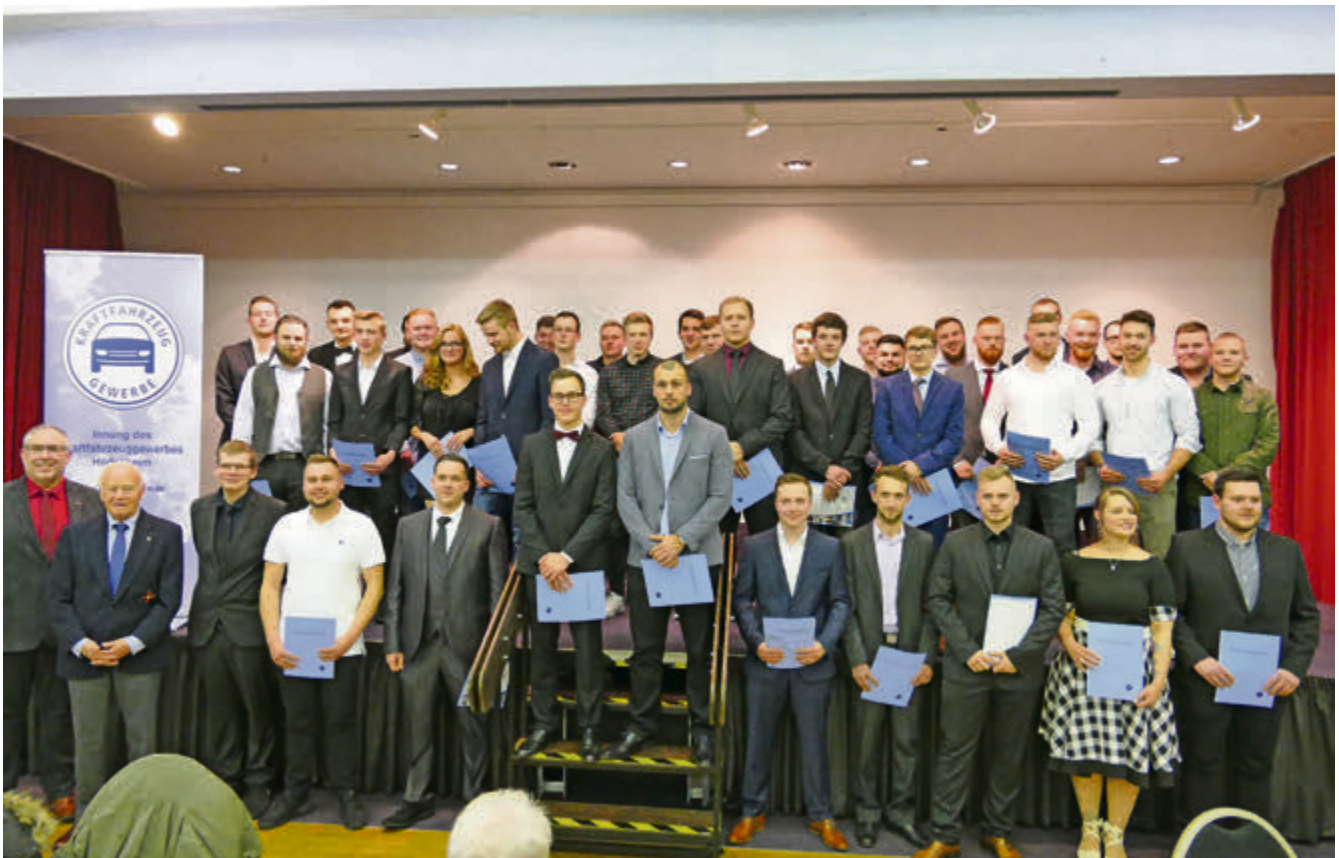
Geschafft: Die neuen Kfz-Mechatroniker haben Ende Januar im Relaxa ihre Gesellenbriefe erhalten.