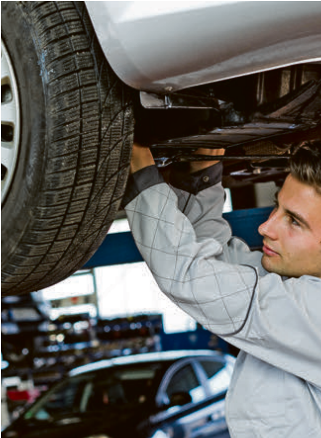
Mit dem Frühjahrscheck in den Kfz-Meisterbetrieben sind Autofahrer auf der sicheren Seite.

Fehlende Flüssigkeiten werden aufgefüllt, verschlissene Scheibenwischergummis ersetzt und zugesetzte Pollen- oder Aktivkohlefilter ausgetauscht. Nun noch die Sommerreifen aufgezogen – so gerüstet steht der Tour in den Frühling nichts mehr im Weg.