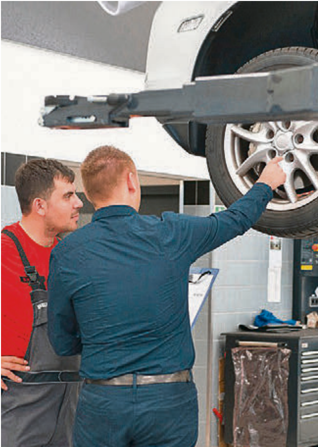
Bei dauerhaften Temperaturen ab 7 Grad Celsius wird es Zeit für den Wechsel auf Sommerreifen.

Im Winter sind Winterreifen erste Wahl. Mit steigenden Temperaturen verlieren die weichen Schlappen mit ihrem groben Profil aber ihre Vorteile. Zeit für den Wechsel auf Sommerreifen.