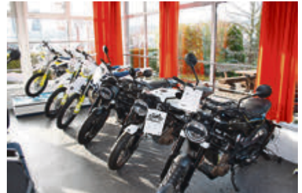
Bereit für die neue Saison, die Enduros und Straßenmaschinen von Husqvarna.