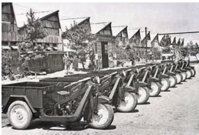
1930 debütierte der Mazda-Go als erstes Motorfahrzeug.

Er kommt im aktuellen Kodo Design, mit neuen Skyactiv-Technologien für geringere CO2-Emissionen und verbesserten i-Activsense-Sicherheitstechnologien. Mehr Sitz- und Fahrkomfort sowie ein abgesenktes Geräuschniveau zeichnen das neue Modell außerdem aus. Für lebhaften Vortrieb sorgt ein 1.5 l Skyactiv-G Vierzylinder-Benzinmotor in den zwei Leistungsstufen 75 PS und 90 PS. Beide Motoren mit serienmäßigem Sechsgang-Schaltgetriebe erhalten ab Werk ein Mild-Hybrid-System, das zu einem kombinierten Kraftstoffverbrauch (nach NEFZ) von lediglich 4,1 Liter Superbenzin auf 100 km beiträgt (94 g/km CO2).