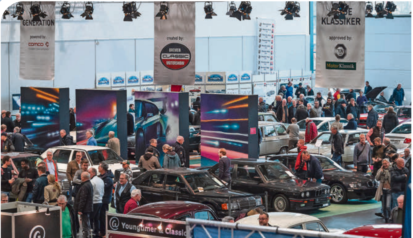
Viel Besucherzuspruch gab es für die Handelsplattformen Young Generation und Junge Klassiker in Halle 6.