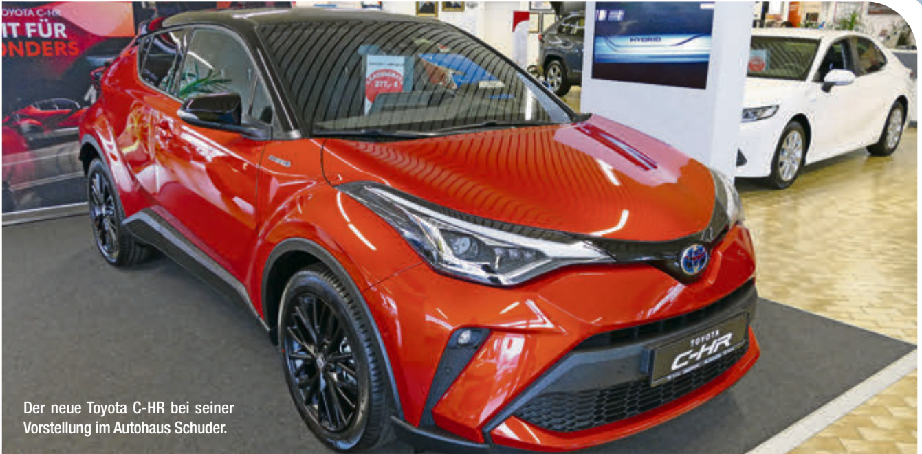
Der neue Toyota C-HR bei seiner Vorstellung im Autohaus Schuder.

Günstige Finanzierung ab 3,99 % – auch OHNE Anzahlung möglich!