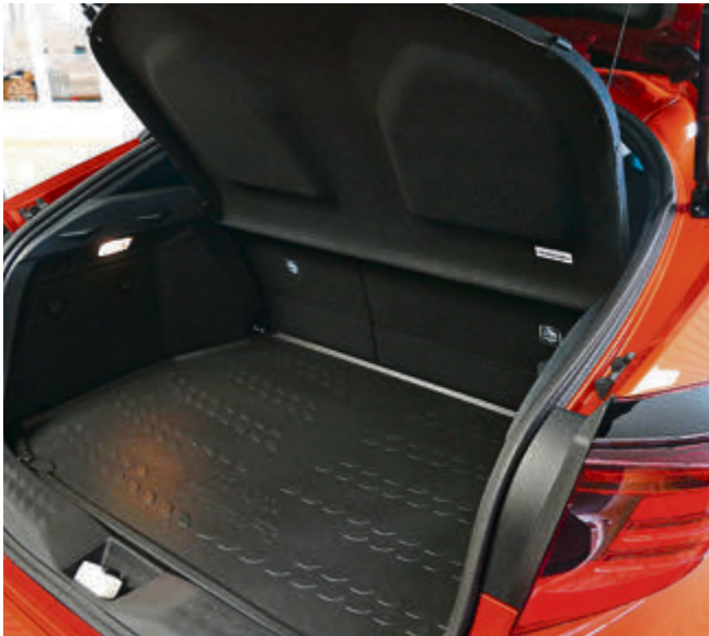
Der Kofferraum hat ein Volumen von 358 Litern.

l/100km, CO 2 -Emissionen kombiniert: 92 g/km). Fahrspaß und Effizienz sollen dabei eine perfekte Verbindung eingehen. Und das ist ja auch was Besonderes.