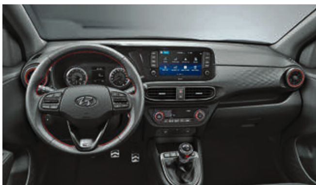
Das Cockpit des neuen Hyundai i10.