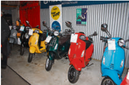
Die aktuellen Vespa-Modelle zeigten sich in vielen Farben und Versionen, darunter die nagelneue Elektrovariante Elettrica.