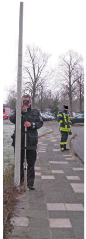
Lasermessung in Drispensstedt

Ihre Hildesheimer Polizei bittet Sie, sich rechtskonform zu verhalten, damit vermeiden Sie ungewünschte Kontrollaktionen. In diesem Sinne eine gute „Weiterfahrt“!