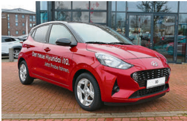
Ein klares Bekenntnis zur konventionell angetriebenen Kleinwagenklasse: Der neue Hyundai i10.

Die Preise für den neuen i10 beginnen bei 10.990 Euro.