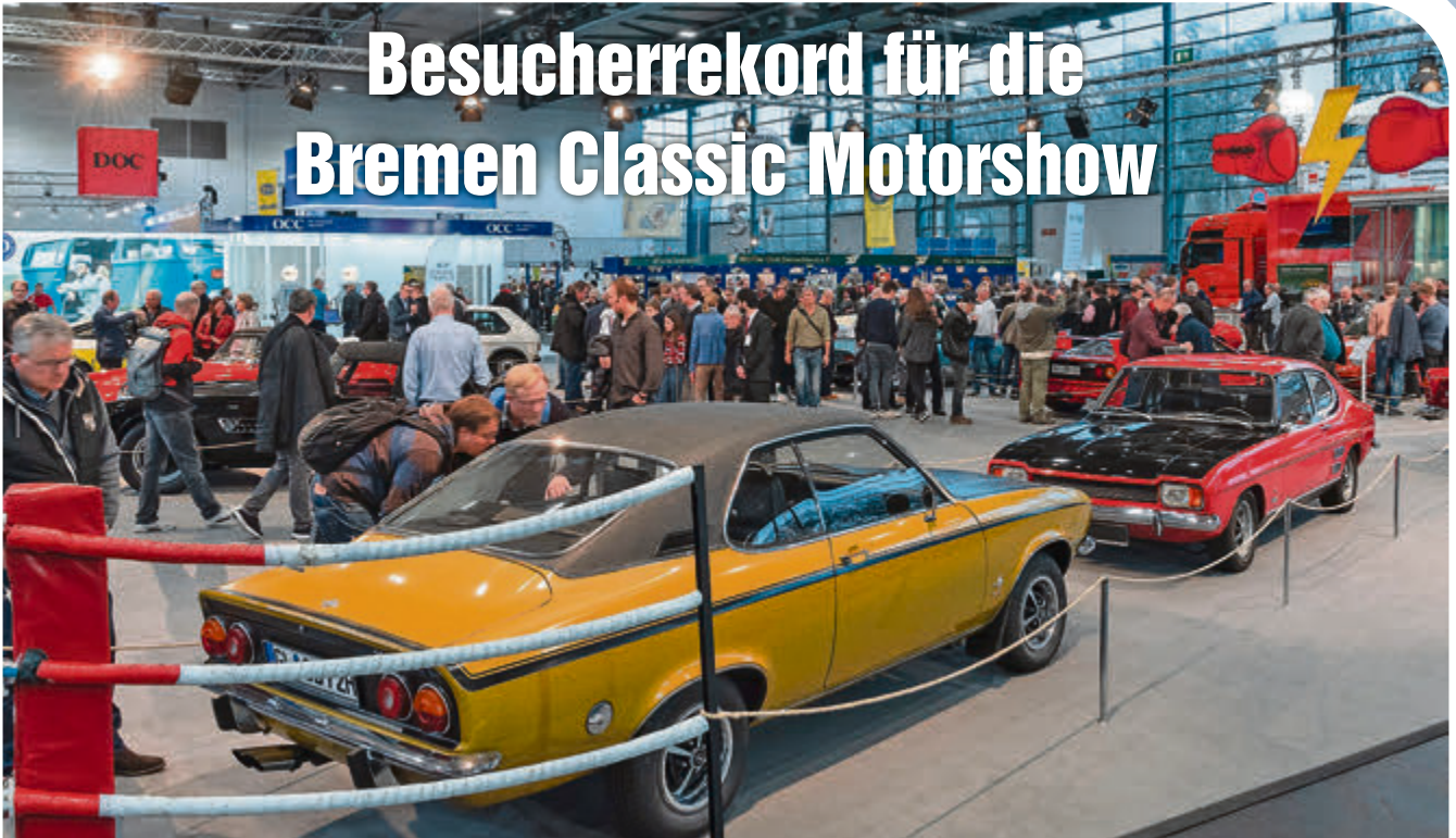
Diese Klassiker weckten Emotionen: Die Auto-Sonderschau konfrontierte erneut Konkurrenten von einst.