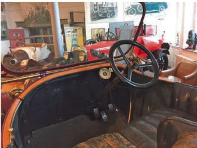
Spartanisches Cockpit eines Sperber. Bis in die 20er Jahre waren auch die deutschen Autos Rechtslenker, da damals die Gefahr noch vom Straßenrand ausging. Mit zunehmenden Gegenverkehr wurde dann auf Linkslenkung umgestellt.

1911 startete die Produktion des zweiten Modells „Sperber“ mit 18 PS und etwa 65 km/h schnell. Durch die hohe Nachfrage wuchs die Belegschaft der Norddeutschen Automobil Werke sowie von Burkart & Günther bis 1912 bereits auf jeweils bis zu 600 Beschäftigte. Karmann hatte in dieser Zeit 120 Mitarbeiter. Mit Beginn des 1. Weltkrieges wurde die Produktion dann jedoch wei-