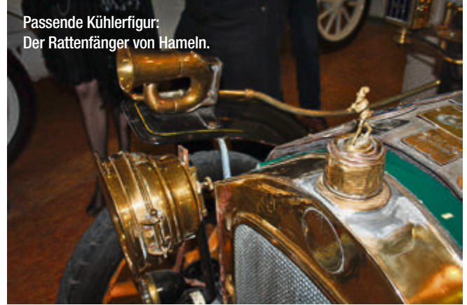
Passende Kühlerfigur: Der Rattenfänger von Hameln.