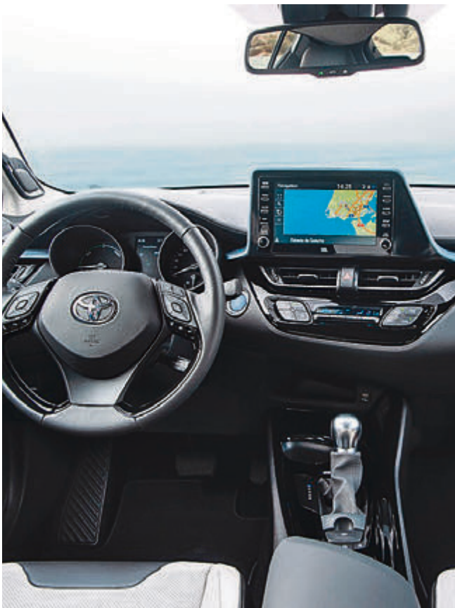
Die visuelle und haptische Qualität aller Oberflächen und Bedienelemente im Innenraum wurde nochmals aufgewertet.