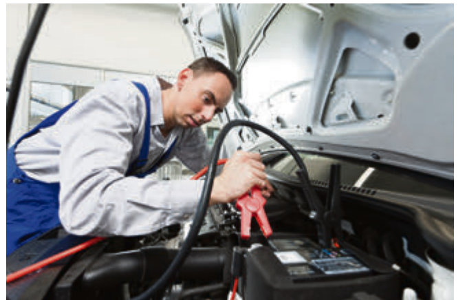
Batterien sind der Pannen-Klassiker in den Wintermonaten. Vor allem elektrische Verbraucher wie die Sitzheizung entziehen den Strom.

In der Kfz-Werkstatt können die Stromspeicher getestet werden. Die Messgeräte ermitteln Kapazität und Kaltstartstrom. Anschließend gibt die Technik eine Empfehlung zur Batterie-Leistung aus. Damit der Anlasser nicht irgendwann nur noch müde muckt.