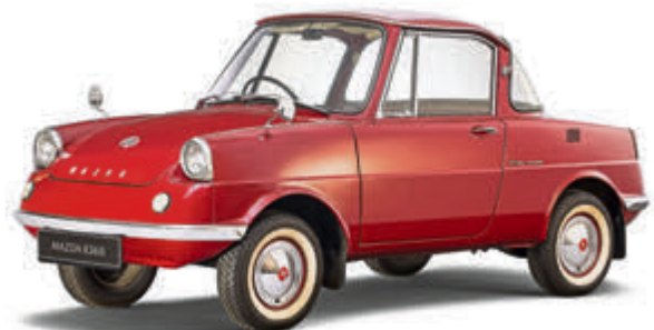
Das 1960 eingeführte Mazda R360 Coupé war der erste Serien-PKW.