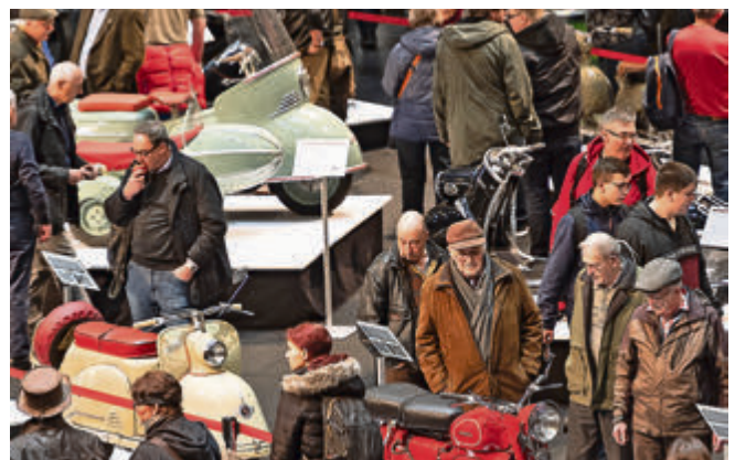
Ein Highlight der 18. Bremen Classic Motorshow: die Sonderschau zu 70 Jahren Motorrollerkultur in Deutschland.