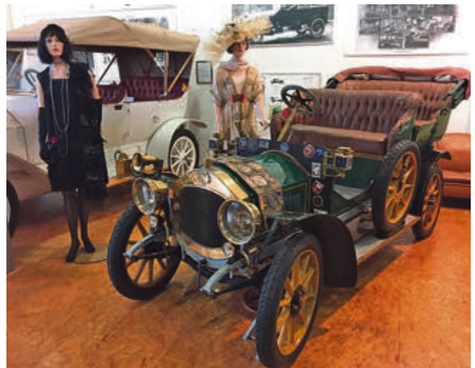
Ein frühes Colibri-Modell von 1908 mit 8 PS-2-Zylinder. Eine technische Besonderheit der Norddeutschen Automobil Werke war der Einbau eines Vorläufers der Startautomatik mit Hilfe einer Bi-Metall-Feder am Vergaser.