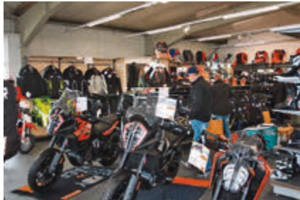
Neben den aktuellen Zweiradmodellen konnte man auch einen Blick auf die Motorrad-Bekleidungskollektion für 2020 werfen.