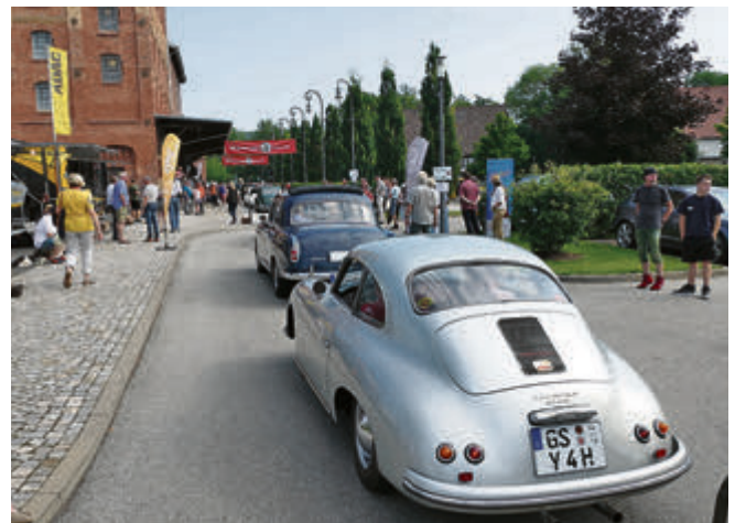
Anstehen zum Start: Für den Porsche 356 A von 1956 und seine Insassen reichte es am Ende für Platz 1 in der Gruppe und Platz 3 gesamt.