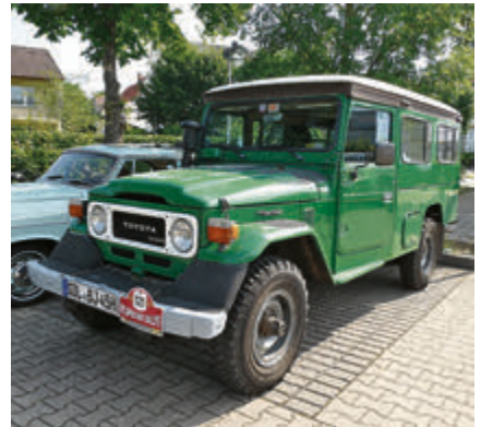
Hätte auch abseits der Straße keine Probleme: 1982er Toyota BJ 45 LV Land Cruiser mit Expeditionsausrüstung.