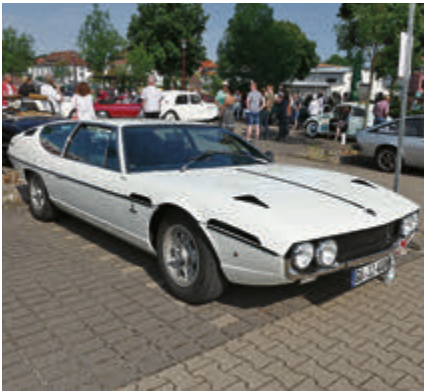
Mit 12-Zylinder unter der flachen Front: Lamborghini Espada von 1970.