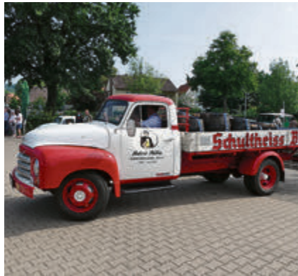
Gab's da keinen Ärger in Einbeck? Opel Blitz Lastwagen – beladen mit Schultheiss-Bier.