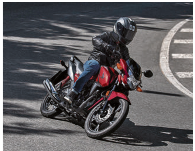
Eine abwechslungsreiche Auswahl an 125er-Bikes gibt es im Autohaus Moritz in Laatzen: Das Einstiegsmodell Honda CB125F – mit gut 10 PS ein praktisches Alltagsbike für den Weg zur Arbeit (Foto), die kultige Monkey und ihren modernen Nachfolger MSX125, den Café-Racer CB125R und diverse Roller.