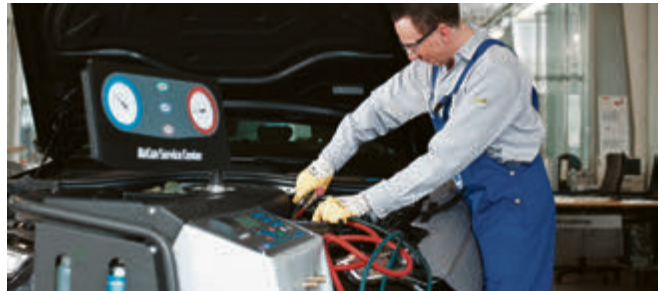
Etwa alle zwei Jahre sollte ein Fachbetrieb die Klimaanlage entleeren und neu befüllen sowie den Filtertrockner auswechseln.

Hundstage, das ist die heißeste Zeit des Jahres, da werden die höchsten Temperaturen gemessen. Gut, wenn die Klimaanlage im Auto dann für Abkühlung sorgt. Doch dafür gibt es ein paar Bedingungen zu beachten.