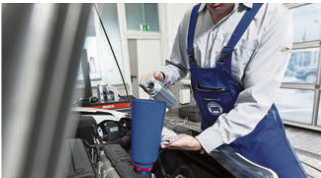
Das für das Fahrzeug zu verwendende Motoröl wird vom Hersteller vorgegeben.

Ein bisschen Ölverbrauch ist bei jedem Auto normal, ab und zu gießt man einen Schluck nach. Nur: Nicht jedes Öl passt zu jedem Motor, und die Sortenvielfalt nimmt weiter zu. Wie findet man das richtige?