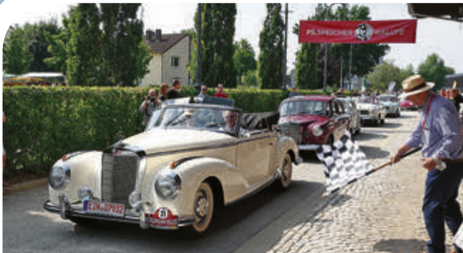
Und los! Das Stifterehepaar Gabriele Rehkopf-Adt und Karl-Heinz Rehkopf machen sich – passend zum Wetter – in einem offenen Mercedes-Benz 300 S auf die 150 Kilometer lange Rallye.