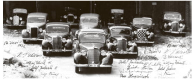
Gründungsfoto MVC Hannover

Im Laufe der Jahre etablierte sich das Treffen an Pfingsten in der Stadt Ladenburg am Neckar. Hier hatte Carl Benz seine Wirkungsstätte und auch die Firma C. Benz Söhne hatte hier lange Jahre ihre Heimat. In den historischen Gebäuden findet sich heute das sehenswerte Automuseum von Dr. Carl Benz.