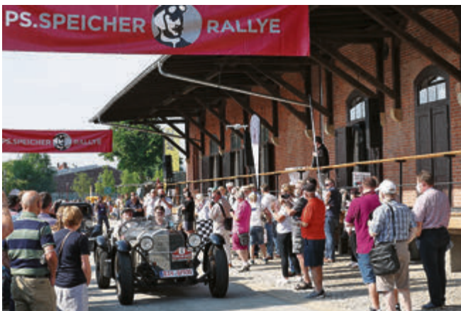
Unter dem Applaus der Zuschauer macht sich ein rarer Mercedes-Benz SSK von 1929 auf den Weg.