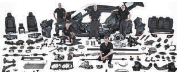
Mazda CX-5 in Einzelteilen – mit dem AUTO BILD Testteam.

Note eins für den Kompakt-SUV-Bestseller: Der Mazda CX-5 hat den 100.000-Kilometer-Dauertest der Fachzeitschrift „AUTO BILD“ mit Bravour bestanden. Nicht nur im Alltagseinsatz überzeugte das Mazda Erfolgsmodell die Redakteure; auch in Sachen Zuverlässigkeit und beim technischen Zustand gab sich der CX-5 keine Blöße. Ohne nennenswerte Mängel und mit einwandfreier Werkstattdienstleistung verdiente sich das Kompakt-SUV eine der besten Noten, die jemals in einem Dauertest vergeben wurden. In der ewigen Bestenliste von inzwischen 68 Fahrzeugen reichte das für Platz 4.