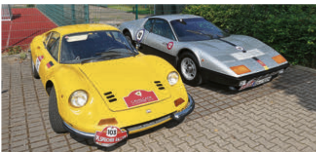
Zwei echte Schmuckstücke aus Maranello: Ferrari Dino 246 GT von 1973 und Ferrari 512 BB von 1980.