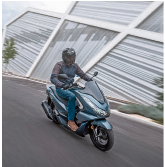
Mit dem 125er Roller durch die Stadt schlängeln - das geht auch mit dem PKW-Führerschein.

zu fahren. Voraussetzung: man ist über 25 und seit mindestens 5 Jahren im Besitz des Klasse-B-Scheins. Zur Fahrschule geht es trotzdem – aber eine Prüfung entfällt. Es müssen lediglich Fahrer Schulungen mit theoretischen und praktischen Unterrichtseinheiten besucht werden – und der Fahrlehrer entscheidet schlussendlich, ob man