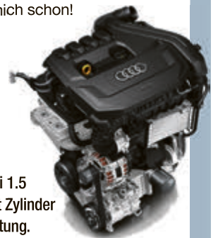
Der Audi 1.5 TFSI mit Zylinderabschaltung.

Das Abschalten der Hälfte der Zylinder bewirkt also leider keine sofortige Halbierung des Verbrauchs. Eine Verringerung um bis zu 15% bis 20% sind aber durch diese technische Lösung durchaus drin. Und das ist bei den ausgereizten Motoren heutzutage schon ein beachtlicher Wert. Nebenbei: jetzt habe ich schon ein Thema fürs nächste Mal. Die benzinertypische nachteilige quantitative Gemischregulierung gegen die dieseltypische vorteilhafte Qualitäts-Gemischregulierung – ich freue mich schon!