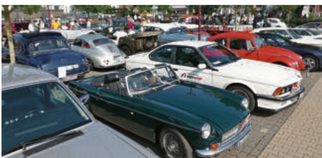
Warten auf den Rallye-Start: Der Parkplatz am PS.Speicher wurde zum Outdoor-Museum.