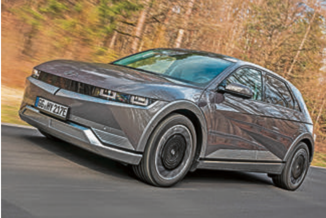
Hyundai Ioniq 5

„Was gibt es alles für alternative Antriebsarten – und welche ist für meine Bedürfnisse die geeignetste?“ Fragen, die sich viele Autokäufer heute stellen. Das Autohaus Moritz in Laatzen hat die Antwort: Mit seinen Marken Honda und Hyundai bildet das Unternehmen die komplette Palette aktueller Antriebsalternativen ab, von Hybrid über Elektro bis hin zu Wasserstoff.