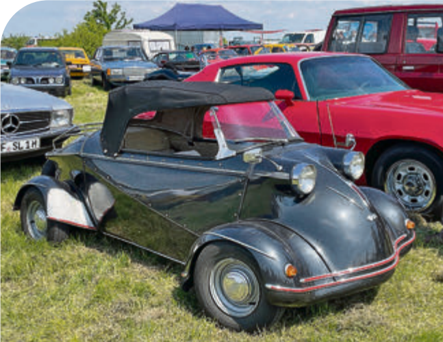
Seltener FMR Tg 500 – auch bekannt als Messerschmitt „Tiger“, die vier-rädrige Variante des Kabinenrollers.