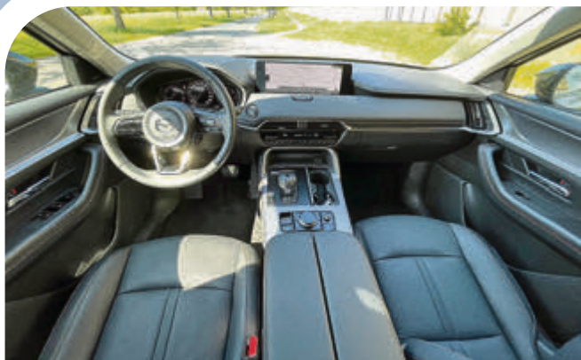
Kommandozone: Das Cockpit hinterlässt mit edlen Materialien und hervorragender Verarbeitung einen schmeckenden Eindruck.

nicht schlecht für ein 2-Tonnen-SUV. Das auch eben nicht gerade schlapp auf der Brust ist. In 8,4 Sekunden wird das Trumm auf Landstraßengeschwindigkeit gedrückt, untermalt von einem kernigen (aber wohl künstlich generierten) Sound, dabei zieht er gleichmäßig hoch, die neue Achtstufen-Automatik, die als Besonderheit über eine Mehrscheiben-Eingangskupplung verfügt, sorgt sauber für die stets richtige Fahrstufe. Klar ist ein SUV kein Sportler, in schnellen Kurven neigt er zuweilen zum Neigen, das „Kinematic Posture Control System“ sorgt aber jederzeit für ausreichende Fahrstabilität.