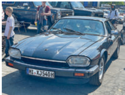
Zum Jungs-Ausflug das erste Mal mit dem eigenen Oldtimer auf der Technorama: Der Chauffeur dieses Jaguar XJS.