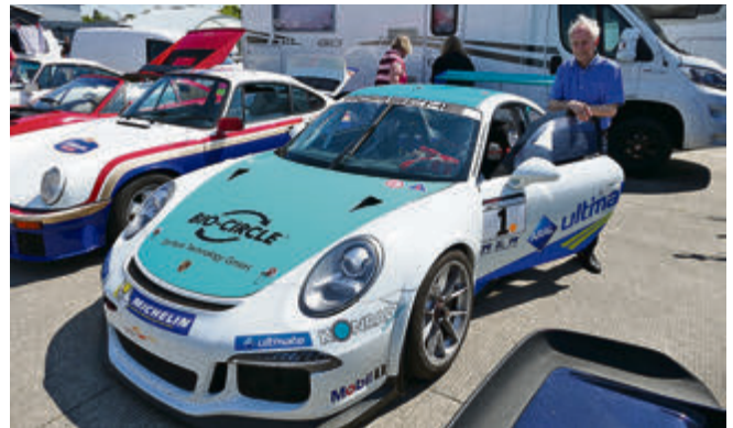
Porsche-Profi Gerhard Stahl kam mit diversen Autos zur Technorama, wie diesem Cup-Porsche – um sie, zusammen mit seinen Mitarbeitern, natürlich auch standesgemäß um den Rundkurs zu bewegen.