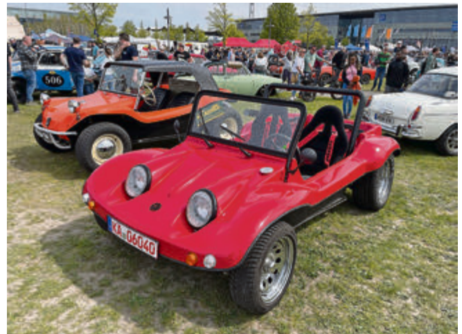
Spielmobil: Die beliebten Buggys.