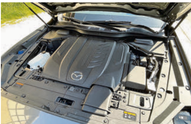
Schade: der 3,3-Liter Reihensechszylinder Diesel versteckt sich unter jeder Menge Kunststoff.