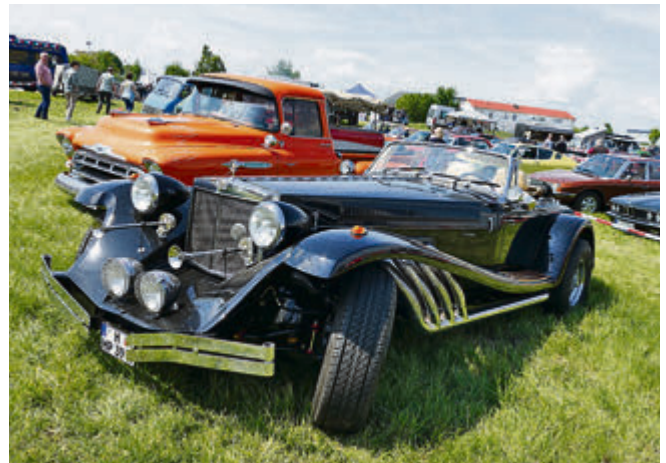
Clénet baute in den 70er und 80er Jahren Autos im Neo-Klassik-Stil. Hier das Modell der 1. Serie.