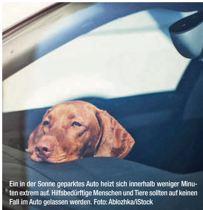
Ein in der Sonne geparktes Auto heizt sich innerhalb weniger Minuten extrem auf. Hilfsbedürftige Menschen und Tiere sollten auf keinen Fall im Auto gelassen werden.