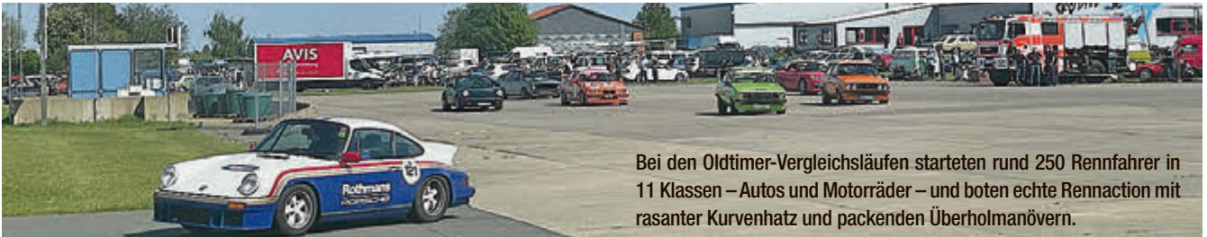
Bei den Oldtimer-Vergleichsläufen starteten rund 250 Rennfahrer in 11 Klassen – Autos und Motorräder – und boten echte Rennaction mit rasanter Kurvenhatz und packenden Überholmanövern.