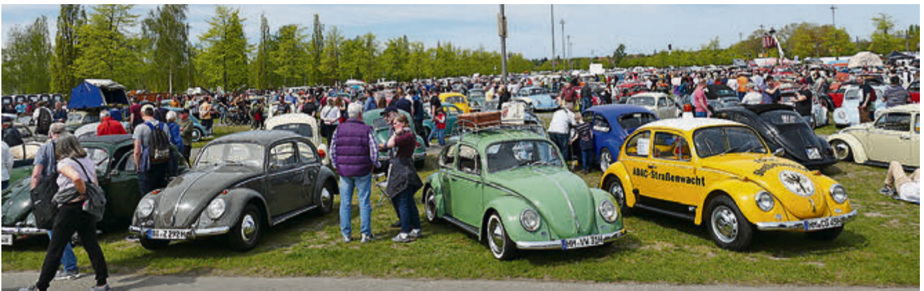
Volkswagen bis zum Horizont