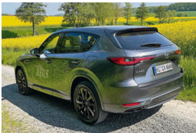
Hinterm voluminösen Heck verbirgt sich ein ebensolcher Gepäckraum: 570 bis 1726 Liter kann der Mazda transportieren.

Ein Reihensechszylinder Diesel ist ein Reihensechszylinder Diesel! Ein famoser Motor in einem famosen, geräumigen, qualitativ überzeugenden Auto, kräftig, lauffähig und überraschend sparsam.