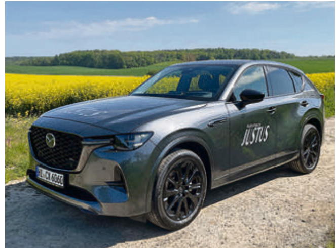
Hochragender Kühlergrill, lange Haube, zurückgesetzte Fahrgastzelle: der Mazda CX-60 präsentiert sich als ausgewachsenes SUV.

Und danke auch für die Sitzbelüftung, die Sonne knallt an diesem Frühlingstag doch schon recht kräftig