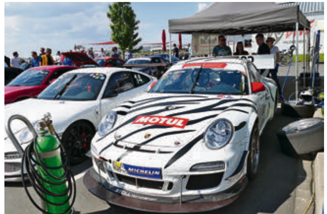
War sauschnell unterwegs und hatte dabei einen fantastischen Sound: der Porsche mit MePoRes-Chef Florian Ulbricht am Steuer. Fortsetzung nächste Seite