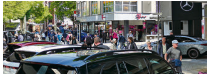
Die Mobilitätsmeile sorgte wieder für eine volle Innenstadt.