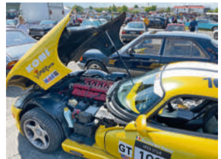
Zeigt, was sie hat: Dodge Viper mit kräftigem 10-Zylinder unter der Haube.