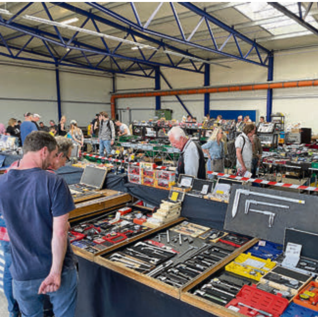
An den vielen Ständen des Teilemarktes fanden Sammler und Schrauber so ziemlich alles, was das Herz begehrt.