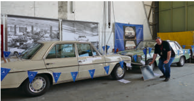
Es durfte abgestimmt werden: Anlässlich des 50. Geburtstags der 2. Serie (grünes Fahrzeug) des Mercedes „Strich Acht“, zeigte der Mercedes Veteranen Club die Unterschiede zur 1. Serie (beiges Modell) und fragte welches Modell den Besuchern der Technorama besser gefiel. Gewonnen hat die 1. Serie.