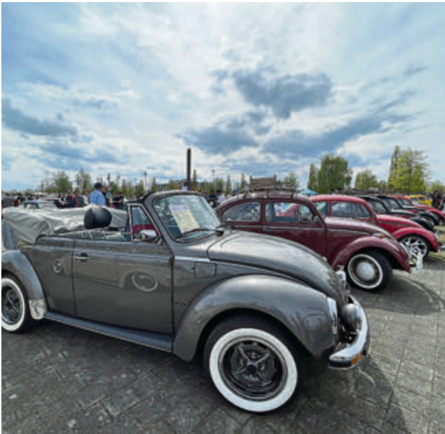
1979er Käfer 1303 Cabriolet mit 85-PS-Oettinger-Motor.

Wer wollte, konnte sein Auto – und die dazugehörigen Geschichten – auf der Bühne vorstellen, launig moderiert von Otto Meyer-Spellbrink.