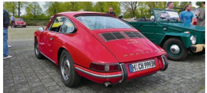
Auch Verwandtschaft war willkommen, wie der Porsche 911, hier mit seltener Sportomatic.