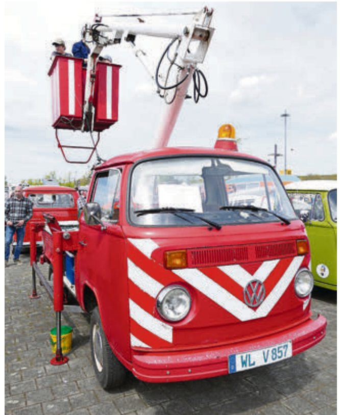
Tut noch immer seinen Dienst: Ruthmann-Steiger aus dem Jahr 1967.