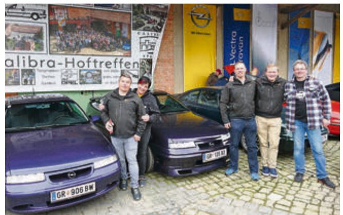
„Die Österreicher“ haben sich u.a. aus der Nähe von Wien auf den Weg zum Hoftreffen gemacht.