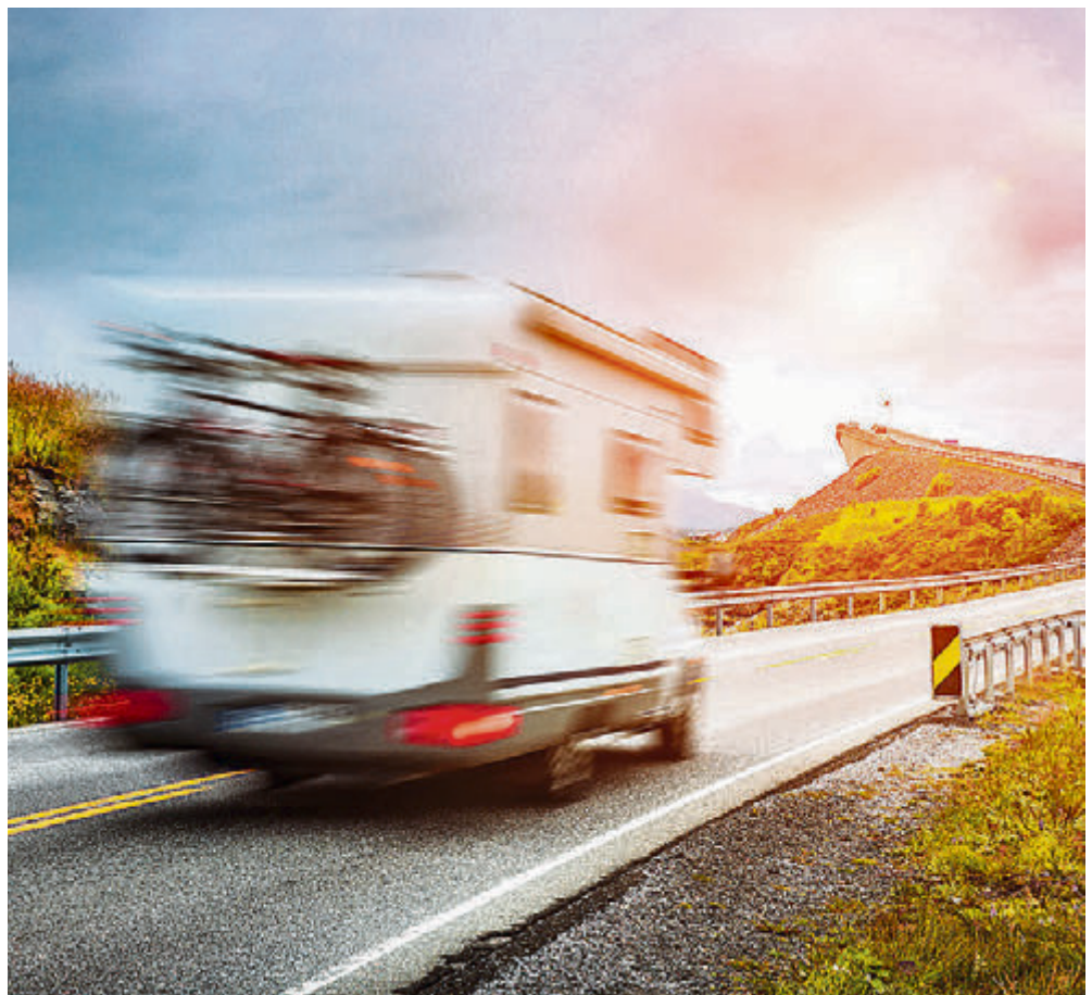
Reisemobile erfreuen sich immer größerer Beliebtheit.

Gießereistr. 4 · 31180 Giesen-Emmerke Telefon 05121/6050176 www.dillmann-caravan-technik.de