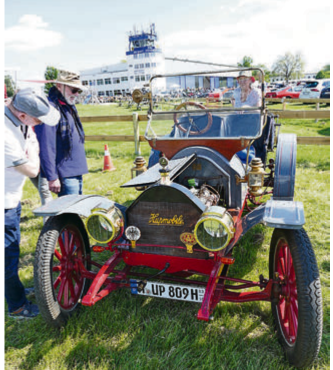
Das Hupmobile war eins der ältesten Fahrzeug auf dem Platz.