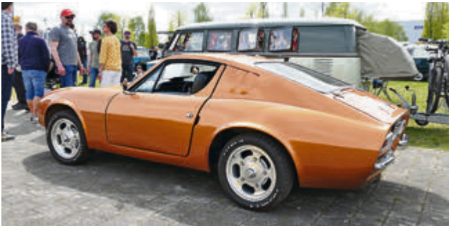
Puma GT von Bromer Motor Südafrika auf gekürztem Käfer-Chassis mit Typ 4 Motor.

Wir waren auf dem Gelände unterwegs und zeigen ein paar interessante Exemplare: