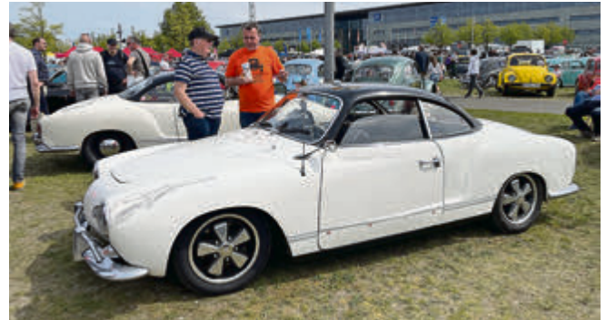
Karman Ghia sind auch immer gern gesehene Gäste des MaiKäferTreffens.