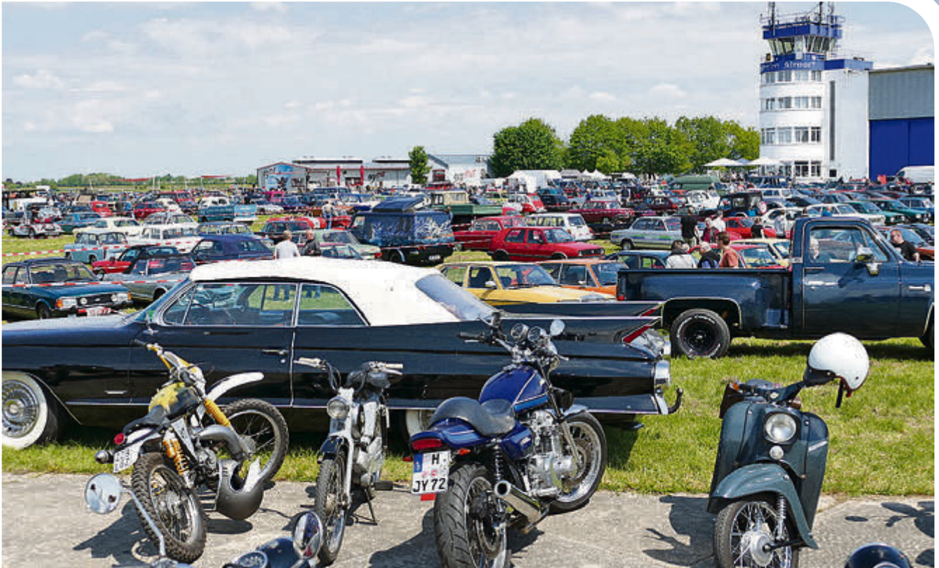
Oldtimer, soweit das Auge reicht. Auch dieses Jahr kamen wieder jede Menge Klassiker zur Technorama auf das Hildesheimer Flugplatzgelände.