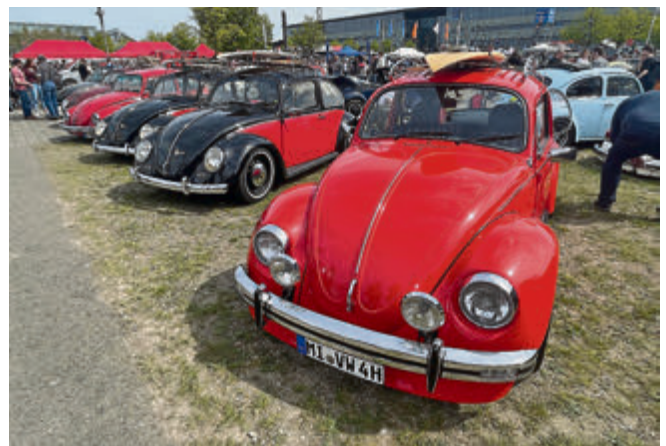
Das freut die Besucher: Käfer unterschiedlicher Baujahre und in diversen Varianten.