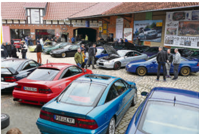
Serienmäßige Sportcoupés neben verbreiterten und verspoilerten Varianten: Auf dem Hoftreffen ist für jeden Geschmack etwas dabei.