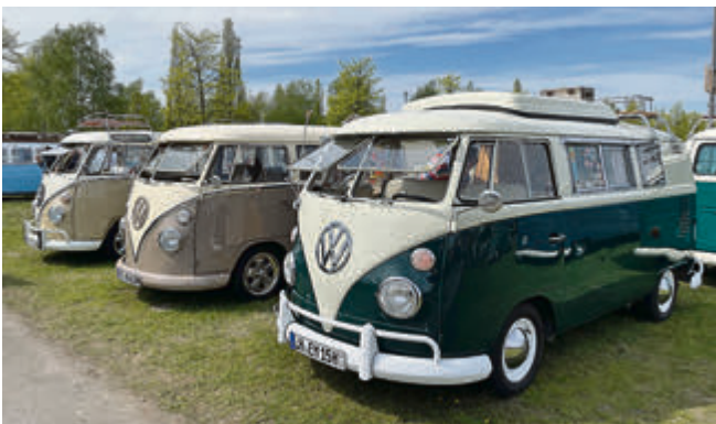
Haben längst Kultstatus: Die beliebten Bulli T1.